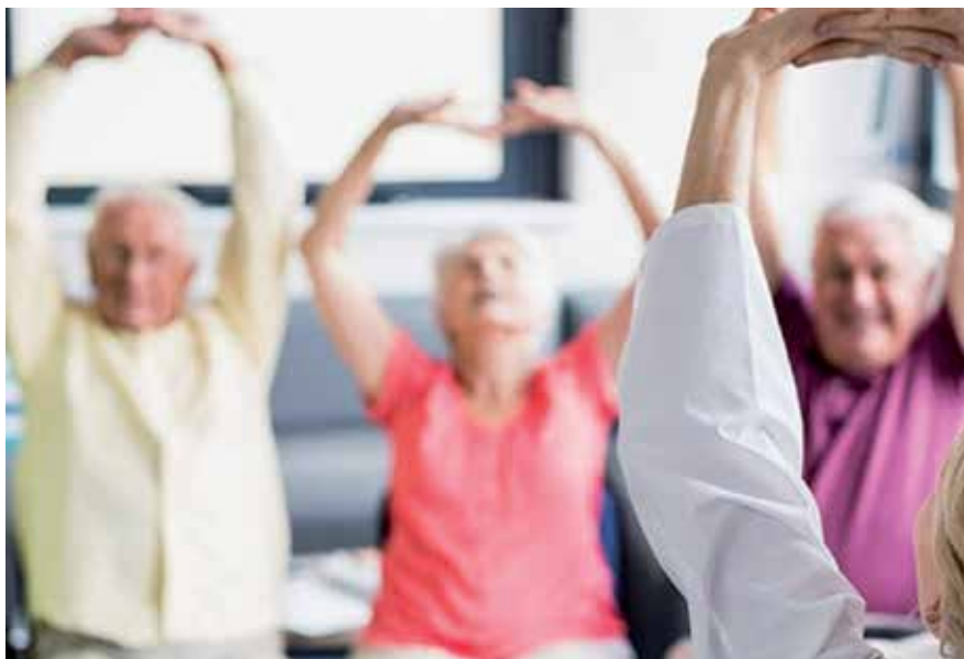
▲ Este verano se presenta cargado de actividades para el bienestar físico de nuestros mayores.

El Ayuntamiento, concretamente la Delegación de Personas Mayores, pone en marcha un conjunto de actividades desde el Programa de actividad física y educación para la salud, para los meses de verano, junio, julio y agosto. En total 440 plazas para psicomotricidad, espalda sana, flexibilidad, psicomotricidad dirigida a mayores frágiles, así como alguna salida de marcha, de todo el día, en autocar.