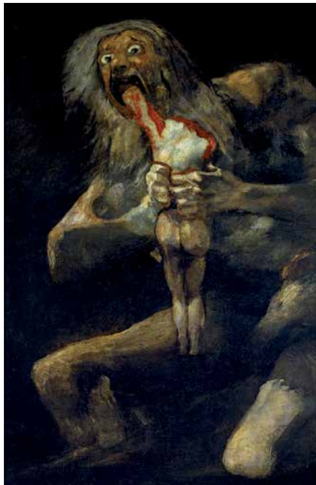
▲ 'Saturno decorando a sus hijos', de Goya, una de las obras que se mostrarán en Los martes del arte.