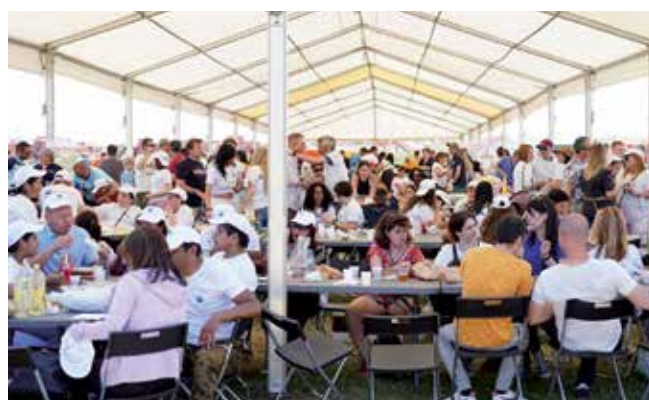
▲ La caldereta de este año se ha significado por la gran participación y confraternización de vecinos después de la pandemia.