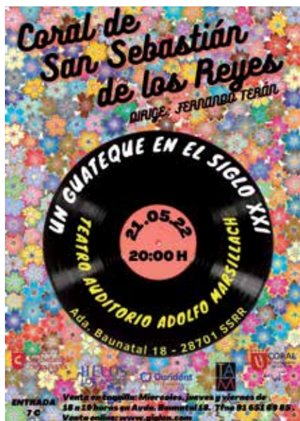
▲ Viaje a los tiempos del guateque con la Coral, el día 21.