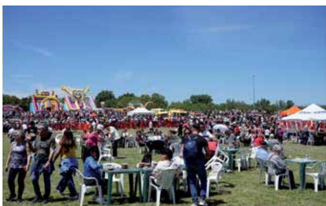
▲ El Ayuntamiento dispuso de una carpa, además de juegos y espacio para los más pequeños.