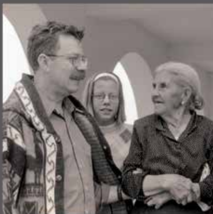
▲ Nuevo Mester de Juglaría, el día 20, en el Centro de Formación Marcelino Camacho.