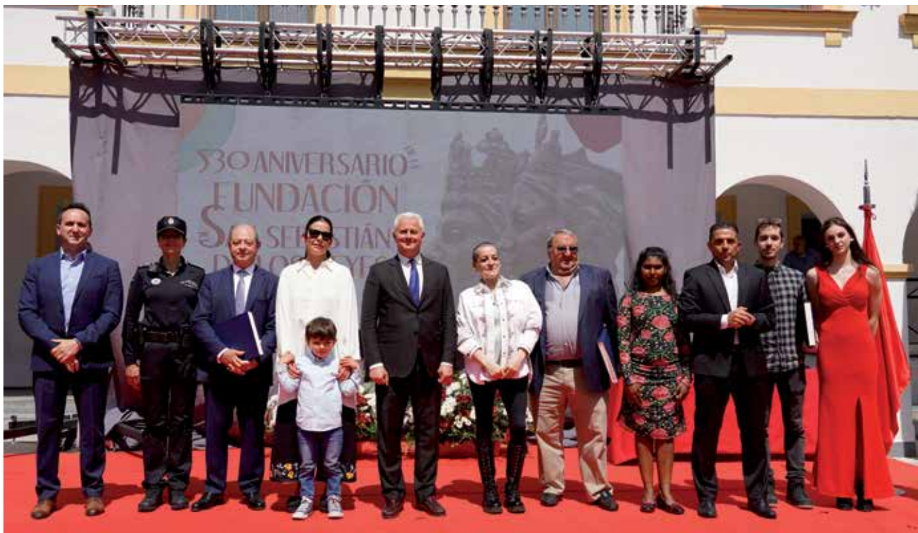
▲ Foto de familia con los homenajeados y los responsables municipales frente a la fachada del Ayuntamiento.

El Ayuntamiento rindió homenaje el pasado 1 de mayo, en el marco de las celebraciones correspondientes a la fundación de Sanse, hace ya 530 años, a varias personalidades ilustres y organismos en reconocimiento a su labor profesional y su pertenencia o vinculación con la ciudad. A este acto, acudieron representantes de la corporación municipal, del tejido asociativo, instituciones y vecinos de la localidad.