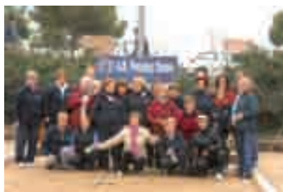
El Día 7, las mujeres de la Asociación Recreativa de Petanca jugaron una partida donde hicieron gala de habilidad y buen humor.

A las 10 de la mañana arrancó el campeonato de petanca, con el día muy nublado y mucho frío, pero parece que las jugadoras allí presentes tenían una estufa al lado. Es de admirar estas mujeres mayores, que conservan la fuerza y entusiasmo para dar a las bolas de la petanca. Lo bien que lo hacen y la alegría que transmiten a los demás bien merece el comentarlo.