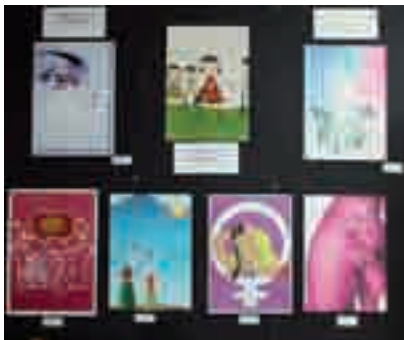
Exposición de los carteles presentados para el concurso del Día Internacional de la Mujer. Arriba, el primer, segundo y tercer premio.

La cena fue extraordinaria y cuando terminó hubo cuentacuentos y un tiempo de baile, todo muy bien organizado.