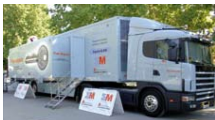
Este camión es el punto de información para el Plan Alquiler de la CAM.

Un punto de información del Plan Alquiler de la Comunidad de Madrid fue instalado en el Recinto Ferial, junto a la caseta de Consumo, para informar y asesorar a los vecinos. El Plan Alquiler es un servicio de gestión profesionalizada del alquiler para la intermediación entre propietarios e inquilinos. El contrato de alquiler se gestiona desde su firma hasta su resolución; se media en conflictos entre las partes y se contrata un seguro que cubre impagos y desperfectos en las viviendas alquiladas.