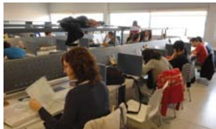
El Aula Joven amplía el horario de apertura de su Aula de Estudio de cara a los exámenes de junio.

E ste periodo especial comprende desde el lunes día 17 de mayo hasta el domingo día 20 de junio, y el horario es el siguiente: de lunes a viernes de 8:00 a 1:30 h; los sábados de 9:00 a 1:30 h; y los domingos y festivos de 9:00 a 21:00 h.