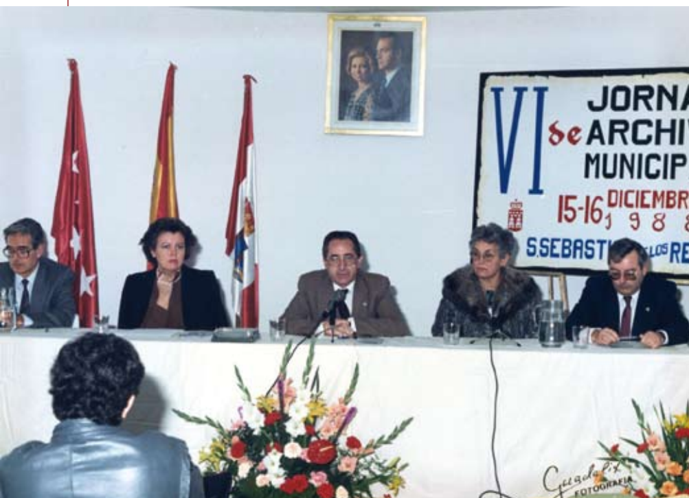
Esta fotografía nos recuerda el anterior encuentro de archiveros celebrado en San Sebastián de los Reyes en 1988.

Archiveros de toda España, incluso asistentes de otros países europeos, se reúnen el 27 y 28 de mayo en nuestra ciudad para debatir los retos que supone la llegada de la administración electrónica y la radical transformación que significa en su labor de clasificación y recuperación de los documentos. Este encuentro profesional está organizado por el Ayuntamiento y tendrá lugar en las instalaciones del Teatro Auditorio Adolfo Marsillach.