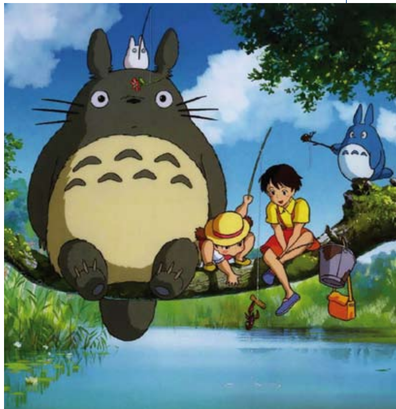
Cine infantil con 'Mi vecino Totoro', el 15 de mayo a las 17.00 h. en el Centro Joven.

Selección de libros infantiles y juveniles de los países nórdicos. Sala infantil-juvenil de las tres bibliotecas.