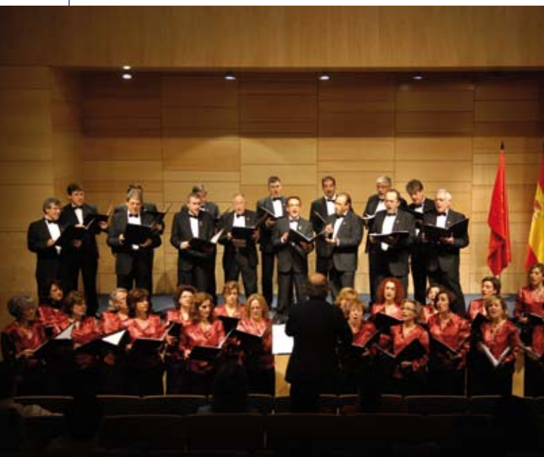
La Coral de San Sebastián de los Reyes y la de Aranda del Duero se unen en el IX Encuentro Coral de Primavera. Sábado 8 de mayo a las 20.00 h. en el TAM.