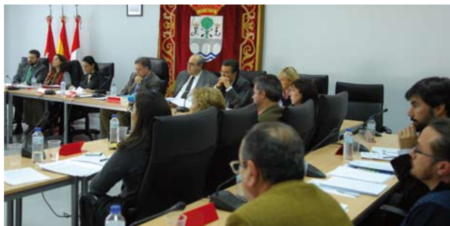
Momento del Pleno municipal en el que se aprobó un documento, con la total unanimidad de los grupos políticos de San Sebastián de los Reyes, para mejorar la salud de la ciudadanía.