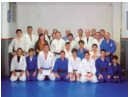
El gimnasio al completo, con el profesorado, los alumnos y los responsables del Centro.

E l JUDO es un Arte Marcial completo. Su antecesor, el antiguo ju jitsu se estudiaba como método de autodefensa. El JUDO nace como una escuela más de Ju Jitsu, pero ya desde sus comienzos en 1882 utiliza las técnicas más efectivas de cada escuela y abandona aquellas que son peligrosas por su falta de control sobre el adversario. Esto hace de JUDO desde el principio un completo ARTE DE LA AUTODEFENSA. Gracias a esta eficacia en el dominio del adversario y a un reglamento deportivo que evita cualquier lesión, el JUDO es el primer Arte Marcial que se convierte en un Deporte Olímpico. Actualmente cuenta con varios cientos de miles de practicantes en España nuestro Equipos Nacionales tanto femeninos como masculinos están en el medallero mundial.