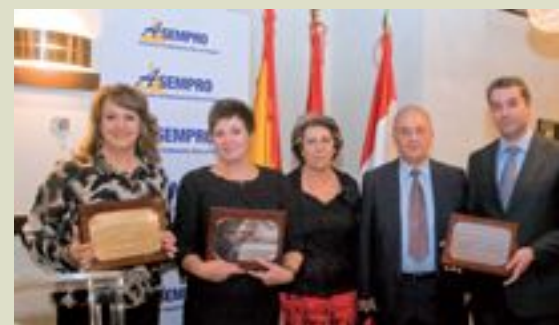
Los premiados por la Asociación empresarial Asempro posan con sus respectivas placas honoríficas.