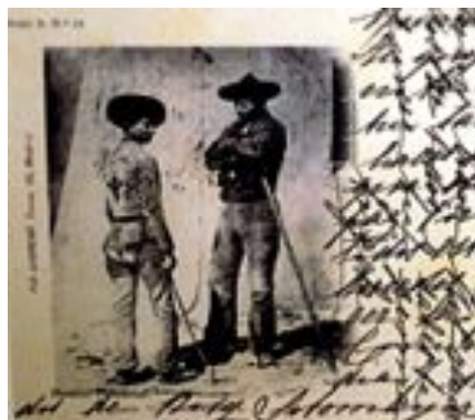
Las primeras portales nacieron en Austria en 1869 y llegaron a España cuatro años más tarde. Las empezó a editar la casa Hauser y Menet. Hay una interesante muestra de estas antiguas postales en la planta baja del Museo Etnográfico.

Al poco tiempo, en esta modalidad del correo, se fue imponiendo la ilustración del anverso debido, sobre todo, a la celebración de Exposiciones Internacionales que se desarrollaron en la década de los ochenta del siglo XIX, especialmente la Exposición Universal de París de 1889, cuyas imágenes fueron reproducidas en la tarjeta postal.