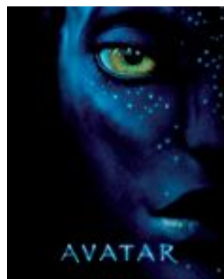
"Avatar" ha amrcado un hito en el cine en 3D. 10 de diciembre a las 19 h.

INFANCIA Y JUVENTUD CINE INFANTIL CINE JUVENIL "Tiana y el sapo" 4 de diciembre, a las 17.30 h. Para todos los públicos