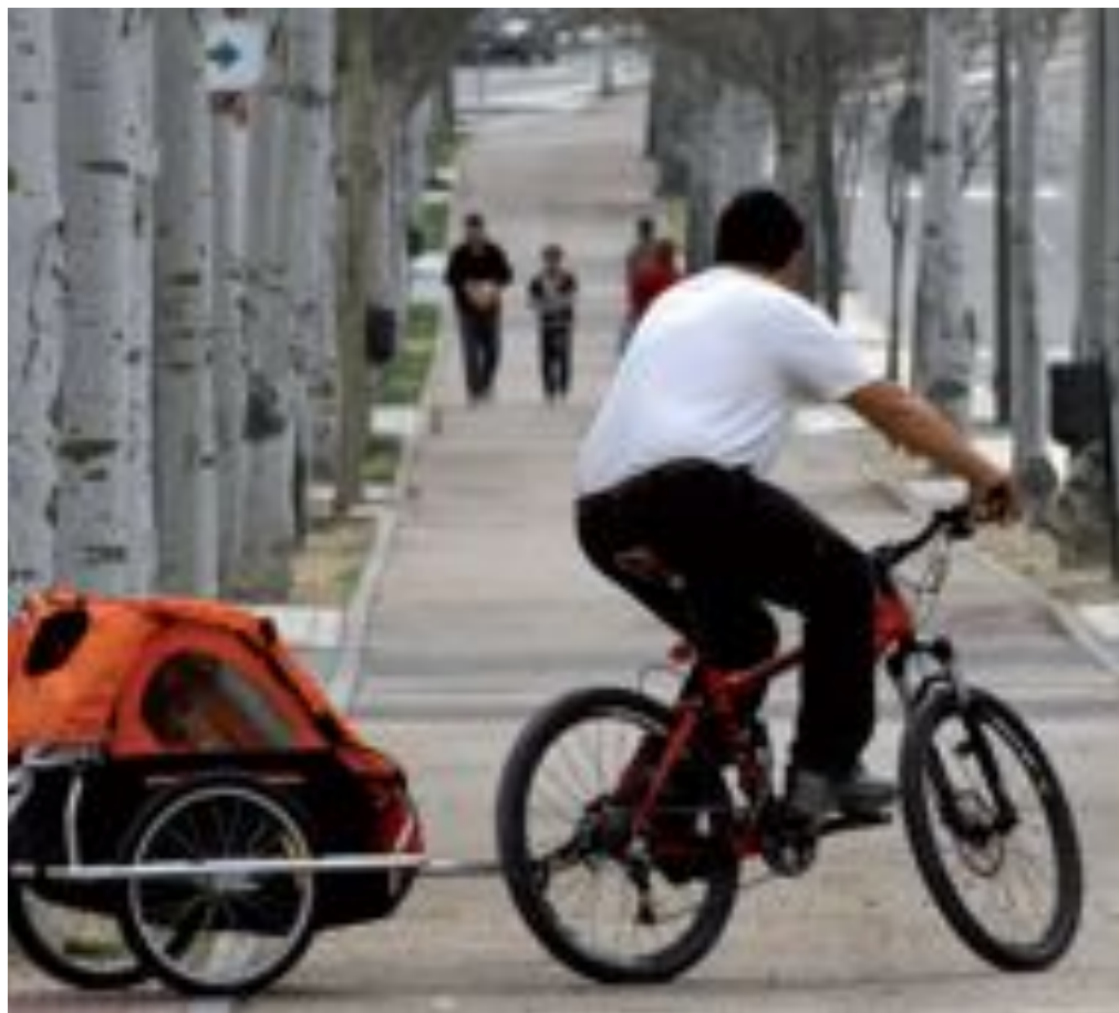
Montar en bici por la ciudad se está convirtiendo en una afición que cuenta cada día con más seguidores para la cual no hay ningún obstáculo si se tienen ganas.