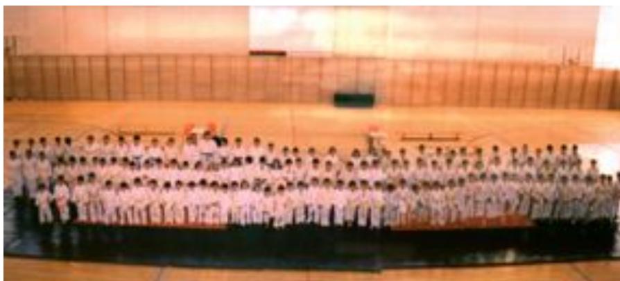
La cantera del judo demuestra el buen estado de un deporte que promueve valores positivos para la vida.