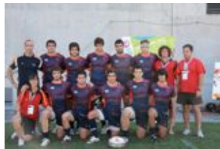
Selección Española de Rugby 7, a la que el jugador de Sanse ha sido convocado en varias ocasiones.

Tiene un futuro muy esperanzador, ya que los inicios siempre son duros, y ellos han logrado muchos éxitos en su corta vida. Espero que sigan por ese camino de la victoria y en un futuro nos encontremos en algún campo.