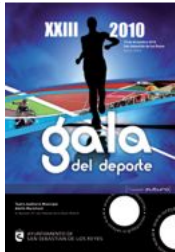
Cartel de la Gala de este año.

E l Teatro Municipal Adolfo Marsillach, servirá como escenario, como ya es tradición, para celebrar la Gala del Deporte, a la que todos estáis invitados el día 15