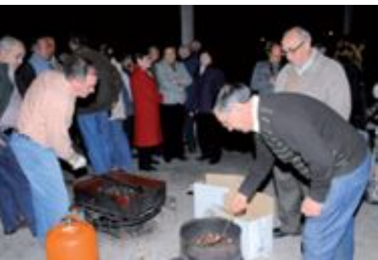
En la tradicional fiesta del Magosto las castañas son las grandes protagonistas.

L a asociación Lembranzas ha celebrado el tradicional Magosto en San Sebastián de los Reyes, concretamente en el colegio Buero Vallejo. El Magosto es una fiesta con gran raigambre en el noroeste de la península que se celebra durante el mes de noviembre y relaciona las castañas con el fuego. Los magostos están vinculados al día de difuntos, porque existe la creencia de que por cada castaña comida se libera un alma del purgatorio.