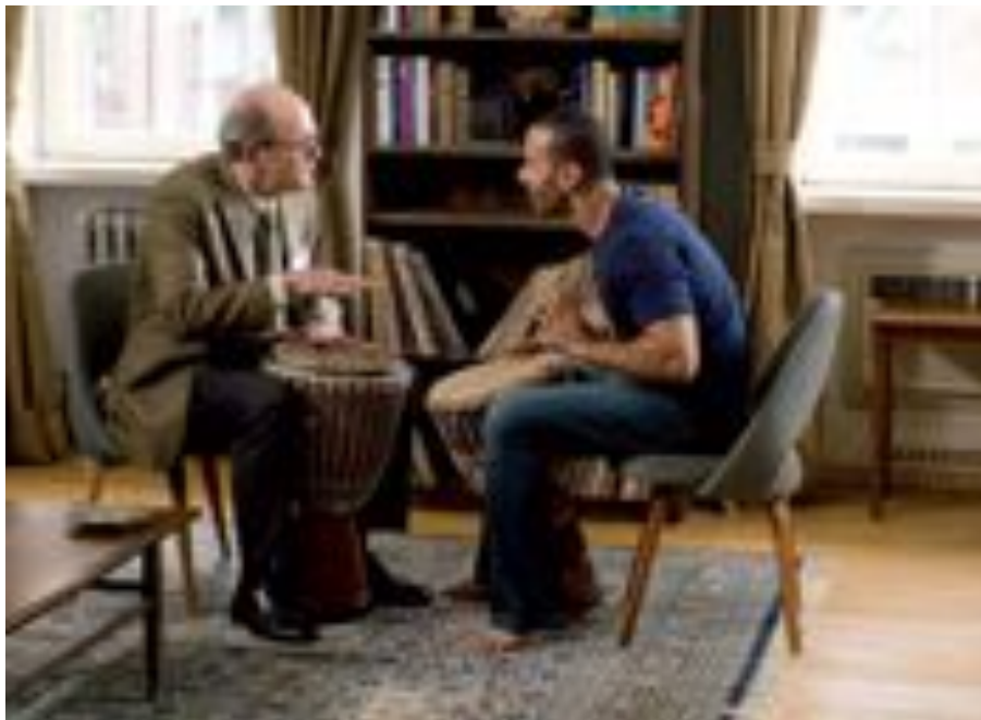
Escena de "The visitor", una de las películas programadas en la Muestra de Cine.

- Sábado 11: "De dioses y de hombres", (preestreno) de Xavier Beauvois Idioma original: Francés Duración: 120 minutos País : Francia Año: 2010