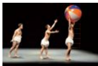
100% Tricycle, el día 18 a las 20.00 h. en el TAM. Entrada, 15 euros.

XXIII MUESTRA DE CANTOS TRADICIONALES DE NAVIDAD Día 17, a las 20,00 Precio Único: 3 euros Sesión numerada