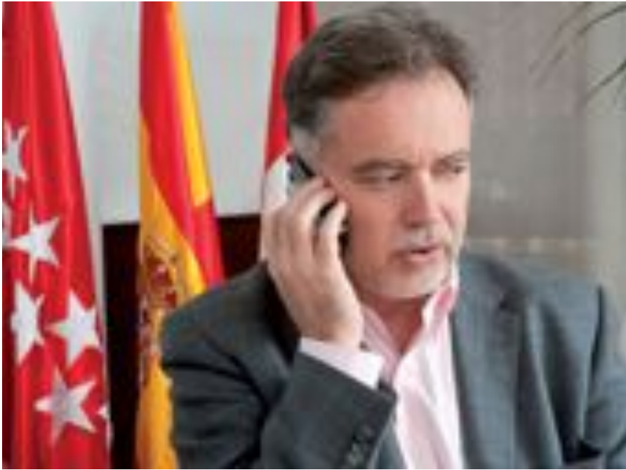
El alcalde atiende a los vecinos de forma directa a través de la línea telefónica, prestando atención a los problemas e inquietudes de los ciudadanos de San Sebastián de los Reyes.

El pasado mes de noviembre se cumplió un año de la puesta en marcha de la Línea Directa con el alcalde, mediante la cual los vecinos tienen la posibilidad de hablar personalmente por teléfono con el regidor los primeros jueves de cada mes y expresarle sus opiniones, quejas y sugerencias.