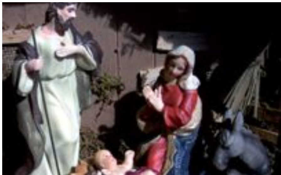
Las Bibliotecas Municipales han organizado un taller para crear belenes con diferentes técnicas. Los centros públicos aportan el material y la inscripción es gratuita.

Para grandes y pequeños en las Bibliotecas Central y Claudio Rodríguez. Intercambio gratuito de libros y revistas usados. Del 13 de diciembre al 10 de enero. ●●●