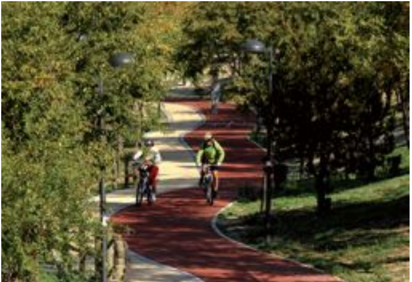
El carril bici es uno de los objetivos medioambientales recogidos en la Agenda 21 Local. A día de hoy, ya están disponibles más de 12 km.