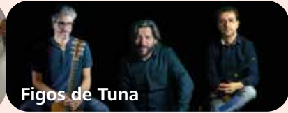
Figos de Tuna