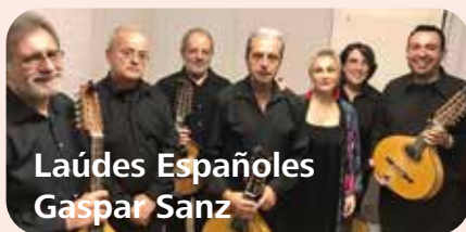
Laúdes Españoles Gaspar Sanz