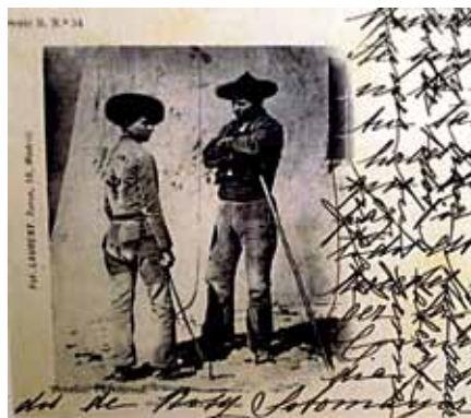
Las primeras portales nacieron en Austria en 1869 y llegaron a España cuatro años más tarde. Las empezó a editar la casa Hauser y Menet. Hay una interesante muestra de estas antiguas postales en la planta baja del Museo Etnográfico.

Al poco tiempo, en esta modalidad del correo, se fue imponiendo la ilustración del anverso debido, sobre todo, a la celebración de Exposiciones Internacionales que se desarrollaron en la década de los ochenta del siglo XIX, especialmente la Exposición Universal de París de 1889, cuyas imágenes fueron reproducidas en la tarjeta postal.