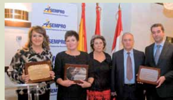
Los premiados por la Asociación empresarial Asempro posan con sus respectivas placas honoríficas.