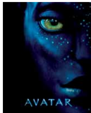
"Avatar" ha marcado un hito en el cine en 3D. 10 de diciembre a las 19 h.

INFANCIA Y JUVENTUD CINE INFANTIL CINE JUVENIL "Tiana y el sapo" 4 de diciembre, a las 17.30 h. Para todos los públicos