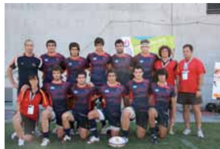
Selección Española de Rugby 7, a la que el jugador de Sanse ha sido convocado en varias ocasiones.

Tiene un futuro muy esperanzador, ya que los inicios siempre son duros, y ellos han logrado muchos éxitos en su corta vida. Espero que sigan por ese camino de la victoria y en un futuro nos encontremos en algún campo.