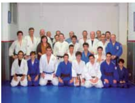
El gimnasio al completo, con el profesorado, los alumnos y los responsables del Centro.

E l JUDO es un Arte Marcial completo. Su antecesor, el antiguo ju jitsu se estudiaba como método de autodefensa. El JUDO nace como una escuela más de Ju Jitsu, pero ya desde sus comienzos en 1882 utiliza las técnicas más efectivas de cada escuela y abandona aquellas que son peligrosas por su falta de control sobre el adversario. Esto hace de JUDO desde el principio un completo ARTE DE LA AUTODEFENSA. Gracias a esta eficacia en el dominio del adversario y a un reglamento deportivo que evita cualquier lesión, el JUDO es el primer Arte Marcial que se convierte en un Deporte Olímpico. Actualmente cuenta con varios cientos de miles de practicantes en España nuestro Equipos Nacionales tanto femeninos como masculinos están en el medallero mundial.