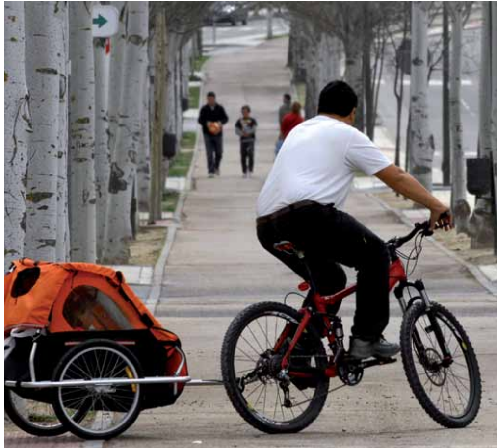
Montar en bici por la ciudad se está convirtiendo en una afición que cuenta cada día con más seguidores para la cual no hay ningún obstáculo si se tienen ganas.