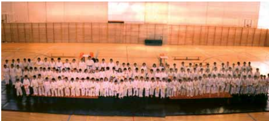
La cantera del judo demuestra el buen estado de un deporte que promueve valores positivos para la vida.