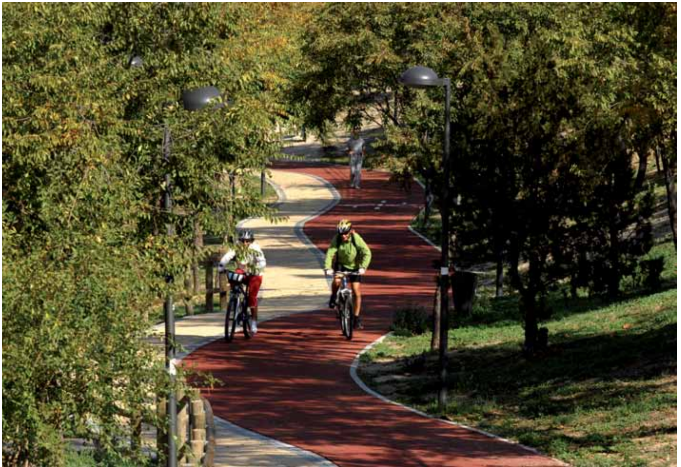
El carril bici es uno de los objetivos medioambientales recogidos en la Agenda 21 Local. A día de hoy, ya están disponibles más de 12 km.

“Sanse, mejor con bici” no es sólo un eslogan, sino que resume la filosofía de una manera de ver y relacionarse con la ciudad, con San Sebastián de los Reyes. “Ahora ha llegado el momento, porque así lo exigen los ciudadanos”, explica el alcalde, Manuel Ángel Fernández, “de apostar decididamente por la sostenibilidad y la calidad de vida, y el carril bici es una infraestructura que define nuestra forma de entender y construir el futuro de nuestro pueblo”.