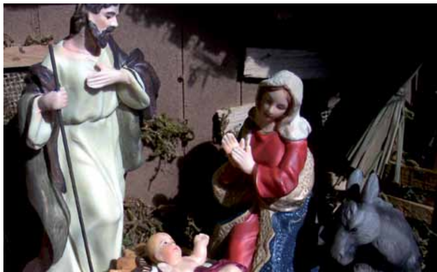
Las Bibliotecas Municipales han organizado un taller para crear belenes con diferentes técnicas. Los centros públicos aportan el material y la inscripción es gratuita.

Para grandes y pequeños en las Bibliotecas Central y Claudio Rodríguez. Intercambio gratuito de libros y revistas usados. Del 13 de diciembre al 10 de enero. ●●●