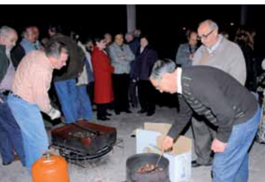
En la tradicional fiesta del Magosto las castañas son las grandes protagonistas.

L a asociación Lembranzas ha celebrado el tradicional Magosto en San Sebastián de los Reyes, concretamente en el colegio Buero Vallejo. El Magosto es una fiesta con gran raigambre en el noroeste de la península que se celebra durante el mes de noviembre y relaciona las castañas con el fuego. Los magostos están vinculados al día de difuntos, porque existe la creencia de que por cada castaña comida se libera un alma del purgatorio.