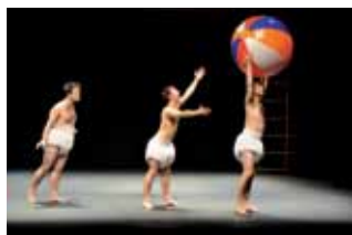
100% Tricycle, el día 18 a las 20.00 h. en el TAM. Entrada, 15 euros.

XXIII MUESTRA DE CANTOS TRADICIONALES DE NAVIDAD Día 17, a las 20,00 Precio Único: 3 euros Sesión numerada