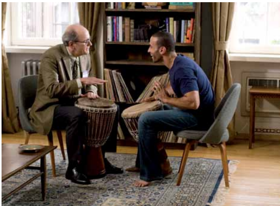
Escena de "The visitor", una de las películas programadas en la Muestra de Cine.

- Sábado 11: "De dioses y de hombres" , (preestreno) de Xavier Beauvois Idioma original: Francés Duración: 120 minutos País: Francia Año: 2010