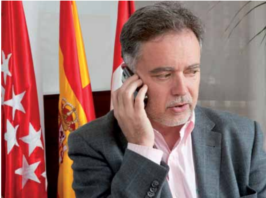
El alcalde atiende a los vecinos de forma directa a través de la línea telefónica, prestando atención a los problemas e inquietudes de los ciudadanos de San Sebastián de los Reyes.

El pasado mes de noviembre se cumplió un año de la puesta en marcha de la Línea Directa con el alcalde, mediante la cual los vecinos tienen la posibilidad de hablar personalmente por teléfono con el regidor los primeros jueves de cada mes y expresarle sus opiniones, quejas y sugerencias.