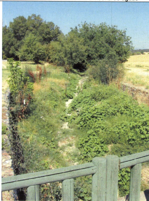
Cauce del arroyo de quiñones en el límite sureste del Sector