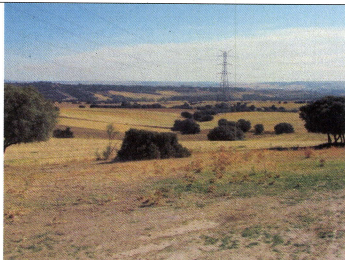
Vista hacia el NE desde la divisoria de aguas