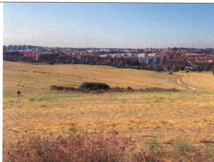
Vista hacia el S de la zona central del AR-2 desde la divisoria de aguas