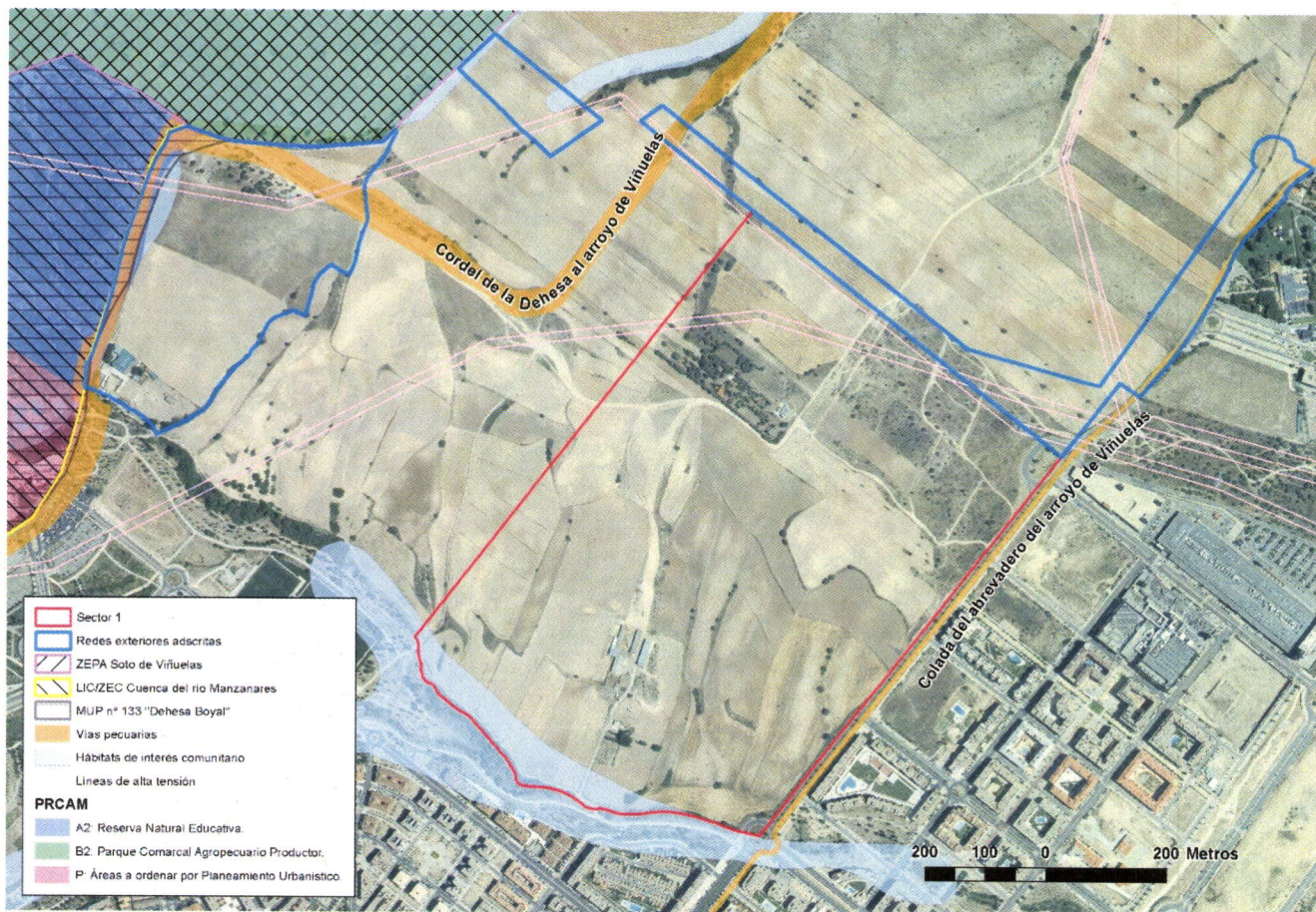
Delimitación aproximada del S2 del AR-2 sobre la ortoimagen de 2014

Al oeste del sector, lindando con las redes exteriores adscritas, se ubica el Parque Regional de la Cuenca Alta del Manzanares (PRCAM), concretamente en las zonas A2 "Reserva Natural Educativa" y B2 "Parque Comarcal Agropecuario Productor". El PRCAM en esta zona coincide con el LIC/ZEC "Cuenca del río Manzanares" (ES3110004). La zona del PRCAM y del LIC del municipio de Madrid está además dentro de la ZEPA "Soto de Viñuelas" (ES0000012). La zona del PRCAM y del LIC dentro de San Sebastián de los Reyes es el Monte de Utilidad Pública nº 133 "Dehesa Boyal" del Catálogo de los de Madrid.