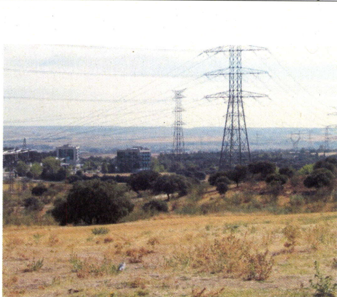
Zona de encinar-retamar al N del AR-2