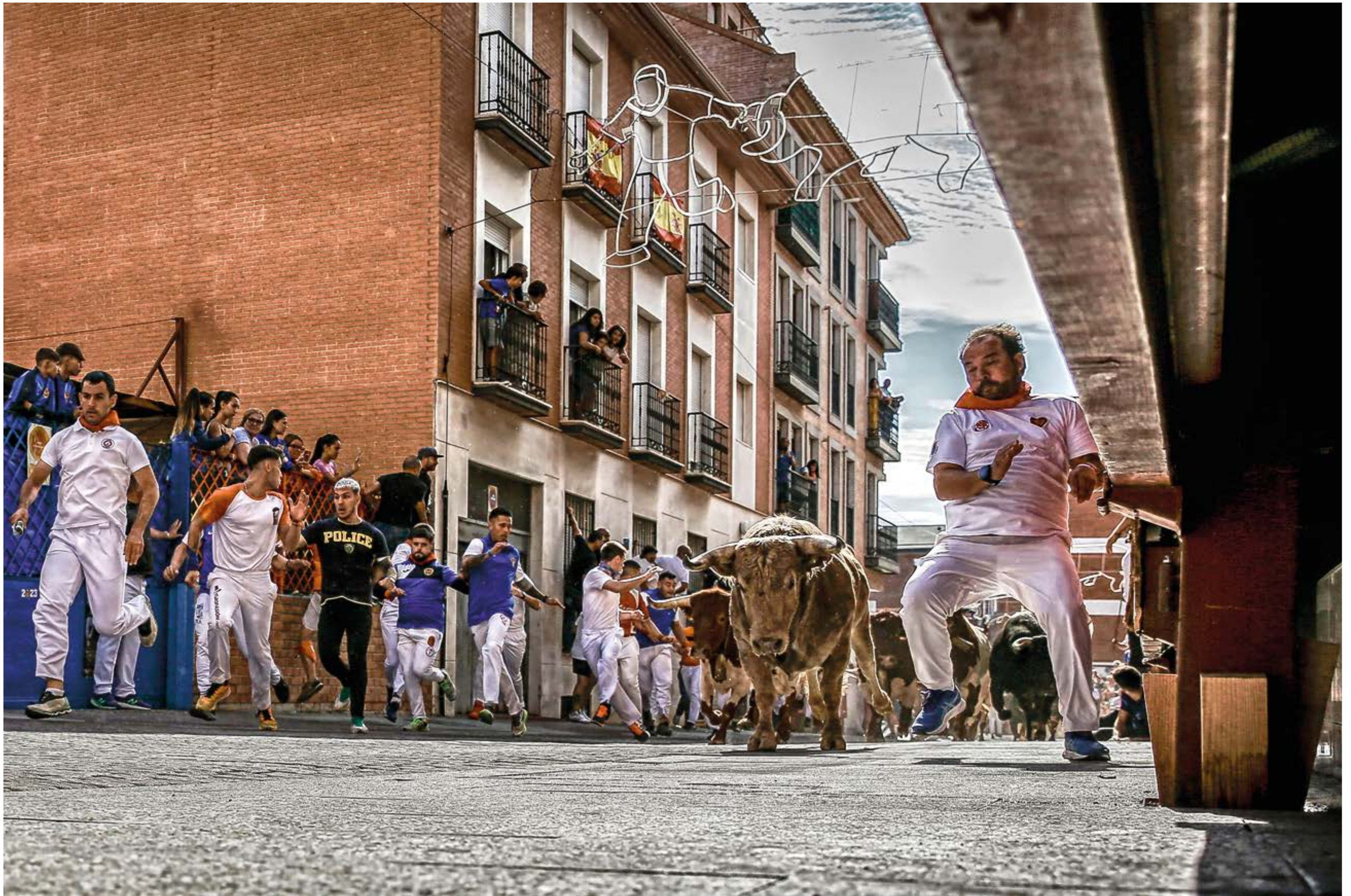
“Bailando con toros”, de Ángel Pérez (Medina del Campo)