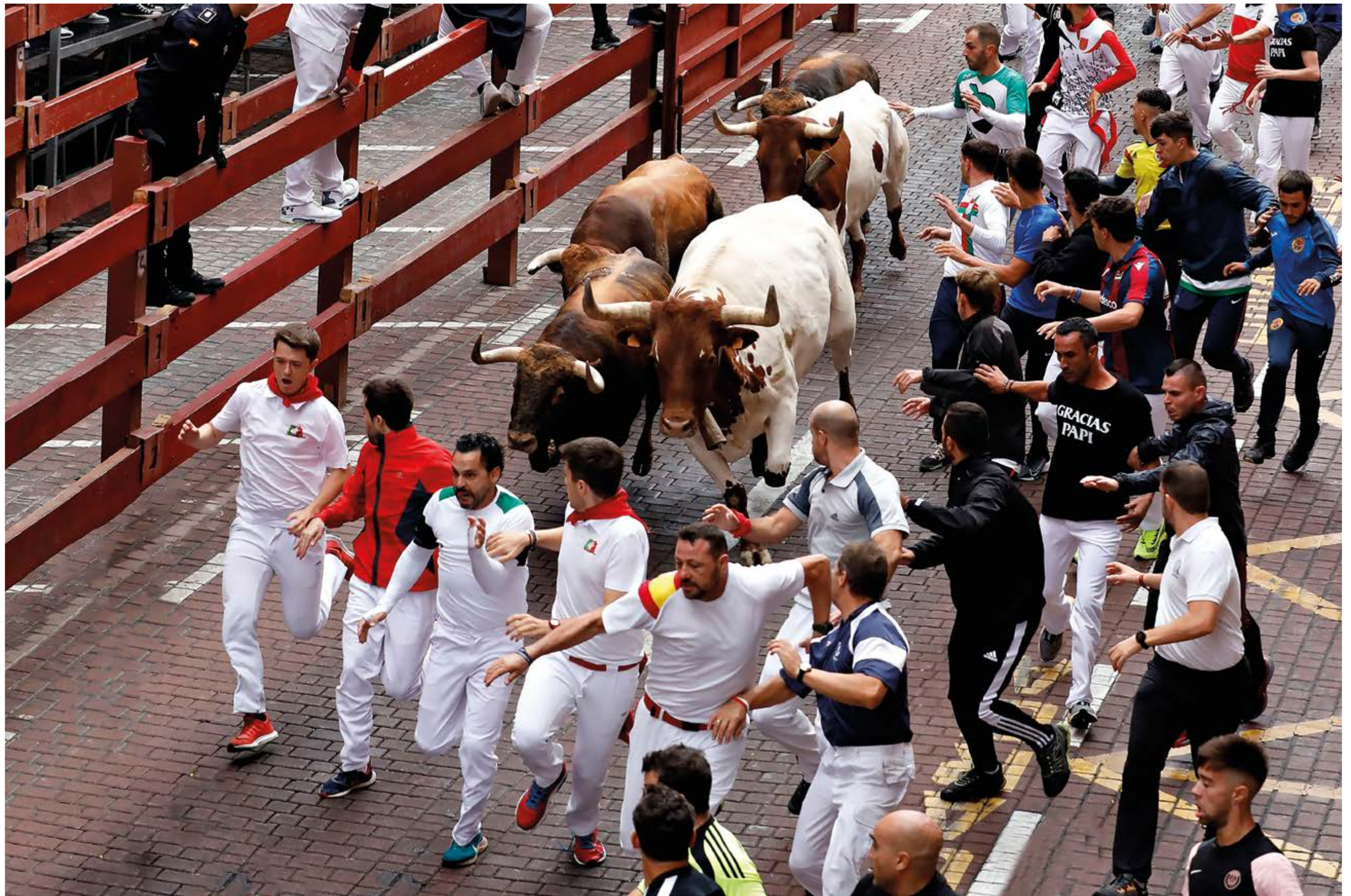
“En la disputa”, de José Luis Cano (Madrigal A. Torres). Mención Especial 2023