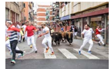
“Abriendo paso a la manada”, de Alfonso Moreno (Sanse)

El mayoral conocía esa expresión y detuvo el golpe, sabía que viene del miedo, pero de ese miedo que empuja, que mantiene alerta todos los músculos del cuerpo y que transmite valor. Era la expresión del temple. Se miraron unos segundos y no hizo falta decir más. El mayoral giró su caballo para volver a ponerse en cabeza. – Vamos a Sanse, mañana los encerramos allí–. Juan asintió, ambos sabían que volverían a verse.