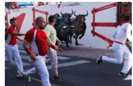
"Contraste", de Antonio Cabrera (Sanse)

Era agosto, el sol calentaba con ganas. Las gentes se afanaban en las últimas tareas del verano. En las eras, niños y grandes, hombres y mujeres movían los haces, las parvas y los sacos de grano. Los carros iban y venían con los frutos de la cosecha.