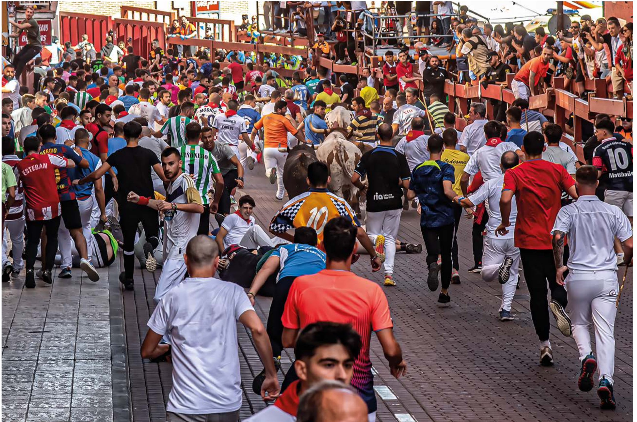
“Arrasando”, de Ciriaco López (Sanse)