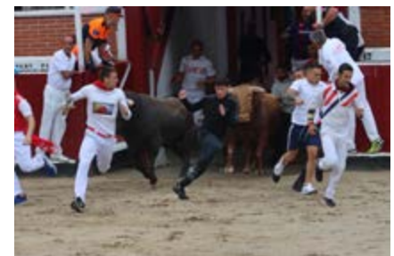
“Entrando en La Tercera”, de Vanessa Gor (Sanse)

La manada ya estaba entrando en el pueblo. Juan estaba en las tapias del huerto, pero sabía que ese no era su sitio, este año no. El mayoral que venía en cabeza lo vio, casi