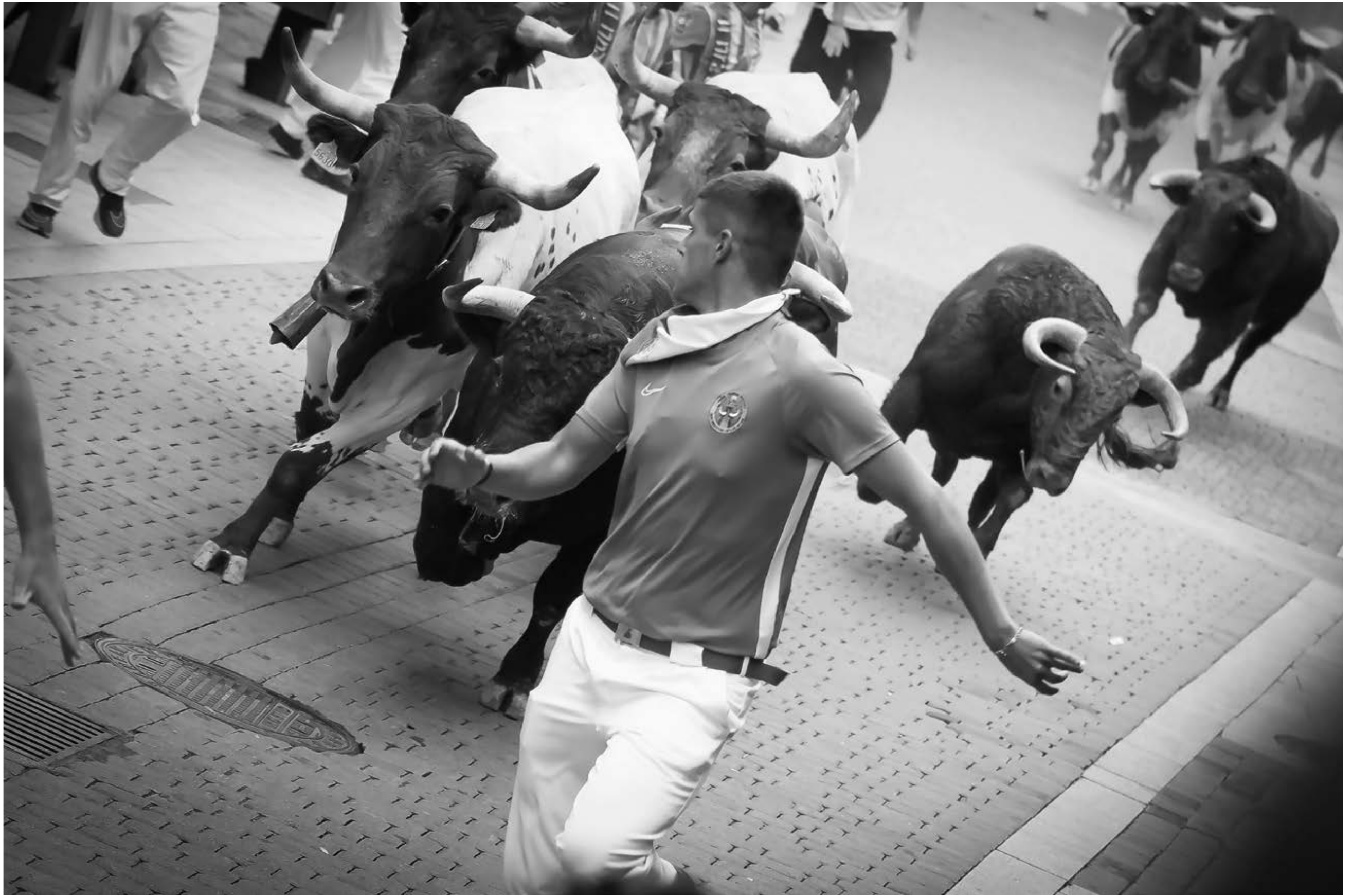
"Postas", de David González del Campo (Sanse). Primer Premio 2023