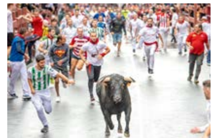
“Solitario”, de José Manuel Melero (Sanse)

Ojalá tengas razón... musitó, sosteniendo una