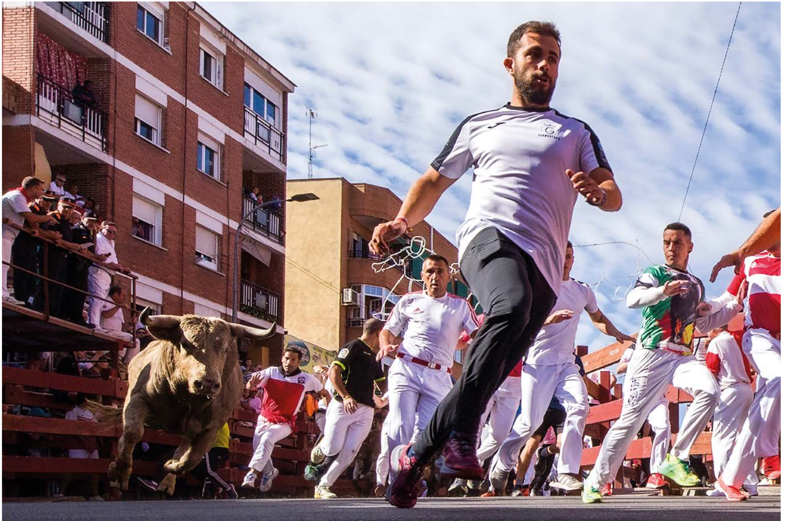
"Tomando la curva", de Raúl Barbero (Madrid). Segundo Premio 2023