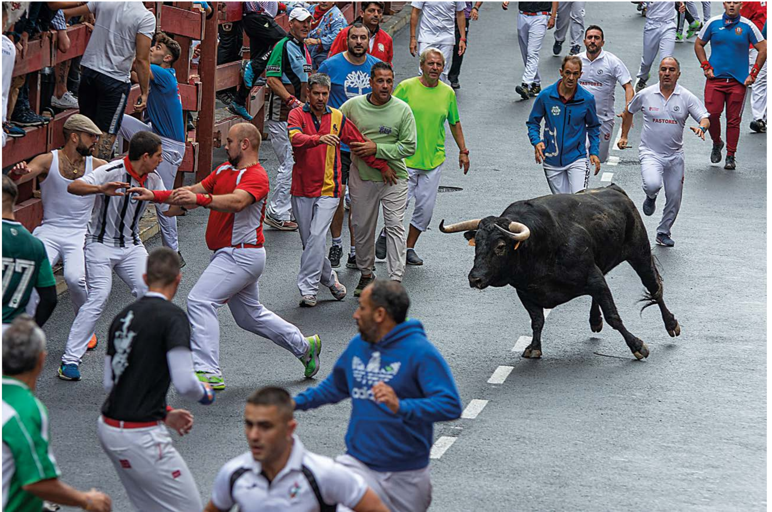
"Solitario", de Paco Hernández (Sanse)