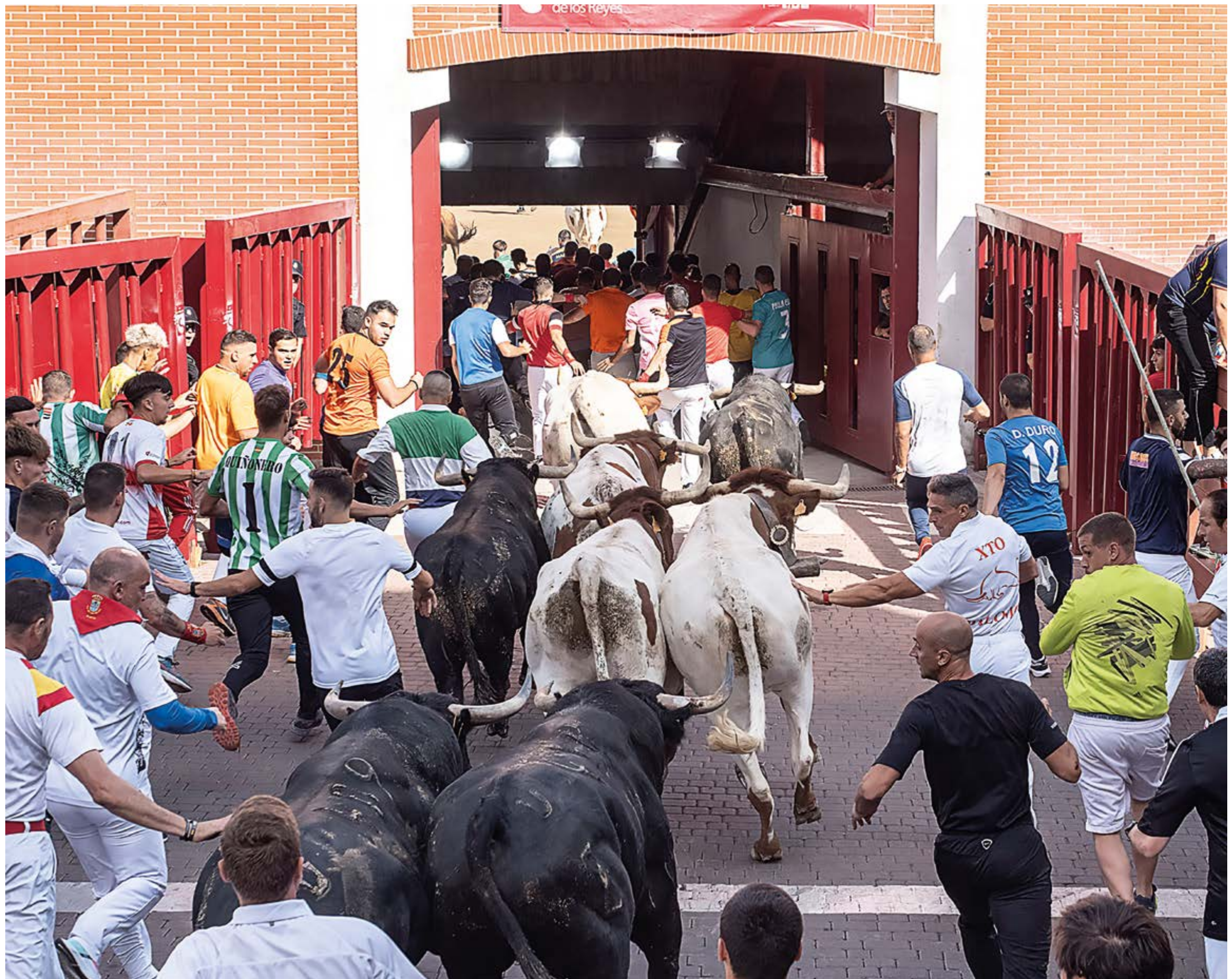
“Entrando en La Tercera”, de Alfredo González (El Molar)