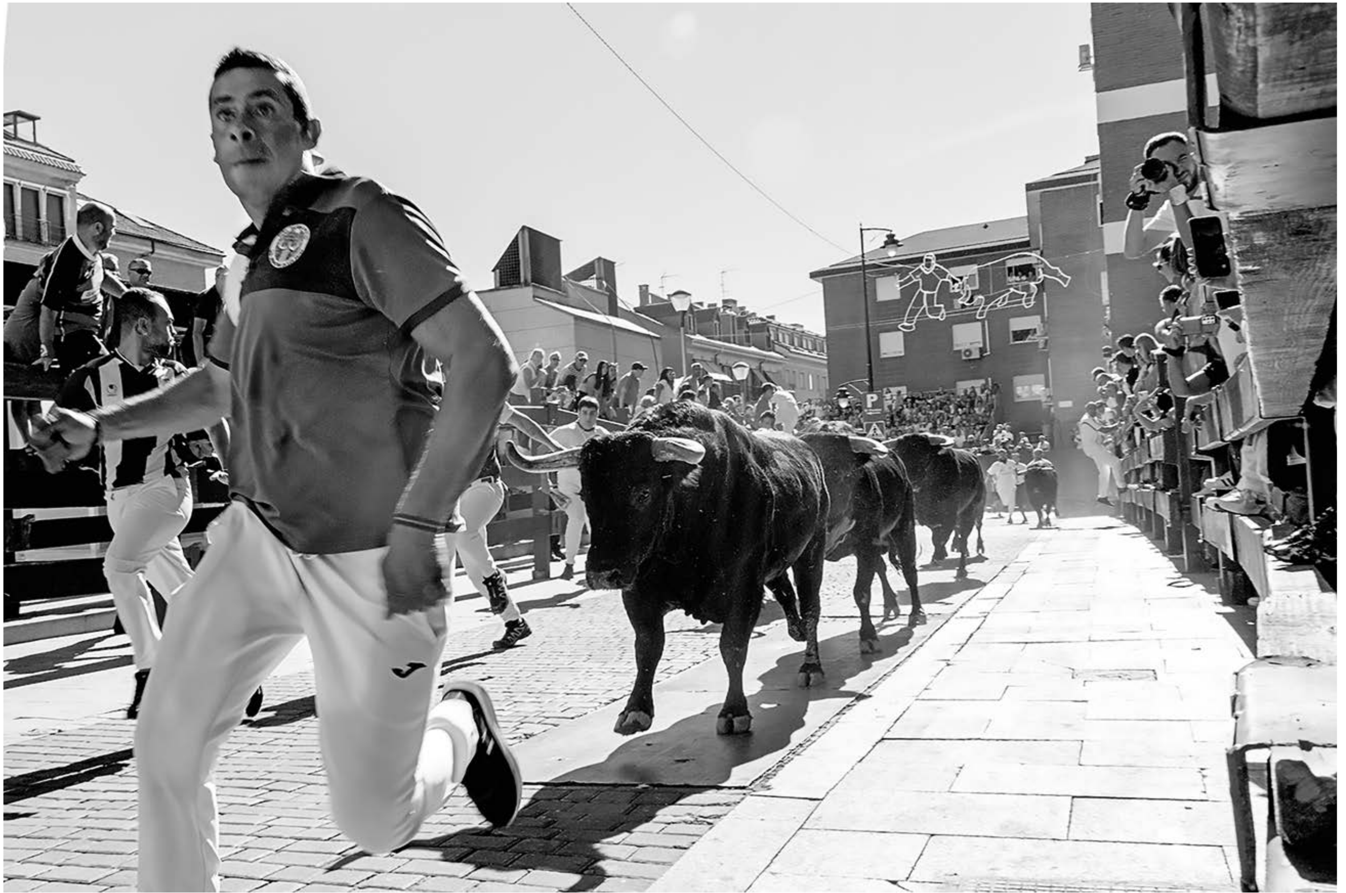
"Por la línea", de Miguel Requejo (Sanse)