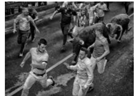
“Carrera a la gloria”, de Javier Muñoz (Sanse)

- Aparta chico, estos son bravos -. El mayoral alzó la pica para darle un varazo, pero Juan se había quedado parado, con los pies firmes, mirándole de frente, con los astados a pocos metros. El gesto no