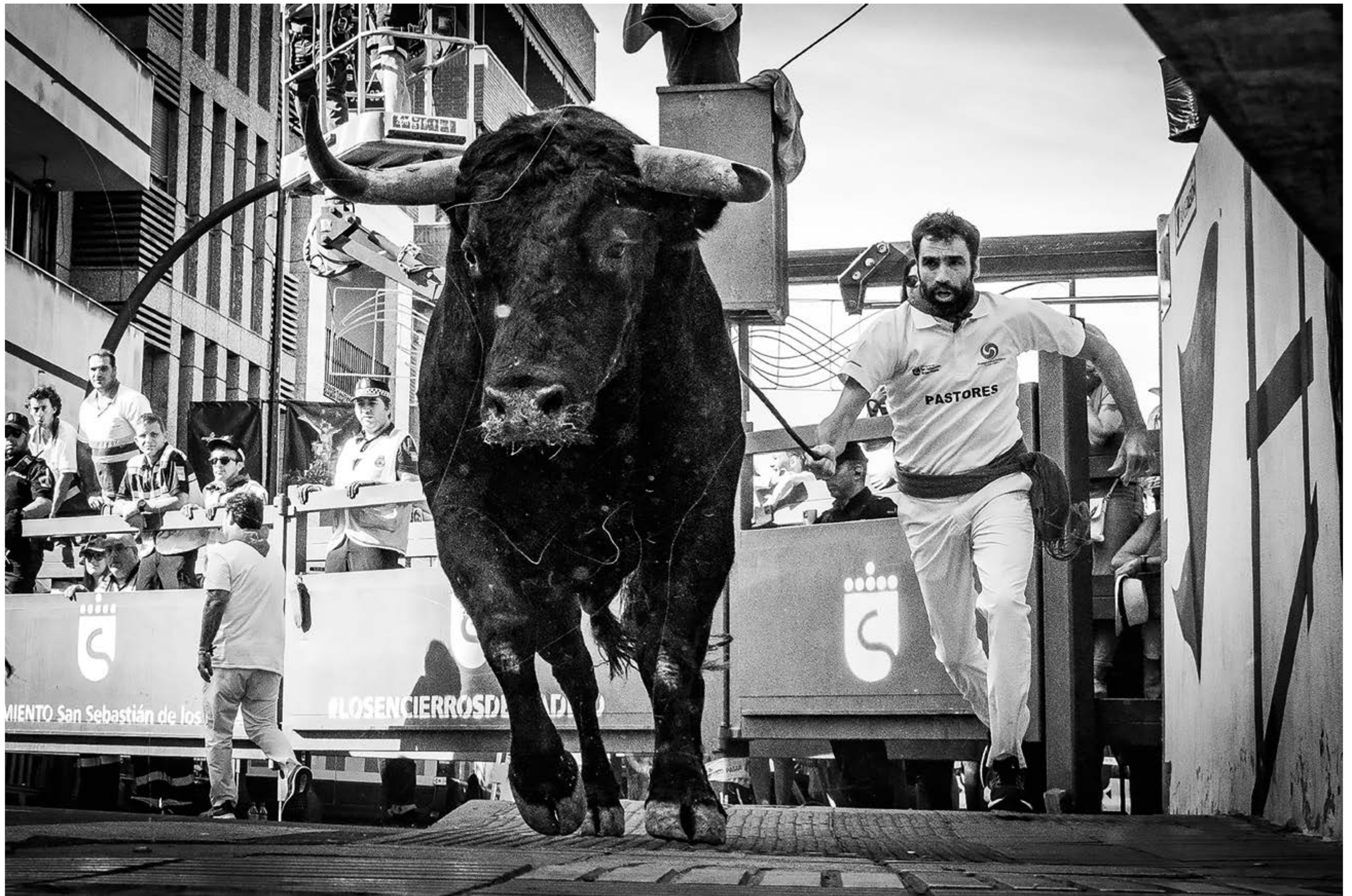
"Pastores", de Óscar Manuel Sánchez (Puebla de Sanabria). Tercer Premio 2023