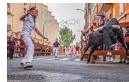
“Toro guapo, pastor bravo”, de Cristina del Amo (Sanse)

ha ido bien-. Hoy su mujer, su madre, sus hermanos descansan, Juan llega a casa a comer con la satisfacción de haber disfrutado delante de la cara del toro, pero... ¿y mañana? Mañana más, se despide de sus compañeros en este pueblo de Madrid. Es lo que tiene estas fechas, hay que aprovechar que todos los días hay toros, sonríe. Al día siguiente nuevas embestidas por desentrañar y nuevos caminos por descubrir, porque en el toro, a pesar de volver a los mismos lugares, cada día es una experiencia completamente nueva.