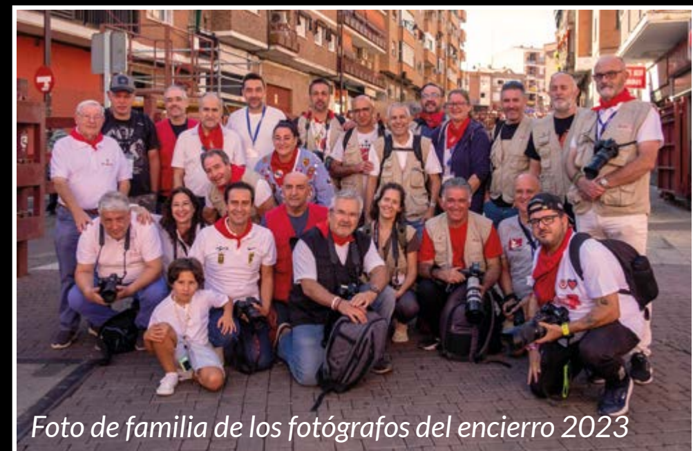
Foto de familia de los fotógrafos del encierro 2023