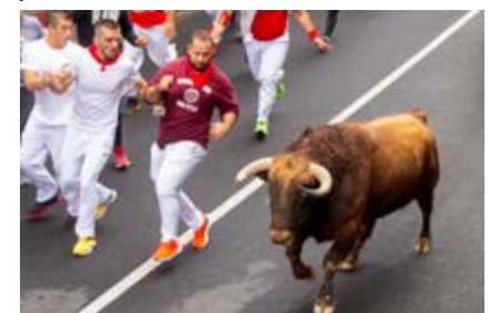
"A tu lado, corredor", de Raquel Polo (Sanse)

Envuelta en la polvareda del camino, la figura del viejo mayoral desapareció rumbo al pueblo, sin sospechar que el eco de su advertencia se transmitiría como una generosa herencia, guardiana de la tradición que a causa de los nuevos tiempos había temido perder: el encierro.