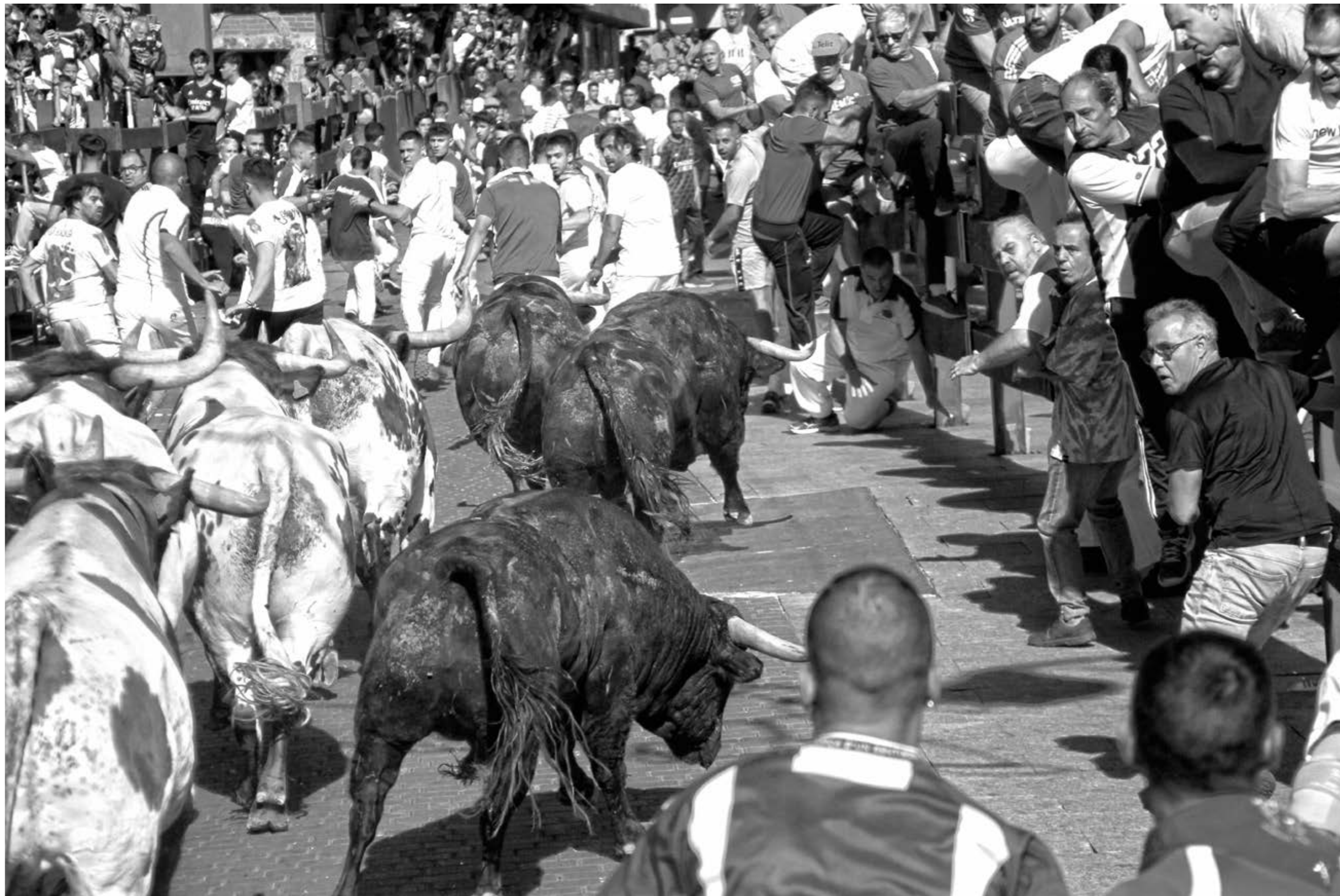
"Postas y acción", de Roberto Ferrero (Sanse)