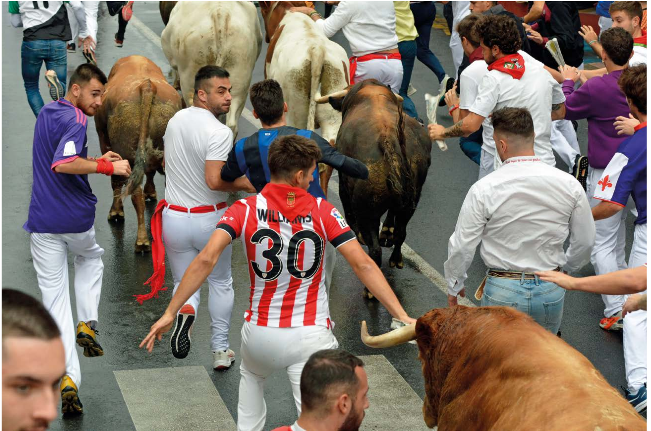
"Máxima tensión", de Pedro Mancebo (Sanse)