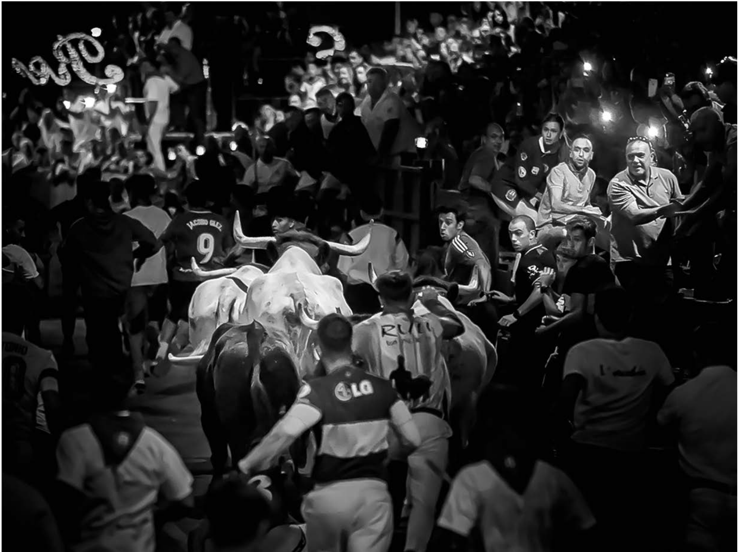
“Diversión nocturna”, de Antonio Alelú (Colmenar Viejo). Mención Especial 2023