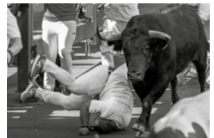
“Revolcón”, de Carmen Galán (Sanse)

Tras él, la manada de toros y mansos, desdibujada bajo la neblina del último amanecer de agosto, pacía tranquilamente en el último descansadero de la sierra, camino de San Sebastián de los Reyes. El rictus del hombre, curtido en la dureza del campo, reflejaba con exactitud los pensamientos que parecía rumiar con mayor intranquilidad que la que mostraban los astados.