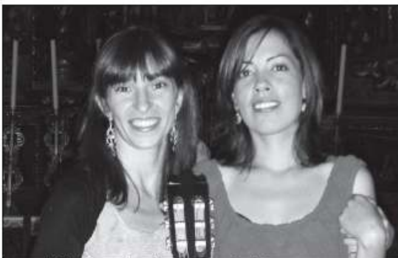
Integrantes de Spatium Sonorum, quienes ofrecerán su concierto el día 16 de agosto. N.A.