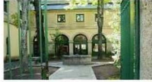
La Casa de Cultura acoge el sábado un concierto para guitarra y voz