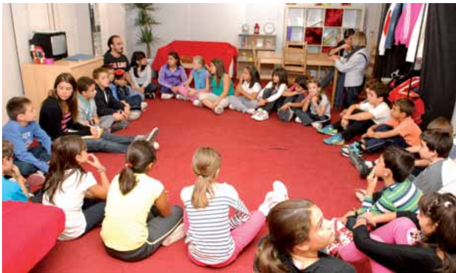
Los alumnos, dirigidos por dos monitores, hombre y mujer, aprenden a compartir las tareas domésticas en condiciones de igualdad a través del juego.

Ningún sitio mejor para enseñar la responsabilidad compartida que en la Casa de la Igualdad, una iniciativa municipal que ha instalado un auténtico hogar, con todos los complementos y dependencias domésticas que puedan imaginarse, en su sede de la calle Recreo. Su fin es empezar a distribuir los trabajos y las funciones domésticas sin intervención de criterios de género y afrontarlos desde la igualdad de valores y la conciliación.