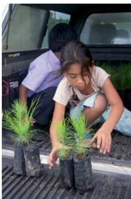
Todas las iniciativas de la asociación persiguen la autosuficiencia alimentaria de estos pueblos.

Un proyecto de cooperación internacional de la Asociación para el Desarrollo de la Mancomunidad Huista (ADSOSMHU) de Guatemala, financiado por el Ayuntamiento, ha recibido el Premio Nacional "Protectores de la Tierra" del gobierno de este país centroamericano con el que distingue a las entidades sociales comprometidas con la conservación del entorno natural y la promoción de la población rural