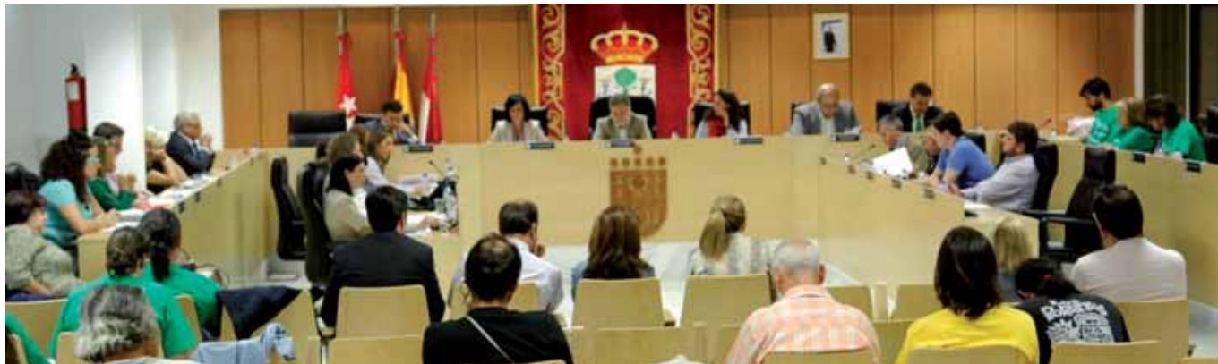
Vista panorámica del Salón de Plenos donde se aprobaron las significativas declaraciones.

El último Pleno Ordinario, celebrado el pasado 20 de octubre, aprobó tres declaraciones institucionales por unanimidad de todos los grupos políticos: 'Contra el ruido de las aeronaves que parten del aeropuerto de Barajas', 'Manifestando la disconformidad del Ayuntamiento por la apertura de IKEA todos los domingos y festivos' y, por último, una tercera que persigue 'Llegar a acuerdos con Alcobendas para prestar servicios comunes y ahorrar así recursos públicos'. También se aprobó una moción, con alguna modificación introducida durante el debate del Pleno, cuyo fin es 'potenciar la Responsabilidad Social Corporativa del Ayuntamiento'.