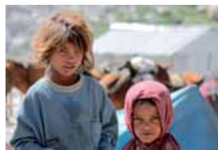
La exposición 'Historias a través del agua' usa el denominador común del agua y la infancia.

Actividades creativas, culturales,... para jóvenes de 14 a 30 años. De lunes a viernes de 18.00 a 21.30 horas (consultar programa).