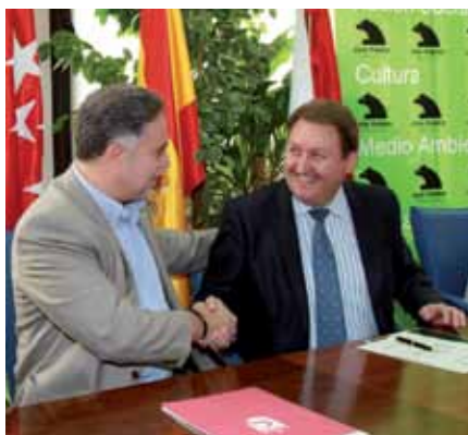
El alcalde escenifica el acuerdo con el responsable de la Obra Social de Caja Madrid

"Saber envejecer" se desarrollará a lo largo de 20 semanas en las mañanas de los jueves en 30 horas lectivas con el envejecimiento saludable y activo como denominador común. Cuidado de la salud, mantenimiento físico, ejercicio regular de todas las facultades, relaciones personales, afectivas o sexuales, son los contenidos de las sesiones de este nuevo curso municipal para personas mayores. Una inves-