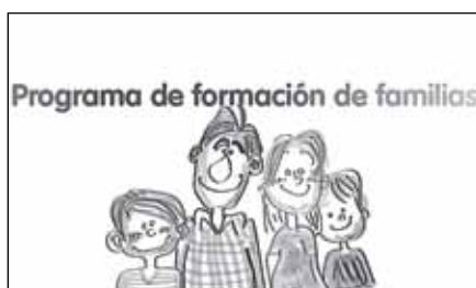
Programa de formación de familias

La Concejalía de Educación, pone en marcha un espacio de encuentro, aprendizaje y reflexión colectiva donde se intercambian experiencias relacionadas con la educación de los niños y se facilita a las familias herramientas y estrategias para ayudarles en esa labor, tanto en el ámbito familiar, como en el escolar y el social.