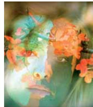
'De Assam a Cachemira', exposición de fotografía de Ana Arribas, hasta el 10 de noviembre.