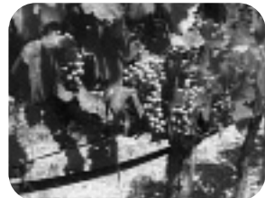
LA MANDUCA. Fin de semana, 17.20 h.