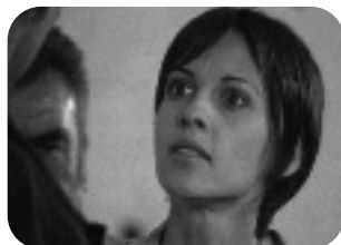
EL ALMA HERIDA Lunes a viernes, 14.15 h.