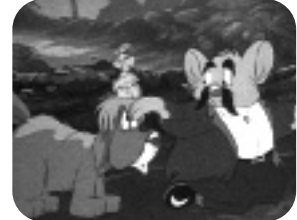
LAPITCH, EL PEQUEÑO ZAPATERO. Fin de semana, 16.00