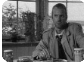
NOMBRE EN CLAVE KYRILL Miércoles, 23.25 h.