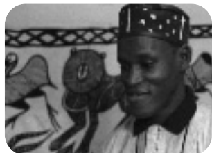
EMIGRANTES EN TIERRA DE EMIGRANTES. Lunes, 22.15 h.