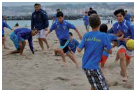
Un total de 91 chicos y chicas del club han participado en esta actividad.

Por cuarto año consecutivo los chicos y chicas de las categorías benjamín, alevín e infantil del Juventud Sanse realizaron un viaje de convivencia en las fechas previas