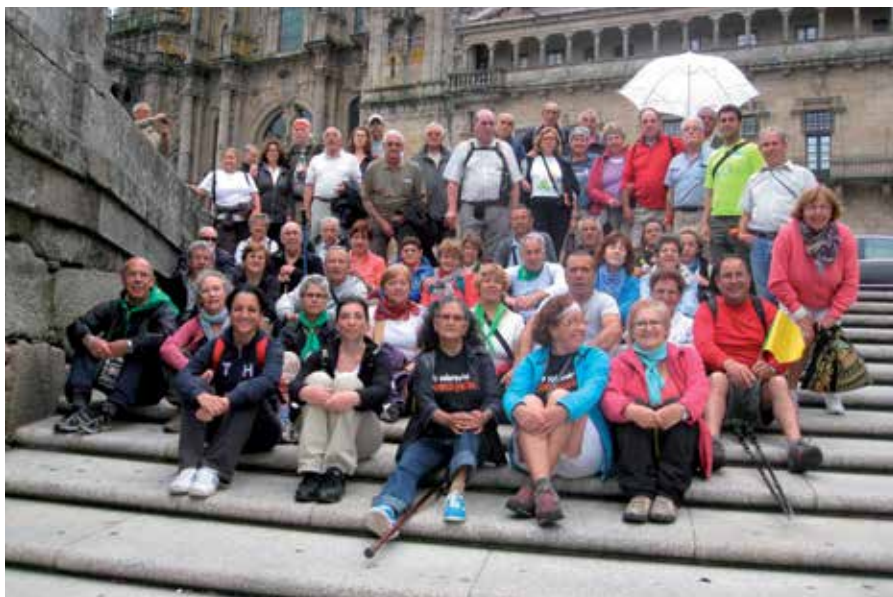
Esta peregrinación ofrece 50 plazas y recorrerá una media de 20 km. diarios durante seis días.

Incluye autocar ida y vuelta desde el Centro Municipal de Personas Mayores, así como acompañamiento en todas las rutas diarias y visitas culturales de tarde; alojamiento en habitación doble en hotel de tres estrellas o similar durante siete noches; pensión completa todos los días; almuerzo en ruta el día 18 de junio; seguro de viaje; actividades culturales, deportivas y de animación por las tardes; y el personal técnico necesario durante la actividad.