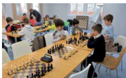
Niños de Sanse en el Club V Centenario.

Entre las mejoras realizadas cabe destacar la construcción de dos almacenes para distintos usos; aseos, adaptados para personas