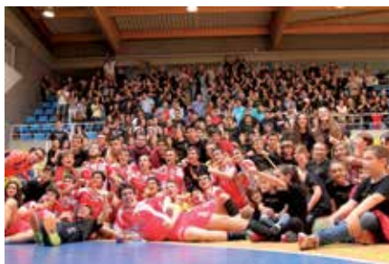
Los componentes del equipo y detrás una afición que apoyó de principio a fin.

La victoria del viernes frente a Alcobendas junto con la derrota de Corazonistas frente a BM Carabanchel hacía que el primer objetivo estuviese conseguido, clasificarse para el intersectar nacional que se disputará del 1 al 3 de mayo en sede todavía por determinar. El segundo objetivo era ser campeones de Madrid y por ello se iba a luchar el domingo 28. Quedaba el partido contra BM Carabanchel que iba