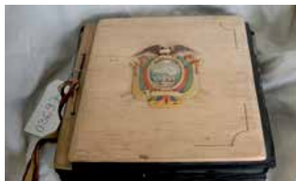
Este voluminoso álbum exquisitamente trabajado difunde la historia y la belleza de Ecuador.

Así comienza la dedicatoria de un voluminoso álbum exquisitamente trabajado (nunca mejor dicho) que fue confeccionado por las alumnas de quinto año del curso lectivo 1957-1958 del Colegio Nacional de señori-