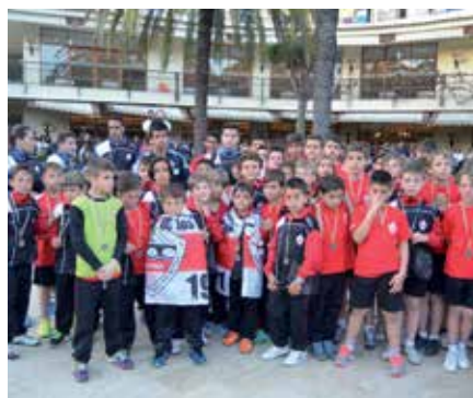
La cantera del Sanse disfrutó de la convivencia y demostró su espíritu competitivo.

Puntual a las 10:00 de la mañana partían los dos autocares con la expedición de la U.D. Sanse, rumbo a Villarreal donde disputaron durante los días 3, 4 y 5 de abril una nueva edición de la Villarreal Yellow Cup, uno de los prestigiosos torneos de Semana Santa del panorama futbolístico español. Cargados de ilusión partieron los canteranos y con muchas ganas de hacer un gran papel en este prestigioso torneo. Con la participación de dos equipos de categoría Benjamín, un equipo Alevín, un equipo Infantil y dos equipos Cadetes y entrenadores, haciendo un total de 101 personas que representaron a la U.D.