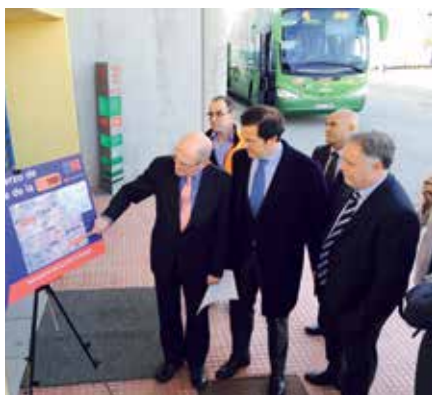
El alcalde con el consejero de Transportes y varios regidores de los municipios beneficiados.

Es esta misma zona se encuentran más de 20.000 empresas repartidas en 17 municipios