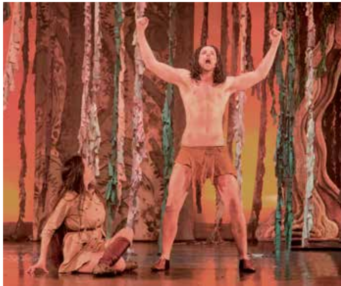
'Tarzán el musical', espectáculo para un público familiar el domingo 19 a las 18:00 h. en el TAM.