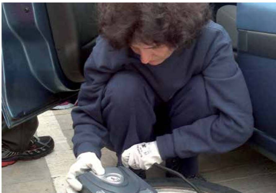
Este programa se ha desarrollado para superar los roles de género en relación a diferentes tareas.

3.- Seguridad del vehículo: activa y pasiva.