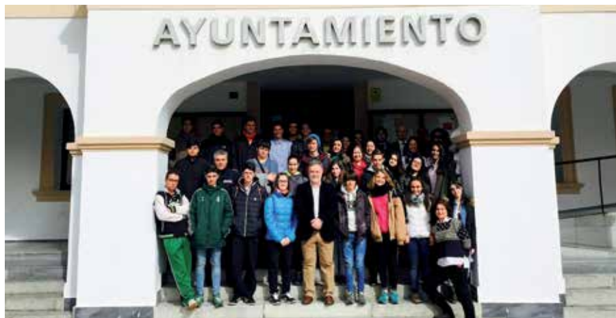
El alcalde junto a los 29 alumnos que recibió en la Casa Consistorial.