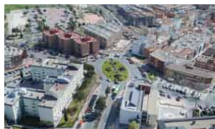
Nuestra ciudad ya ha hecho los deberes y no tiene que incrementar el IBI.

En San Sebastián de los Reyes no se incrementará el Impuesto de Bienes Inmuebles (IBI), tal y como establece el Real Decreto-Ley 20/2011, pues no es de aplicación el nuevo tipo de gravamen para aquellos municipios, como San Sebastián de los Reyes, cuya ponencia de valores haya sido aprobada entre los años 2005 y 2007.