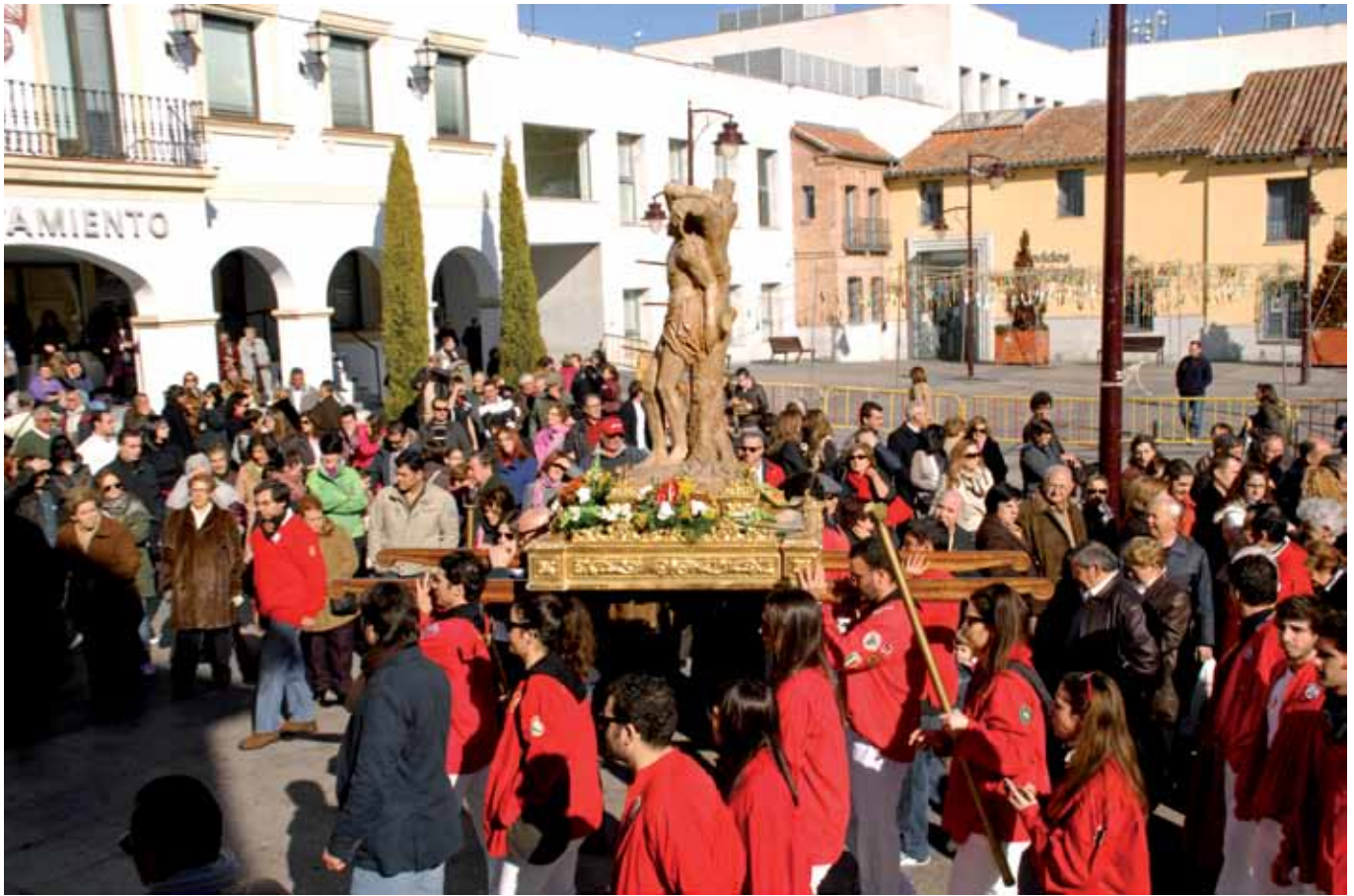
La procesión del Santo Patrón reunió a miles de vecinos que quisieron acompañar a la imagen en su recorrido por las principales calles del casco histórico.

No hubo excusa para no tomar parte en alguna de las actividades programadas durante los cinco días dedicados a la celebración del patrón de la ciudad: San Sebastián Mártir.