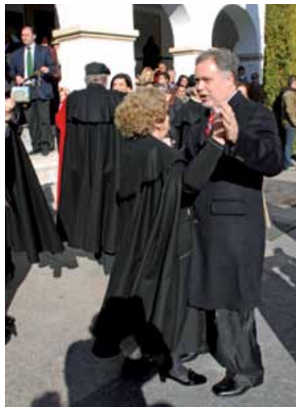
El alcalde no quiso perderse el tradicional baile en la Plaza de la Constitución y se marcó unos pasos junto a las demás parejas de vecinas y vecinos.

El día de San Sebastián, 20 de enero, como viene sucediendo ya durante los últimos años, la Banda Municipal realizó un pasacalles por el casco antiguo. A las 12 del mediodía se celebró la misa mayor, tras la cual la imagen del patrón