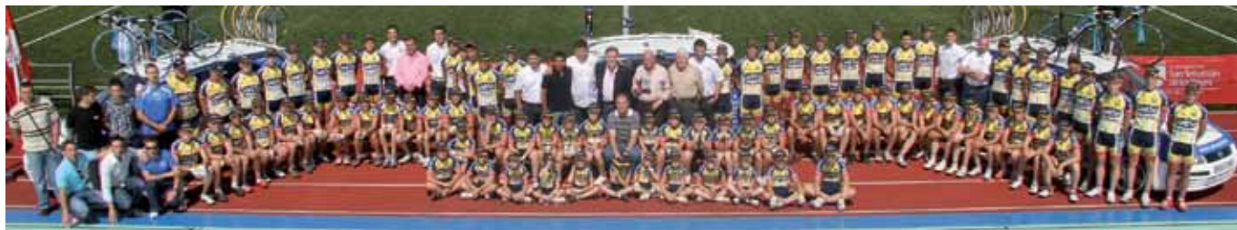
Todos los equipos de la Unión en la presentación de la actual temporada.

La Unión Ciclista comenzó su pretemporada de preparación a primeros de noviembre en todas sus categorías, especialmente de forma más intensa en cadetes y junior. Desde entonces y hasta primeros de marzo, los cadetes harán más de 1.600 km en bicicleta mientras que los junior harán unos 3.200 km. Ambas categorías comenzarán sus primeras competiciones en el mes de marzo y la escuela lo hará en el mes de mayo. En la categoría de Escuelas el seguimiento académico así como la disputa del calendario madrileño, serán el eje principal de la categoría, además de la participación de algún alumno en los Campeonatos de España Escolares. En la categoría de cadetes los objetivos pasan por la disputa de un ambicioso calendario de ruta y la participación en diferentes modalidades por todo el territorio nacional, a nivel de la Comunidad de Madrid,