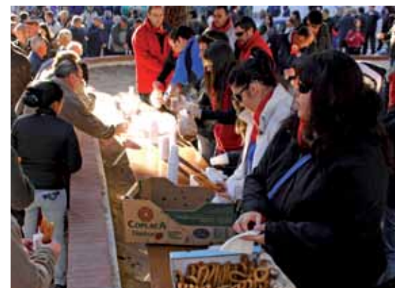
La Federación de Peñas ofreció una chocolatada con churros la mañana del sábado día 21.

fue en procesión por las principales calles del casco antiguo. Tras un concierto de la Banda en la plaza de la Constitución, tuvo lugar una masclatá en el mismo emplazamiento. Ya por la tarde, se entregaron los premios del Concurso de Belenes, organizado con la colaboración de la Asociación de Belenistas.