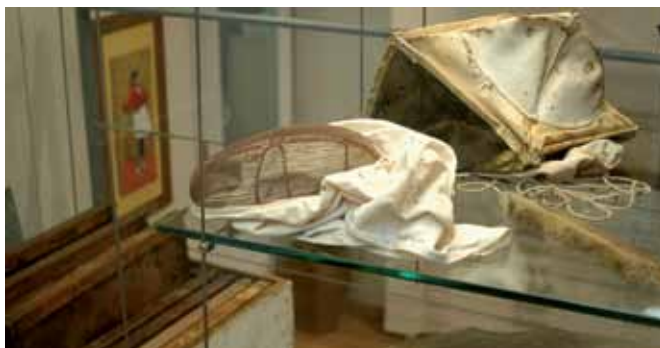
Vista de los utensilios que se usaban hasta hace bien poco en la apicultura.

En su afán por dar a conocer y traer a la memoria antiguas actividades y oficios ya extinguidos, o que ya no se desarrollan con los mismos métodos y técnicas de antaño, el Museo Etnográfico el Caserón propone una exposición dedicada a los colmeneros que ejercían y siguen ejerciendo la milenaria actividad artesanal de la apicultura. En una de las vitrinas de la primera