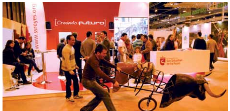
Las actividades relacionadas con los encierros han sido unas de las grandes protagonistas en el stand municipal, llamando la atención de los muchos visitantes que allí se congregaron.