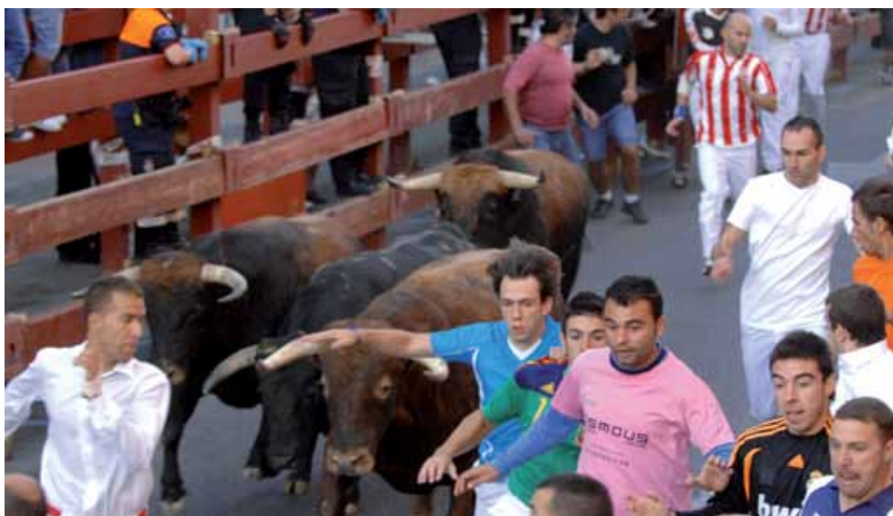
Los encierros son uno de los grandes valores añadidos de nuestra ciudad.

El Ayuntamiento ha aprobado la declaración de las fiestas de toros "Patrimonio Cultural Inmaterial", conforme a los términos recogidos en la Convención de la UNESCO de 2003 para la defensa de este tipo de Patrimonio. Se trata de