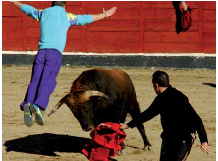
El sábado por la mañana se soltaron reses en plaza de toros La Tercera, y los mozos dieron un gran espectáculo con los recortes que ofrecieron al público.