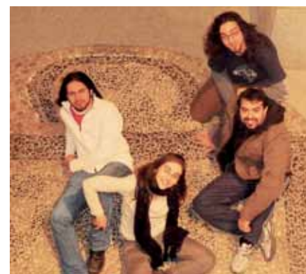
Ayalga es un grupo de folk local que nació en Sanse. Tocan el día 20.