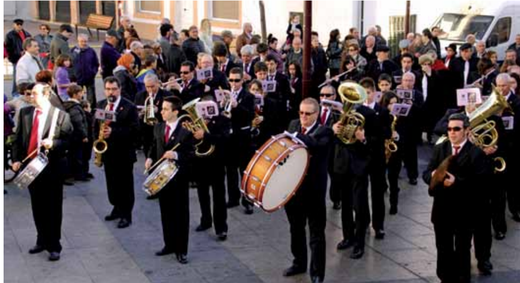
La Banda Municipal, como ya es tradición, hizo un pasacalles por el casco antiguo en la festividad de San Sebastián, además de cerrar los festejos con un magnífico concierto en el Teatro Adolfo Marsillach.