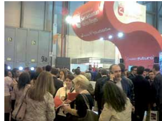
La visita a nuestro stand ha batido todos los récords de ediciones pasadas.

Por supuesto, también ha habido sitio para los encierros de la localidad, que tuvieron su momento el día inaugural, el 18 de enero por la tarde. Aficionados a las fiestas populares taurinas se dieron cita en los alrededores del stand de San Sebastián de los Reyes para disfrutar de las actividades programadas.