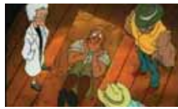
Historias insólitas Lunes a viernes, 20,35 h.

15,00 Noticias Norte 15,30 Cine: Amor sin fin 17,05 Deportes de aventura 17,25 Teknópolis 18,00 Dinosaurios 18,50 Carrera para salvar el planeta 20,00 Noticias Norte 21,25 Villarriba y Villabajo 22,15 Las aventuras de Pepe Carvalho 23,15 Zoombados 23,55 Policías en acción