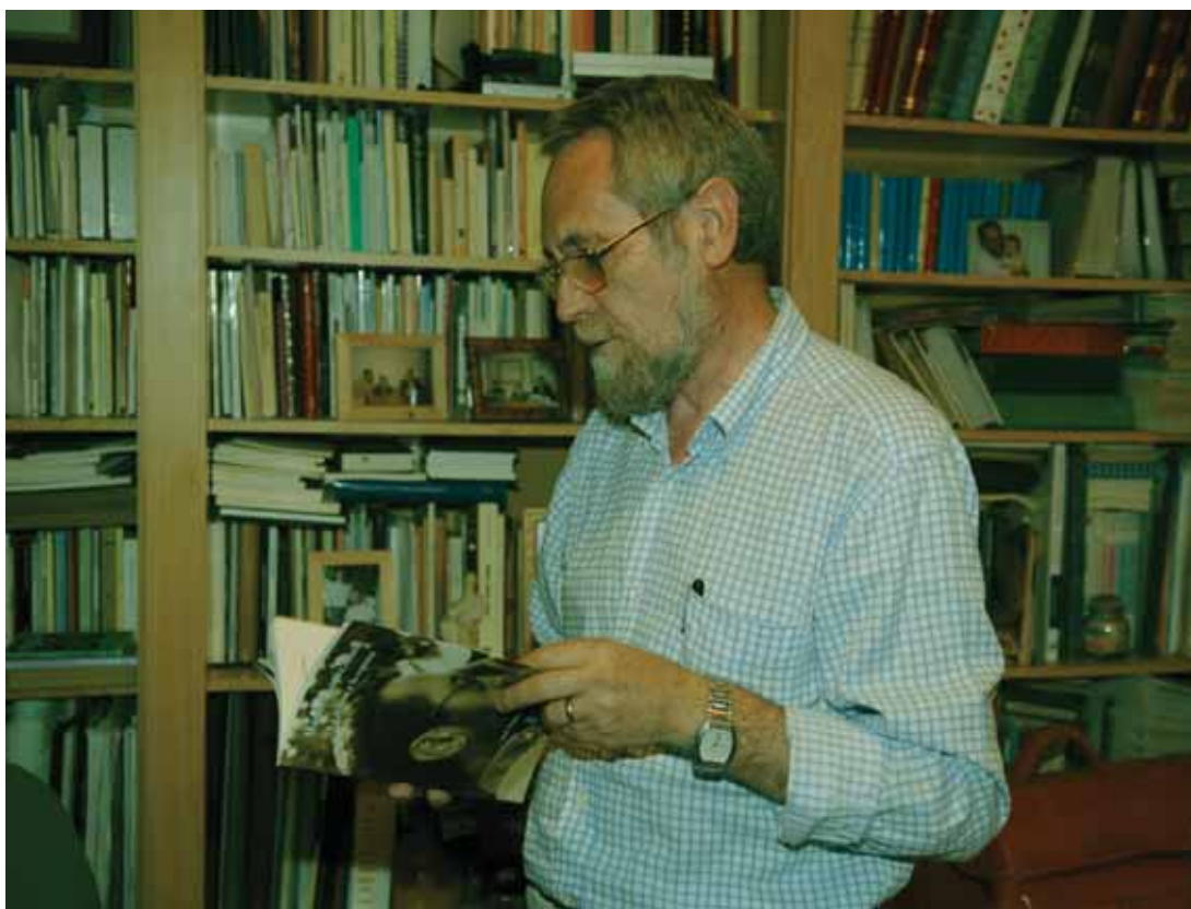
A lo largo de los próximos meses presentará ‘La ceniza y la espuma’ por toda España.