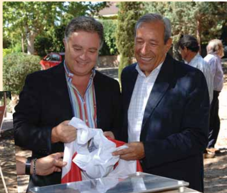
El presidente de la urbanización y el alcalde descubren la placa del 50 aniversario de Fuente del Fresno.

Tradición y participación se conjugaron para celebrar las fiestas de Nuestra Señora de Fuente del Fresno