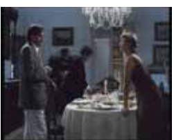
Villarriba Y Villabajo Viernes, 22,35 h.

15,00 Noticias Norte 15,30 Pleno municipal ordinario 17,20 Deportes de aventura 17,40 Teknópolis 18,05 Dinosaurios 19,00 Carrera para salvar el planeta 20,00 Noticias Norte 20,30 Villarriba Y Villabajo 21,25 Las aventuras de Pepe Carvalho 22,25 Zoombados 23,00 Policías En Acción