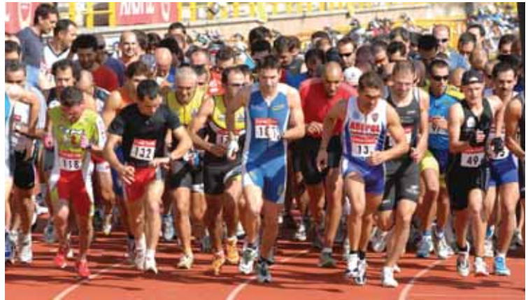
Los participantes tuvieron que recorrer siete kilómetros corriendo y 20 en bicicleta por el interior de la Dehesa Boyal. Aunque no demasiadas, hubo agentes femeninas que se atrevieron con el reto.

Dehesa Boyal seguido de una prueba de 20 kilómetros en bicicleta de montaña por el mismo lugar para acabar con otros dos kilómetros de carrera. Para Jorge Calderón, delegado de