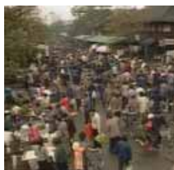
Carrera para salvar el planeta Jueves, 22,30 h.