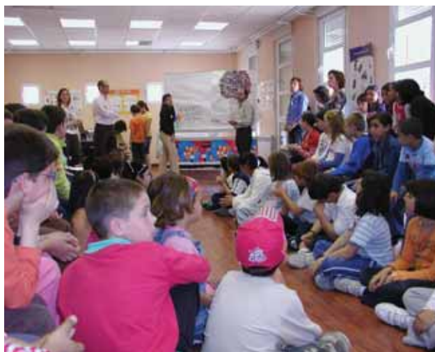
Hay que enseñar a los más pequeños a través de juegos didácticos a entender el mundo desde un punto de vista humano y solidario.

Durante el pasado curso 2007-2008, muchos alumnos participaron en actividades de educación para el desarrollo en sus centros. Especialmente interesantes y participativas fueron las desarrolladas en el marco del proyecto de Asamblea de Cooperación por la Paz "Escuela sin Racismo, Escuelas para la Paz y el Desarrollo" y durante la Semana de Acción Mundial por la Educación, organizada por un consorcio