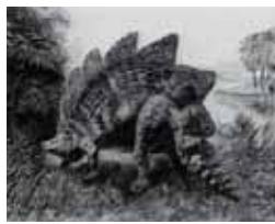
Dinosaurios Lunes, 22,35 h.