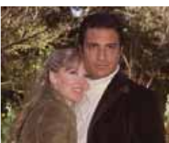
Mujer de madera Lunes a viernes, 14,15 h.