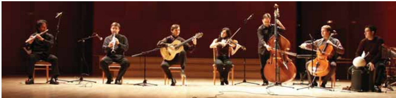
Alquitarra y su creación "La esencia de los sonidos" nos sumerge en la música flamenca. Estreno Nacional en el TAM, Domingo 28, 20:00h.