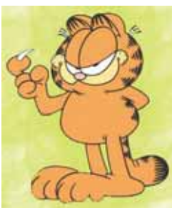
Garfield Lunes a viernes, 20,10 h.

13,00 Garfield 13,30 Historias insólitas 14,00 La cocina de Mikel Bermejo 14,15 Amarte es mi pecado 15,00 Matrícula 16,00 Atei 20,00 Boletín informativo 20,10 Garfield 20,35 Historias insólitas 21,05 La cocina de Mikel Bermejo 21,30 Dkda, sueños de juventud 21,55 Matrícula 22,20 Boletín informativo 22,30 Deportes de aventura 22,55 Cine: Asesino