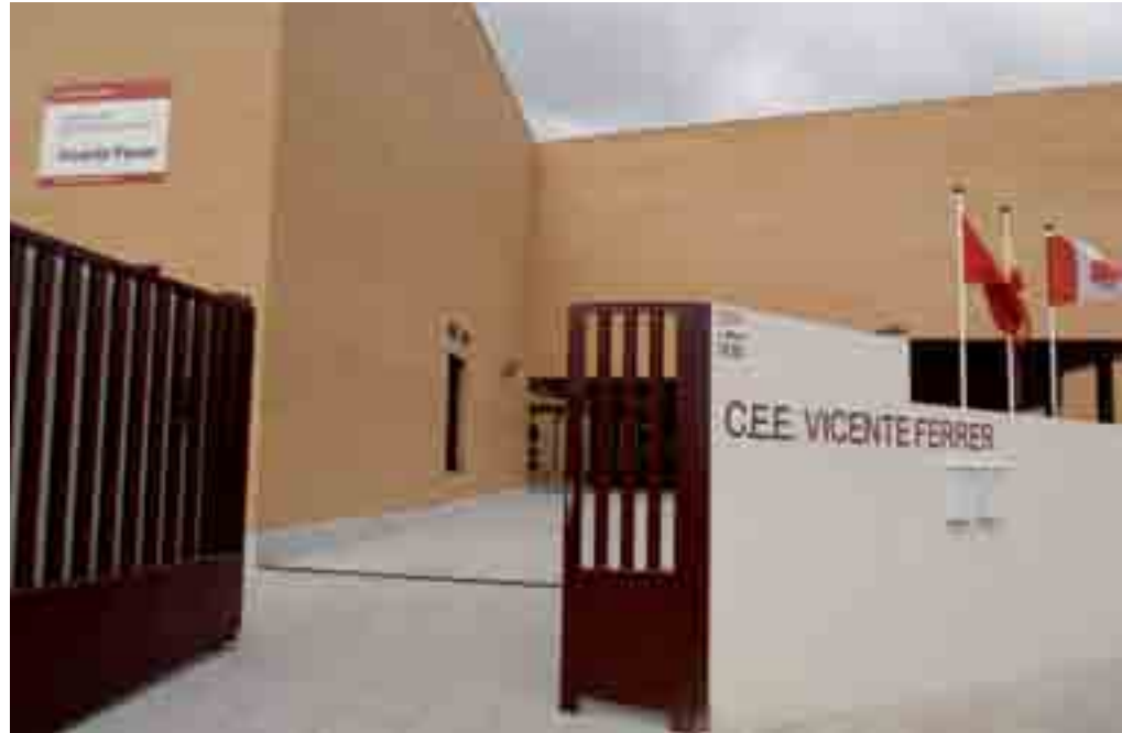
Vista de la fachada del elegante edificio, bautizado Vicente Ferrer en homenaje al filántropo español, fallecido hace unos años, que tanto hizo por los niños en la India.

El Centro cuenta con una gran zona ajardinada en toda su área perimetral interior, que seguro posibilitará a los alumnos y docentes hacer más agradable su estancia durante la jornada esco-