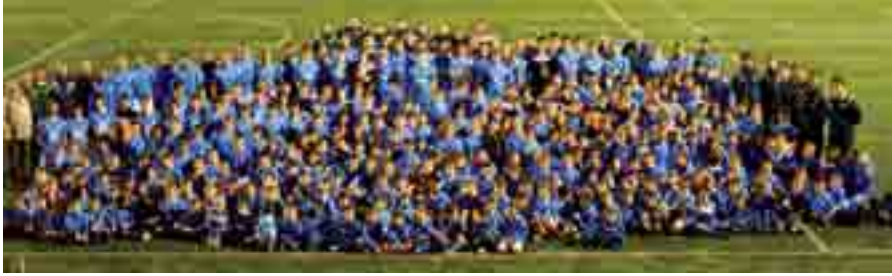
Una de las premisas de la actual directiva del club ha sido crecer todo lo que se pudiese.

H ace 14 meses que la nueva directiva del Juventud Sanse se hizo cargo del club y éste ha ido creciendo poco a poco a lo largo de este tiempo. Ese ya lejano mes de noviembre de 2010, había en el club alrededor de 430 jugadores; ahora, 14 meses después, el Juventud Sanse tiene censados a un total de 510 jugadores, lo que le coloca a la cabeza de los clubes escuela del norte de la Comunidad de Madrid.