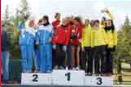
El equipo femenino, al igual que el masculino, subió al tercer cajón del pódium.

Tercer puesto del Club Atletismo S.S. de los Reyes