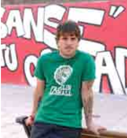
El popular cantante, que es vecino de nuestra ciudad, hizo vibrar el Teatro Auditorio Marsillach.

300 jóvenes de Sanse disfrutaron de la grabación de un concierto publicitario de Dani Martín en el Adolfo Marsillach