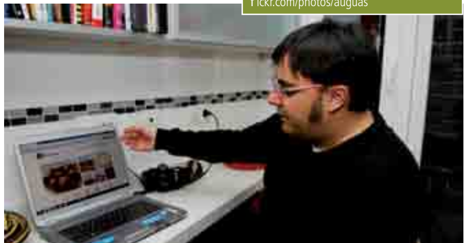
El blog “Recetas de rechupete” se ha convertido en una referencia en Internet.

facebook.com/recetasderechupetefanpage twitter.com/derechupete flickr.com/photos/auguas