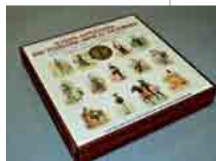
Primera edición de la "Magnífica Antología del Folklore Musical en España".