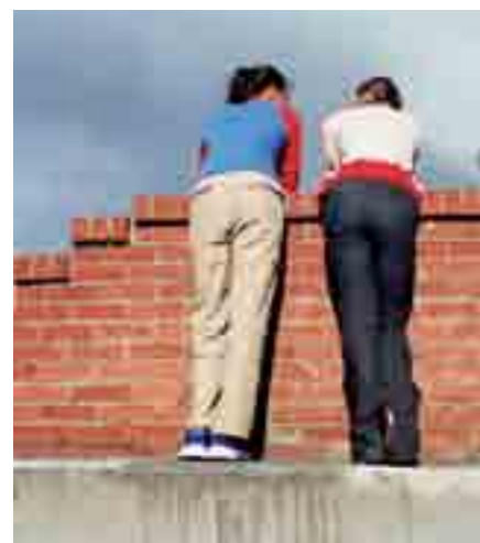
El Ayuntamiento ha publicado un libro que sirve a las familias para incentivar buenos hábitos en los hijos.

Es importante que desde el primer día los niños vayan contentos, ilusionados y con ganas de aprender al centro escolar. Cuando desde los primeros cursos los niños aprenden a valorar todo lo relacionado con el colegio (los materiales, los profesores, las asignaturas), adquieren unos buenos hábitos de trabajo y se sienten orgullosos de lo que van haciendo y aprendiendo,