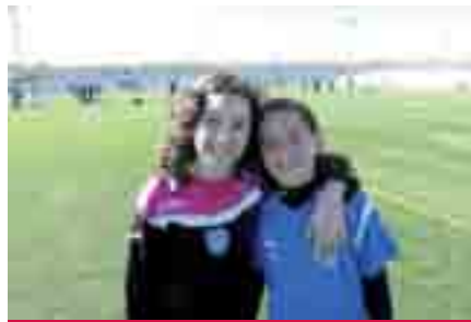
Dos niñas del Juventud Sanse, camino del Campeonato de España