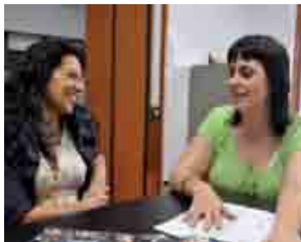
El Aula de Mujer, un lugar de participación donde las mujeres pueden aprender e intercambiar experiencias.

La Concejalía de Igualdad abre el Aula de Mujer que funcionará hasta el próximo 23 de abril ofreciendo a las mujeres su propio espacio para el intercambio de opiniones y experiencias.