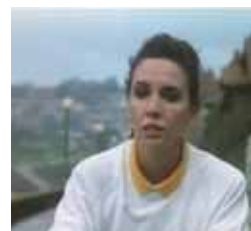
Adiós pequeña Fin de semana, 15,30 h.

MIÉRCOLES 15 13,00 La aldea del Arce 13,20 El patito feo 13,50 El mundo secreto de A. Mack 14,15 La cocina de Mikel Bermejo 14,30 Mujer de madera 15,15 Matrícula 16,00 Atei 20,00 Boletín informativo 20,15 La aldea del Arce 20,40 El patito feo 21,05 El mundo secreto de A. Mack 21,30 La cocina de Mikel Bermejo 22,00 Matrícula 22,35 Boletín informativo 22,45 Frontera límite 23,40 Mis enigmas favoritos