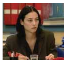
Raquel busca su sitio Viernes, 22,15 h.

MARTES 14 13,00 La aldea del Arce 13,20 El patito feo 13,50 El mundo secreto de A. Mack 14,15 La cocina de Mikel Bermejo 14,30 Mujer de madera 15,15 Matrícula 16,00 Atei 20,00 Boletín informativo 20,15 La aldea del Arce 20,40 El patito feo 21,05 El mundo secreto de A. Mack 21,30 La cocina de Mikel Bermejo 21,55 Matrícula 22,30 Boletín informativo 22,45 Teknópolis 23,10 Hª de sexo de gente común