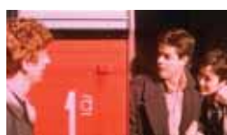
Los peores años de nuestra vida Fin de semana, 15,30 h.

SÁBADO 11 Y DOMINGO 12 15,00 Noticias Norte 15,30 Cine: Adiós pequeña 16,55 Deportes de aventura 17,50 Teknópolis 18,20 Ciudades para el siglo XXI 18,45 De Polo a Polo 19,15 Reparto a domicilio 20,00 Noticias Norte 20,30 Raquel busca su sitio 21,40 Mis enigmas favoritos 23,00 Zoombados 23,55 Hª de sexo de gente común