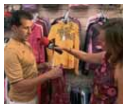
De compras por Sanse Lunes a viernes, 22,30 h.

JUEVES 2 13,00 La aldea del Arce 13,20 El patito feo 13,50 El mundo secreto de A. Mack 14,15 La cocina de Mikel Bermejo 14,30 Mujer de madera 15,15 Matrícula 16,00 Atei 20,00 Boletín informativo 20,15 La aldea del Arce 20,40 El patito feo 21,05 El mundo secreto de A. Mack 21,30 La cocina de Mikel Bermejo 22,00 Matrícula 22,30 Boletín informativo 22,40 De compras por Sanse 22,55 De Polo a Polo 23,25 Cine: Babies