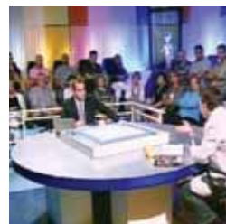
Mis enigmas favoritos Miércoles, 23,55 h.

VIERNES 3 13,00 La aldea del Arce 13,20 El patito feo 13,50 El mundo secreto de A. Mack 14,15 La cocina de Mikel Bermejo 14,30 Mujer de madera 15,15 Matrícula 16,00 Atei 20,00 Boletín informativo 20,15 La aldea del Arce 20,40 El patito feo 21,05 El mundo secreto de A. Mack 21,30 La cocina de Mikel Bermejo 22,00 Matrícula 22,35 Boletín informativo 22,45 De compras por Sanse 23,00 Raquel busca su sitio 00,10 Zoombados