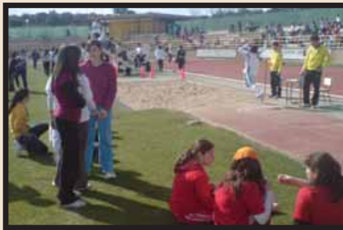
Los Juegos Deportivos Escolares congregaron en la edición pasada 1.300 alumnos de Primaria y Secundaria.