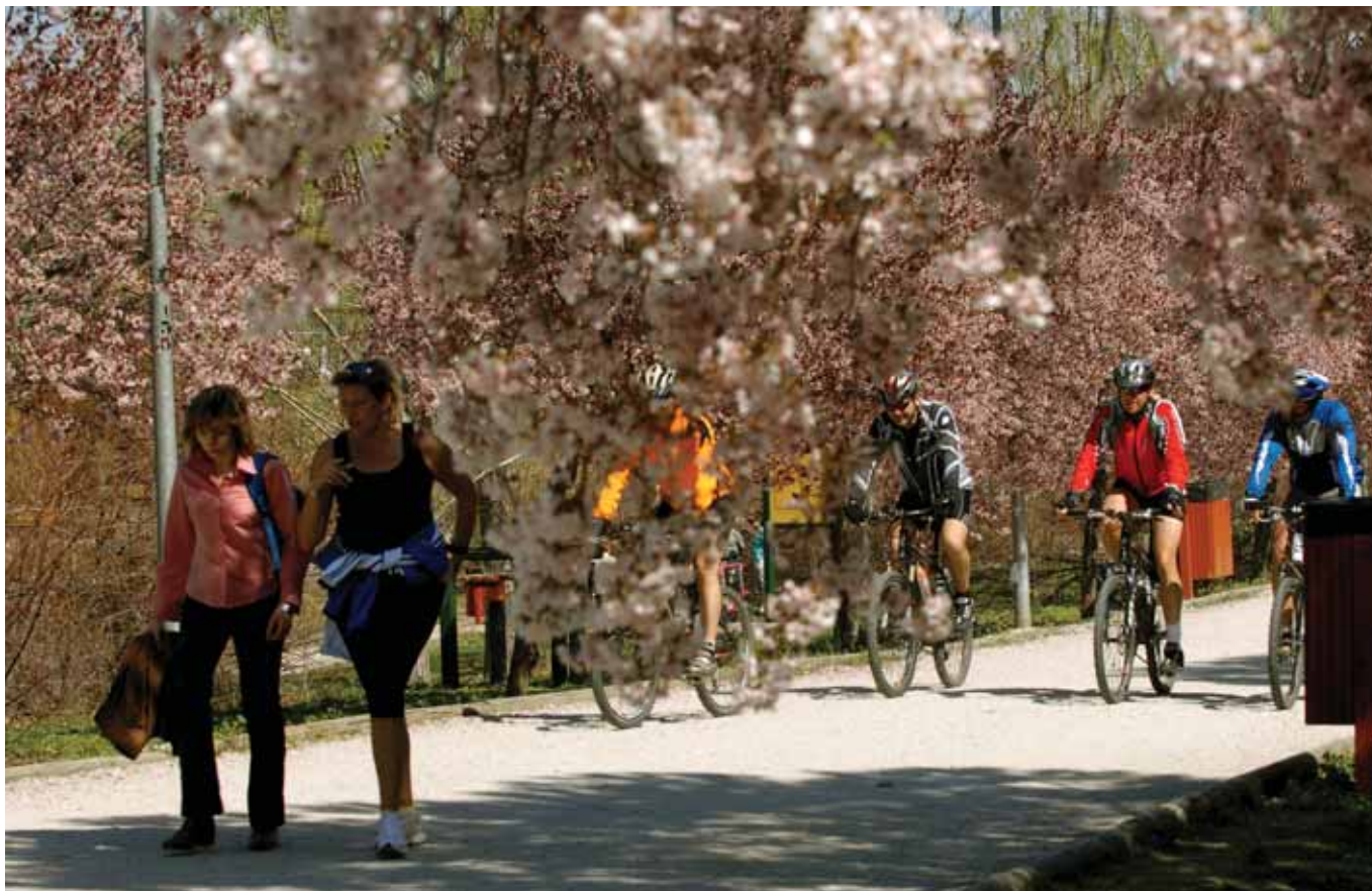
Los parques de Dehesa Vieja, Cerro del Baile y La Marina convertirán a Sanse en el gran pulmón verde del norte de Madrid.

EL NUEVO PARQUE DE LA DEHESA, LA LUCHA CONTRA EL RUIDO DE BARAJAS Y LA ECOTARJETA, PUNTOS FUERTES