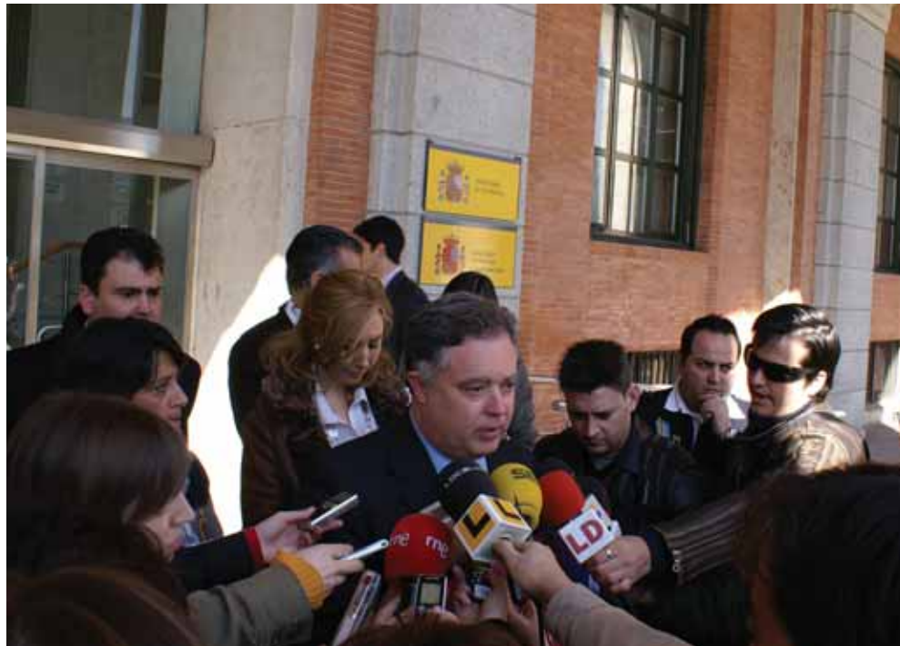
El alcalde después de presentar las alegaciones contra el ruido de Barajas en Fomento.

vertirá San Sebastián de los Reyes en el gran pulmón verde del norte de Madrid.