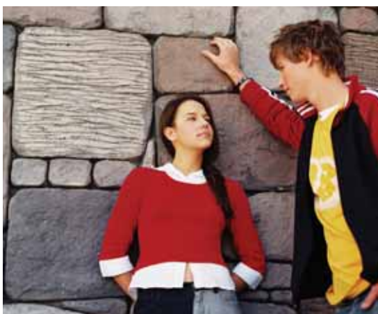
Este servicio está dirigido a disminuir el número de embarazos no deseados y las enfermedades de transmisión sexual.

Entre estos factores, los expertos del servicio desglosan la utilización tardía de