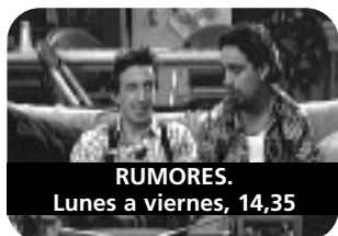
RUMORES. Lunes a viernes, 14,35