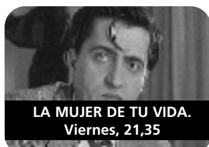
LA MUJER DE TU VIDA. Viernes, 21,35