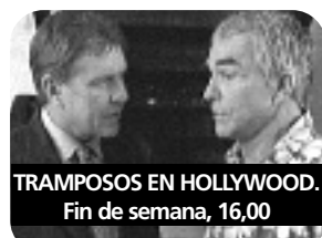
TRAMOSOS EN HOLLYWOOD. Fin de semana, 16,00