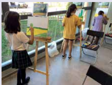
El Taller de pintura estimula la creatividad infantil.

Ya han comenzado las actividades dirigidas a la infancia y organizadas por la Concejalía de Juventud e Infancia para el curso 2014/15. Dentro de esta oferta se encuentran los talleres que tienen como objetivo acercar a los menores al conocimiento y adquisición de ciertas habilidades relacionadas con distintas áreas.