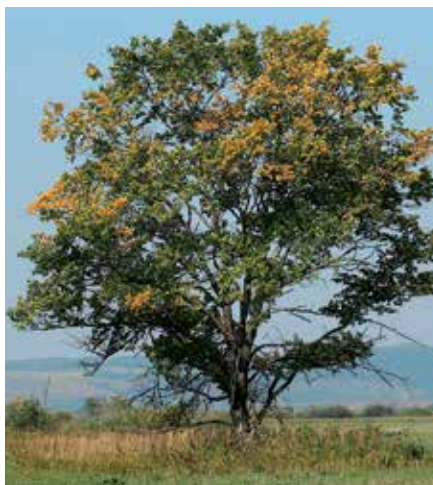
Un ejemplar de 'ulmus laevis'.

El objetivo pasa por restablecer el papel que ha desempeñado el olmo común en el paisaje forestal español mediante su reintroducción en hábitats ribereños, además de preservar y expandir los recursos genéticos del olmo blanco europeo en la Península Ibérica, donde solo sobreviven algunas poblaciones residuales. El Programa Life, valorado en más de 1,3 millones de euros, del que nuestro municipio se va a beneficiar con la plantación de 7.128 olmos ( ulmus laevis ) resistentes a la grafiosis, reforzará la singularidad de nuestro municipio, junto al de Aranjuez, ya que convierte a las dos localidades en las primeras en desarrollar un proyecto I+d+i dirigido a salvar a la especie de su extinción. La plantación y por tanto recuperación de nues-