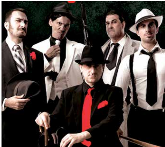
'The Gagfather', de Yllana, el sábado 8 a las 20:00 h. en el TAM.