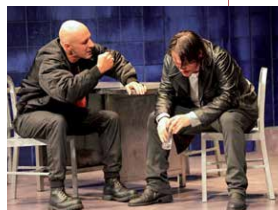
La puesta en escena de esta obra es minimalista.

"Toda la puesta en escena, casi minimalista, ha sido concebida para que nada nos distraiga de su interpretación; en esta función lo más importante es la palabra y la palabra es suya. Trabajar con Sergio y con Roberto ha sido uno de las cosas más