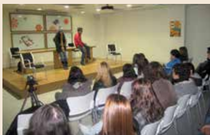
Un momento de la representación de la obra.

El programa se dirige a los alumnos de 3º y 4º de ESO de los institutos 'Torrente Ballester', 'Julio Palacios', 'Juan de Mairena' y Atenea. Utiliza el teatro y el trabajo de dos actores profesionales para escenificar alguna de las situaciones más típicas de las relaciones de sumisión o dependencia: el control de la vestimenta, el de las amistades y el chantaje