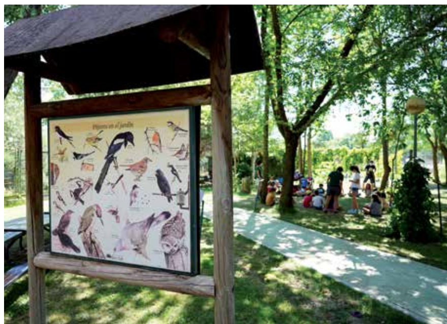
▲ Campus de verano en el Centro Municipal de la Naturaleza.