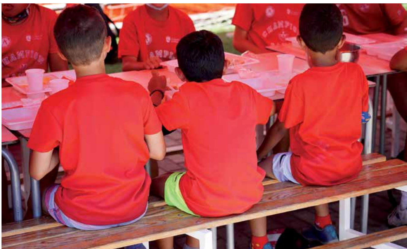
▲ En la oferta de municipal de 7.200 plazas vienen incluidas 900 para las familias más desfavorecidas de la ciudad, con el fin de facilitar la inserción social a través del deporte.

El Ayuntamiento subvenciona el 50% de la actividad, sin incluir las de protección social para garantizar que una gran parte de las familias de la ciudad puedan combi-