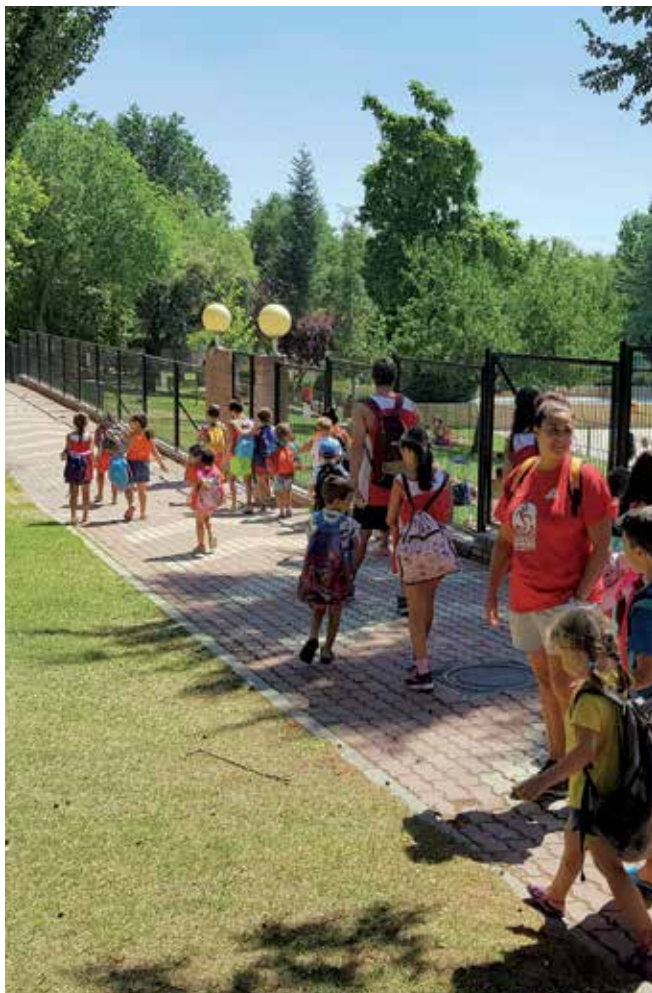
▲ En cuanto a seguridad, se establece en 20 alumnos/as por monitor y ayudante de monitor (10/1).