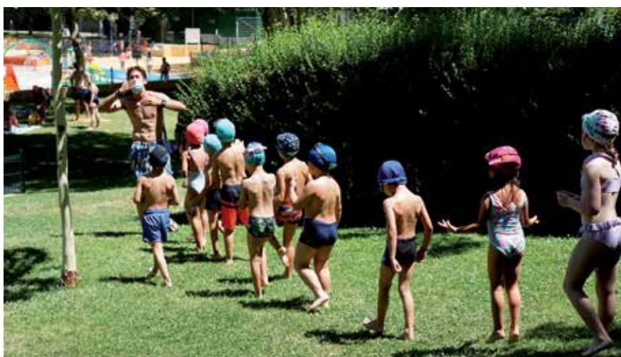
▲ Las actividades, tanto al aire libre como dentro de las instalaciones municipales, se han diseñado para garantizar la diversión.

“Sigue el vídeo en Canal Norte con tu móvil”