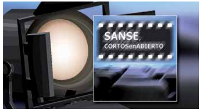
▲ 'Sanse cortos en abierto', el viernes 12 de mayo a las 20:00 h.

Para niñas y niños a partir de 4 años, 18:00 h. Un acompañante por menor. Hasta completar aforo.