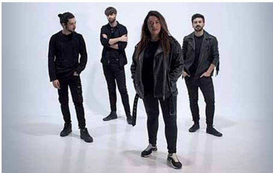
▲ 'Valmara' es una banda formada por cuatro músicos madrileños con un sonido potente e incendiario.