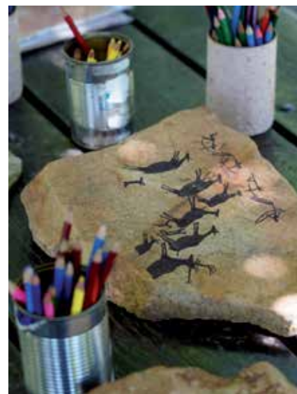
▲ Los talleres están dirigidos a distintos grupos de edad.