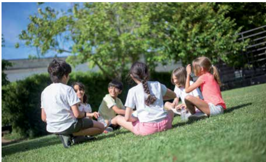
▲ La Lanzadera propone dos programas para diferentes grupos de edad

► Precio: actividad gratuita para empadronados.