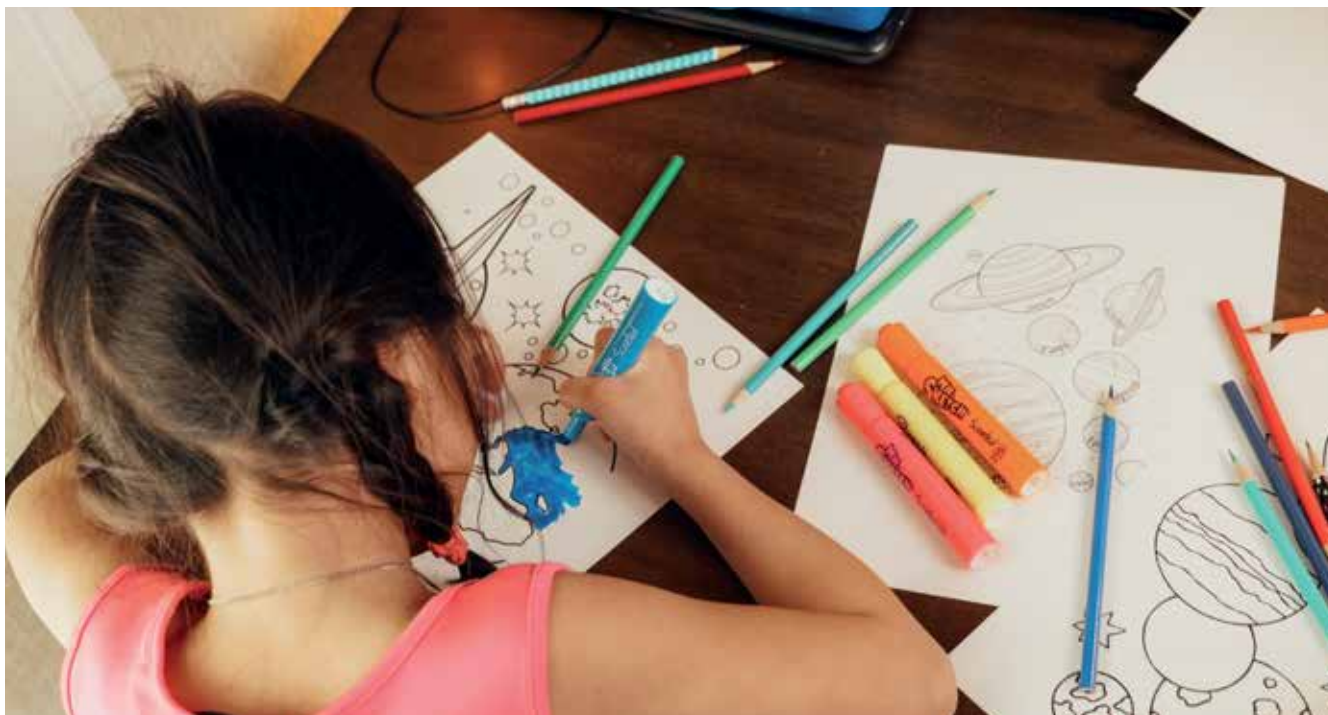
▲ 'El programa de junio y septiembre no lectivo 2023' consiste en un conjunto de actividades lúdicas, incluyendo juegos y talleres grupales para los niños.

El programa de Las tardes de junio y septiembre 2023 es un recurso municipal para ayudar a conciliar la vida laboral y familiar durante ambos meses, ya que en estos períodos los colegios tienen horario continuo y la salida de los centros se adelanta una hora. Este programa va dirigido a todo el alumnado escolarizado en los colegios públicos de Educación Infantil y Primaria del municipio y no incluye merienda.