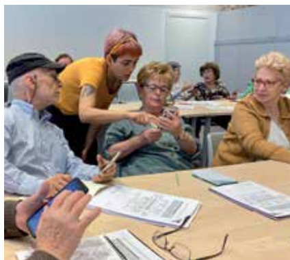
▲ Los talleres están dirigidos a personas mayores de 65 años.