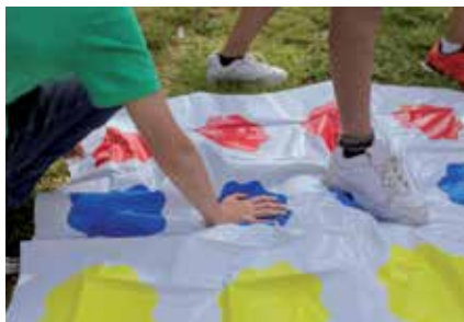
▲ Los campus urbanos favorecen la conciliación.