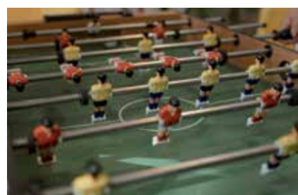
▲ Las actividades de interior resguardarán del calor.