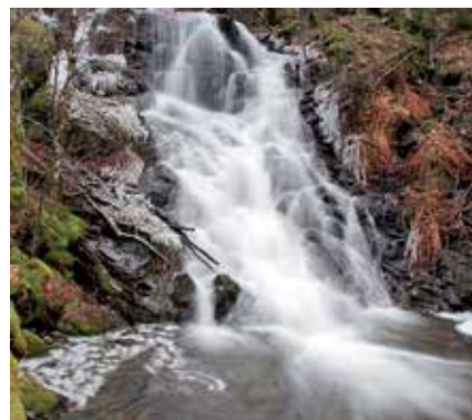
▲ La Chorrera de Mojonavalle es un enclave único.

Marcha Primavera. Salida: 9:30 h. del Punto Activo del Parque de la Marina. Recogida de material: de 9:00 a 9:30 h. Regreso y entrega de obsequios: a las 11:15 h. al mismo Punto. Estiramientos: de 11:30 a 12:15 h. Recorrido 7,9 km. Inscripciones: Por orden de llegada del 26 de abril al 19 de mayo.