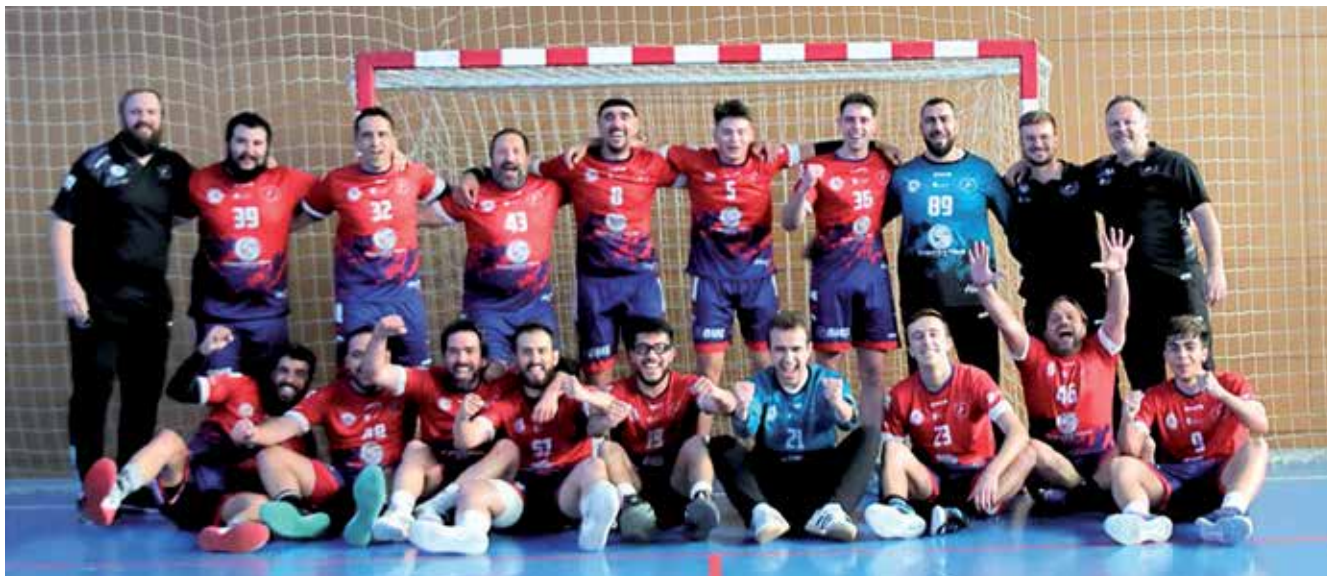
▲ El club sansero ha cosechado un total de 17 victorias, un empate y tres derrotas en la presente temporada, un balance excepcional.