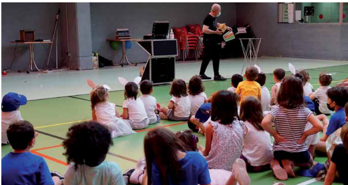
▲ El plazo de inscripción a los campus se iniciará el 3 de mayo a las 8 de la mañana a través de la web www.campusveranosanse.org .

El plazo de inscripción a los campus se iniciará el 3 de mayo a las 8 de la mañana a través de la misma página web para poder realizar las gestiones on line.