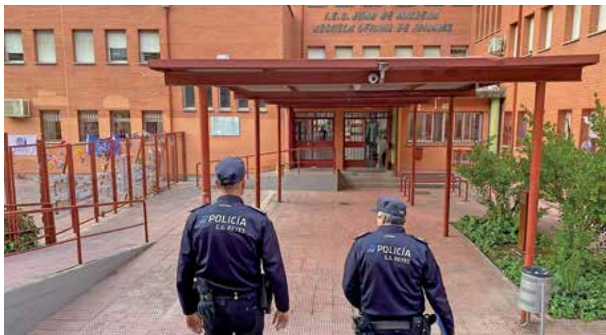
▲ La Unidad de Agentes Tutores participan en las jornadas de orientación para el paso al instituto.

Arranca el programa municipal de orientación educativa “De Sexto a Primero”, a través de las Delegaciones de Educación, Salud y Seguridad Ciudadana.