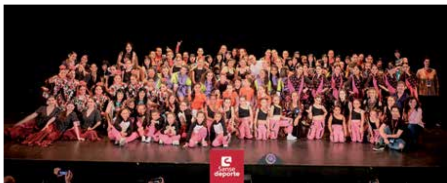
▲ Sonidos y voces cobraron vida sobre el escenario a través de más de 140 bailarines y bailarinas

Con la danza como estandarte, la asociación Modern Jazz Victoria, en colaboración con el Club Victoria Sanse, ya está preparando su próximo evento: el Festival Victoria 2023, que se celebrará el 27 de junio en el Centro Cultural Sanchinarro. ■