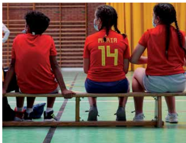
▲ La oferta incluye todas las edades para facilitar la conciliación laboral.

nar la conciliación y la práctica deportiva. En relación a las medidas de seguridad, la ratio se establece en 20 alumnos/as por monitor y ayudante de monitor (10/1), no pudiéndose en ningún caso superar el máximo de 24 (12/1). Además, para las plazas inclusivas, la ratio será de 2/1, y en todo momento, en general, se establecerá un control de los contactos con grupos cercanos en los servicios de transporte,