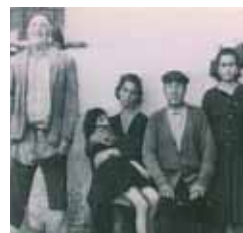
Los Santos Inocentes Fin de semana, 15,30 h.