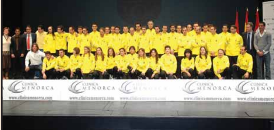
Los integrantes del Club Atletismo San Sebastián de los Reyes-Centro Clínico Menorca al completo, junto a las personalidades invitadas al acto y los representantes políticos de nuestra ciudad.

E l 18 de febrero se celebró en el Teatro Auditorio Adolfo Marsillach la presentación del Club Atletismo San Sebastián Reyes-Centro Clínico Menorca para esta temporada.