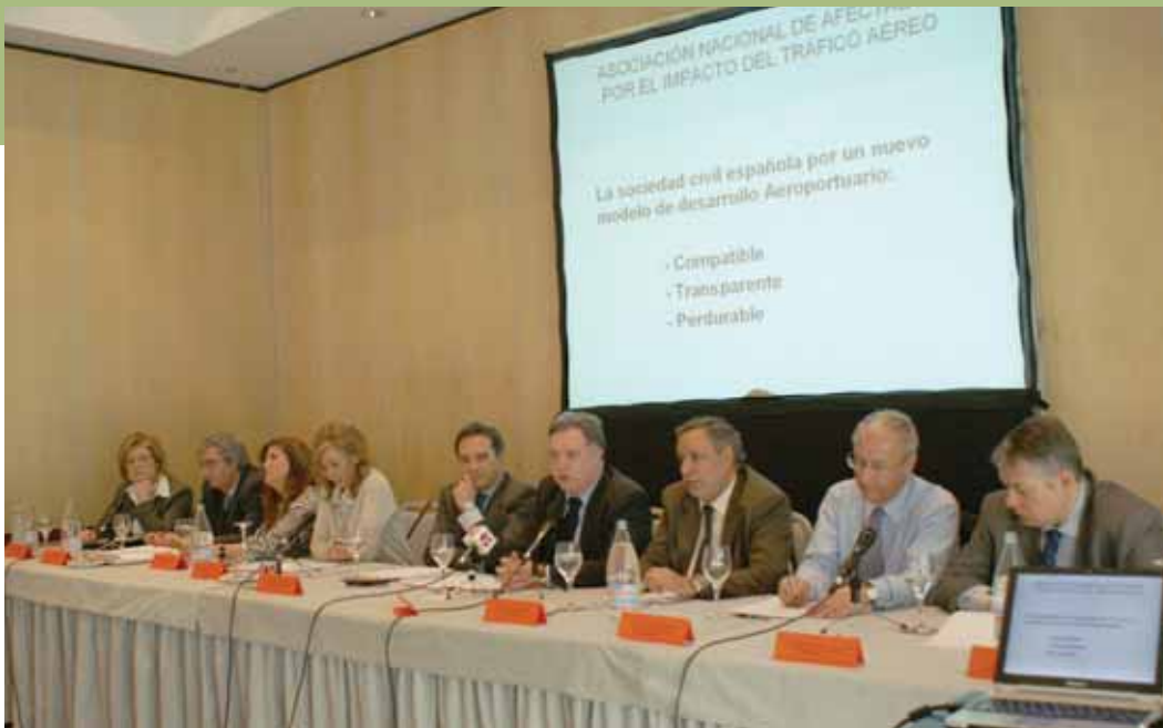
Los responsables políticos de los Ayuntamientos madrileños afectados por el ruido de los aviones de Barajas han hecho una puesta en común para reclamar al Ministerio de Fomento el incumplimiento de la normativa.

llegado a los 85 dbs., un ruido realmente insoportable y lesivo para la salud de los vecinos afectados”.