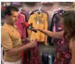
De compras por Sanse Lunes a viernes, 22,30 h.

13,00 Kampung Boy 13,20 Historias espeluznantes 13,50 La cocina de Mikel Bermejo 14,15 Dkda, sueños de juventud 14,30 Mujer de madera 15,15 Matrícula 16,00 Atei 20,00 Boletín informativo 20,15 Kampung Boy 20,40 Historias espeluznantes 21,00 La cocina de Mikel Bermejo 21,25 Dkda, sueños de juventud 21,50 Matrícula 22,25 Boletín informativo 22,35 De compras por Sanse 22,50 Viajes 23,40 Reparto a domicilio