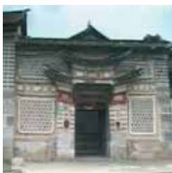
Diario de China Jueves, 22,50 h.