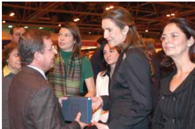
La infanta Elena junto a la concejala de Empleo, M ª José Esteban.

"Iniciativas como ésta son imprescindibles en la actualidad, por eso, nuestro Ayuntamiento se ha volcado en desarrollar actuaciones que repercutan directamente ayudando a nuestros vecinos en la búsqueda de empleo y mejorando las condiciones de entorno para la creación del mismo. Todas estas actuaciones se encuentran en el marco del Pacto por el Empleo firmado recientemente con los principales agentes sociales", manifestó la concejala de Empleo