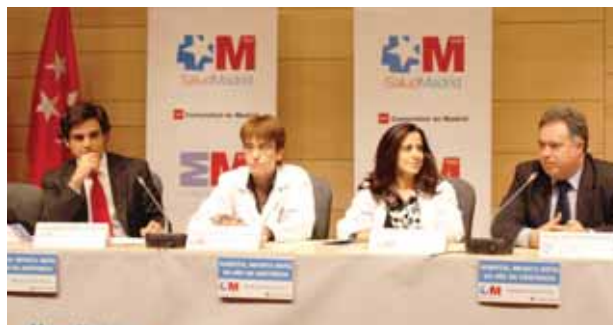
El consejero de Sanidad y el alcalde de nuestra ciudad flanquean a las responsables médicas del Hospital Infanta Sofía.

El Hospital Infanta Sofía cuenta con una plantilla de profesionales de alto nivel científico técnico altamente cualificados y amplia experiencia. En este sentido cobra especial relevancia el hecho de que, a los 3 meses del inicio de actividad de cirugía con ingreso, un equipo de cirujanos del Hospital Infanta Sofía –en colaboración con cirujanos del Hospital Puerta de Hierro– practicaron con éxito dos colecistectomías –extirpación de la vesícula– a través de un solo orificio, el ombligo. Es la primera vez que se realizaba este tipo de cirugía laparoscópica en España, y la tercera, en Europa. ●