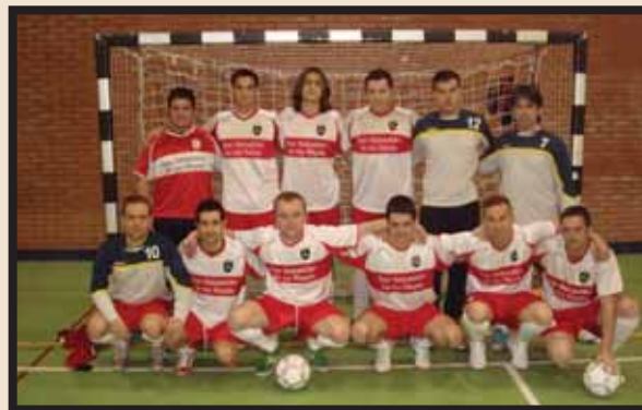
La gran virtud de 'Pinturas Marfil' es el valor de la amistad para seguir creciendo ya que ningún jugador cobra por jugar.

año tras año fueron ascendiendo de categoría hasta llegar a nacional, donde estuvieron jugaron 2 años consecutivos lo cual tiene mucho mérito ya que la mayoría de los equipos eran semiprofesionales. En este momento el equipo milita en categoría Preferente, en la segunda posición con opciones de ascenso a la categoría Nacional.