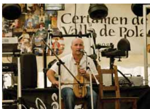
CADAIECO. El rabelista y trovador cántabro ofrece un amplio repertorio de romances y tonadas.

El Grupo de Cantares L'Alma, mantiene viva la tradición de los cantos tradicionales de su tierra, Sendim, como aquellos que se dedican al calendario litúrgico cristiano (Cuaresma,