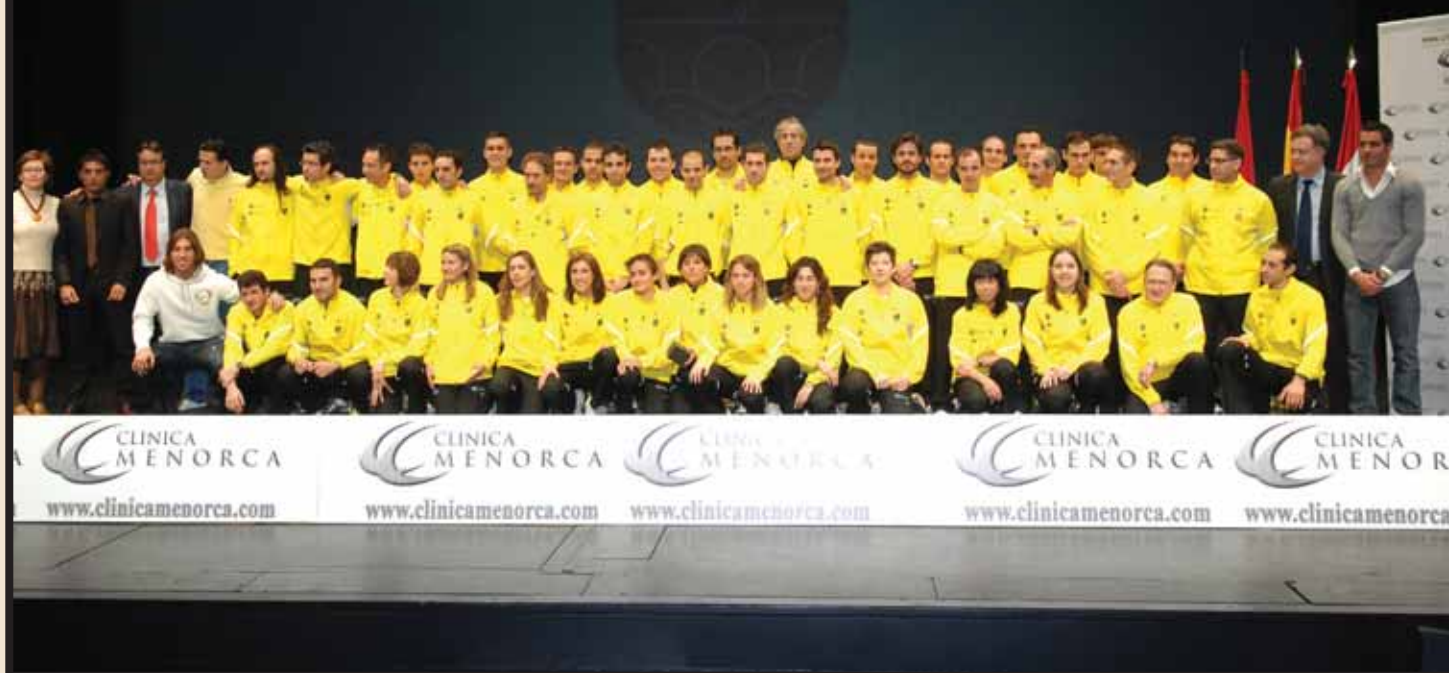
Los integrantes del Club Atletismo San Sebastián de los Reyes-Centro Clínico Menorca al completo, junto a las personalidades invitadas al acto y los representantes políticos de nuestra ciudad.

E l 18 de febrero se celebró en el Teatro Auditorio Adolfo Marsillach la presentación del Club Atletismo San Sebastián Reyes-Centro Clínico Menorca para esta temporada.