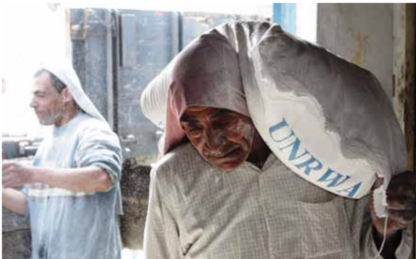
La región de Gaza en Palestina tiene necesidades básicas después del ataque israelí.

La ayuda del Ayuntamiento irá destinada al apoyo directo de 670 beneficiarios, mediante la compra de 670 paquetes de ayuda alimentaria regular. Cada uno de los paquetes contribuirá al 60 % del aporte calórico de cada uno de los beneficiarios durante un periodo estimado de 120 días (4 meses). Cada paquete alimentario contiene harina, arroz, azúcar, leche en polvo,