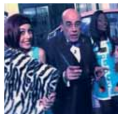
Reparto a domicilio Lunes, 23,40 h.

13,00 Kampung Boy 13,20 Historias espeluznantes 13,50 La cocina de Mikel Bermejo 14,15 Dkda, sueños de juventud 14,30 Mujer de madera 15,15 Matrícula 16,00 Atei 20,00 Boletín informativo 20,15 Kampung Boy 20,40 Historias espeluznantes 21,00 La cocina de Mikel Bermejo 21,30 Dkda, sueños de juventud 21,50 Matrícula 22,25 Boletín informativo 22,35 De compras por Sanse 22,50 Raquel busca su sitio 23,55 Zoombados