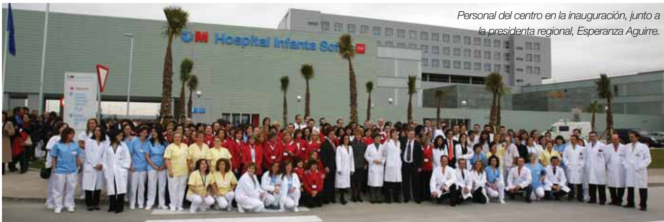
Personal del centro en la inauguración, junto a la presidenta regional, Esperanza Aguirre.