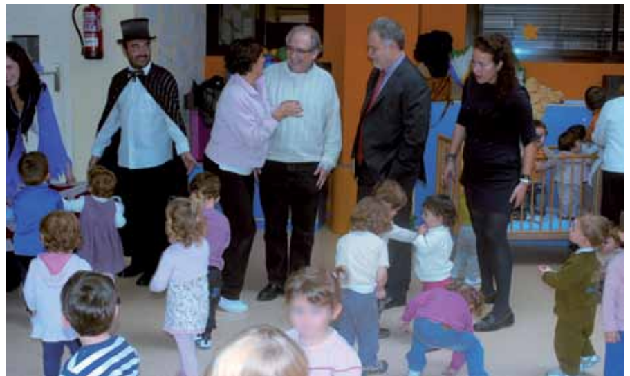
El alcalde conversa con padres y educadores del centro. Los niños se lo pasaron en grande con el espectáculo que ofreció el mago Depi.

Una tarde/noche del pasado 31 de octubre, la Noche de Halloween, asistieron a la Fiesta del Terror organizada en el Centro Joven Sanse cerca de mil niños y jóvenes, que participaron en los talleres y actividades preparadas por la Concejalía de Juventud. Por la tarde, hasta las 20.00 h., el centro se convirtió en un punto terrorífico para menores de 4 a 13 años que pintaron e hicieron caretas de monstruos con bolsas de cartón, fantasmas y murciélagos con material reciclado. Los jóvenes, hasta la medianoche, volvieron a pasar una noche de miedo en el pasaje del terror , ambientado en el cine, en colaboración con las Asociaciones juveniles Show Dancer, Gaar@ y Rolanbogán. ●●●