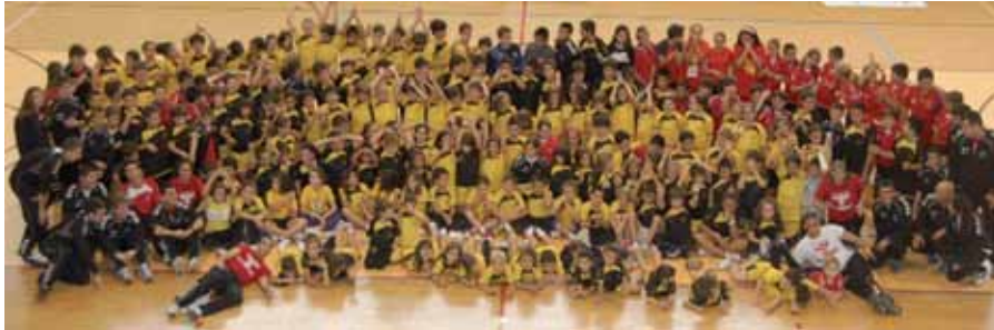
La participación en los diferentes equipos de balonmano sigue batiendo récords.

En esta temporada se contará con 11 equipos de edad alevín, 10 de categoría benjamín y otros 6 que participarán en una competición lúdica y flexible que se ha denominado: "liga empieza jugando". Los encuentros se disputarán en el Pabellón Valvanera (categoría alevín) entre las 17.00 y las 19.00 horas, cuatro encuentros, todos los viernes; en el Pabellón Velódromo se disputarán en el mismo horario sobre las canchas de minibalonmano las competiciones de empieza jugando y categoría benjamín. Los torneos tendrán duración hasta mediados de mayo, para culminar con el Torneo Ayuntamiento San Sebastián de los Reyes de categoría