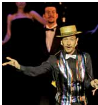
Los números míticos del musical de Broadway, el día 24 en el TAM.