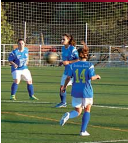
El fútbol femenino local sigue sumando deportistas y equipos.

E l Juventud Sanse sigue con su fuerte apuesta por el fútbol femenino, una de las promesas de la actual junta directiva. El club, el único con equipos federados femeninos en la localidad, estrenará este año un nuevo equipo en la categoría sub'13.