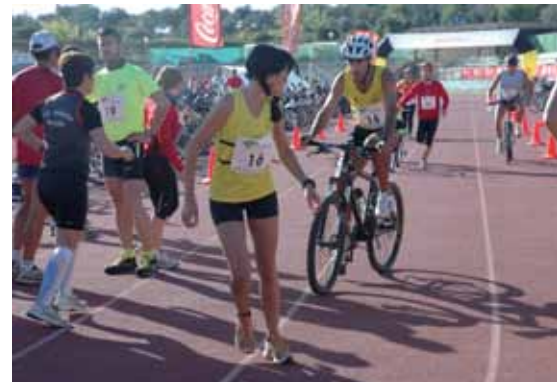
La Combi-2 se disputará por parejas, mixtas, masculinas o femeninas.

Una Combi-dos es una competición por parejas, en la que dos deportistas, uno sobre bicicleta de montaña y otro a pie, deben de hacer un recorrido de entre 25 y 30 km., siempre unidos, con una separación máxima entre ambos de 10 metros. Los deportistas deben cambiar su posición obligatoriamente (cada