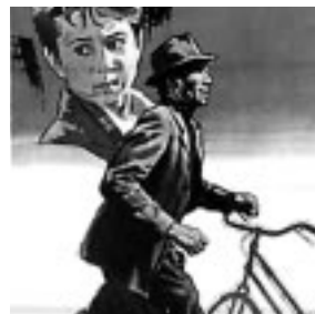
▲ El ladrón de bicicletas