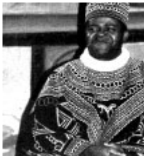
▲ Cuentos y Leyendas de África