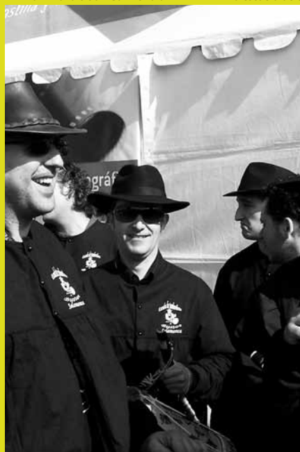
La escuela de t