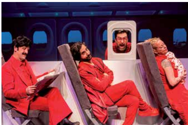
▲ "Passport" de Yllana, el jueves 27 a las 20:30 en el TAM.