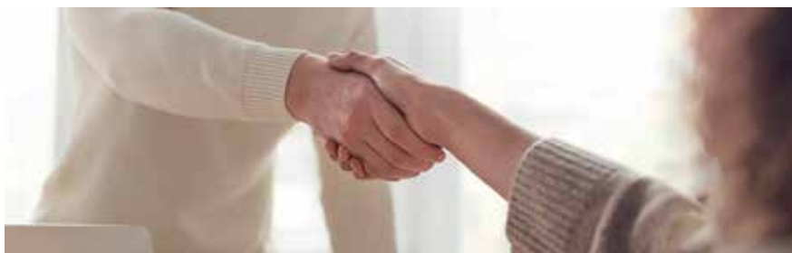
▲ Este servicio público municipal atiende discrepancias en el ámbito familiar, y también en el vecinal.

Este servicio público municipal de mediación está disponible para toda la ciudad y atiende, por ejemplo, la resolución de dis-