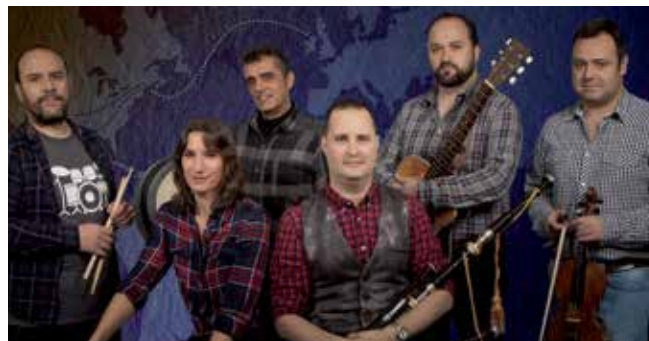
▲ Mosquera Celtic Band, el viernes 21 de octubre, en el Centro Marcelino Camacho.

Un lunes presencial al mes y material para trabajo online el resto de las semanas.