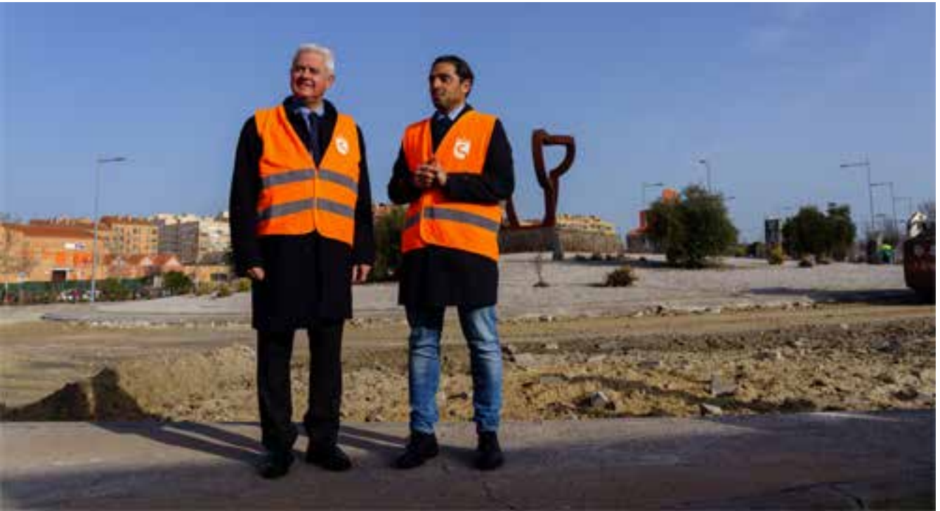
▲ El alcalde, Narciso Romero, y el vicealcalde, Miguel Ángel Martín Perdiguero durante una visita a la anterior fase de asfaltado de la ciudad.

Los tres primeros lotes de actuación de Sanse Asfalto incluyen las zonas de Moscatelares, el barrio de La Hoya, las urbanizaciones La Granjilla y Fuente del Fresno, avenida del Puente Cultural y el tramo norte del Paseo de Europa.