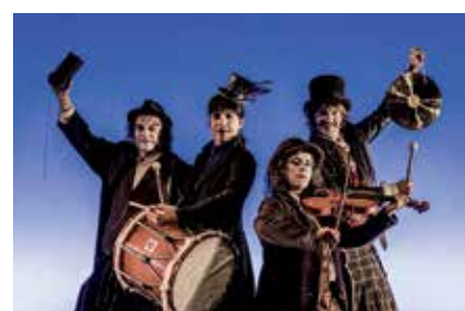
▲ La música en directo es un pilar fundamental en Paüra.

La responsable de este inusual montaje es la Compañía de Lucas Escobedo, cuyo impulsor es un artista multidisciplinar que bebe tanto del mundo circense como del teatro. Lucas Escobedo es también el creador de YOLO, un espectáculo premiado en FETEN 2019 al Mejor Espectáculo de Gran Formato y Premio al Mejor Espacio Sonoro. Asimismo, fue seleccionado como Espectáculo Recomendado en el catálogo de la Red de Teatros de España, ganador del Premio al Mejor