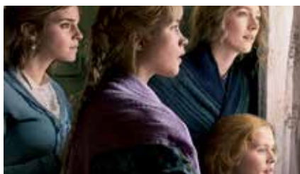
▲ "Mujercitas" es un ejemplo de reivindicación de las mujeres.

Para conmemorar el Día de las Escritoras, la Delegación de Igualdad presenta un debate con la Película "Mujercitas" (2019). Su guionista y directora, Greta Gerwig, ha creado una película atemporal y oportuna, que se basa tanto en la novela clásica como en los escritos de Luisa May Alcott. En la versión de Gerwig, cuatro jóvenes mujeres decididas a vivir la vida según sus propias normas deberán enfrentarse al reto de llegar a la edad adulta