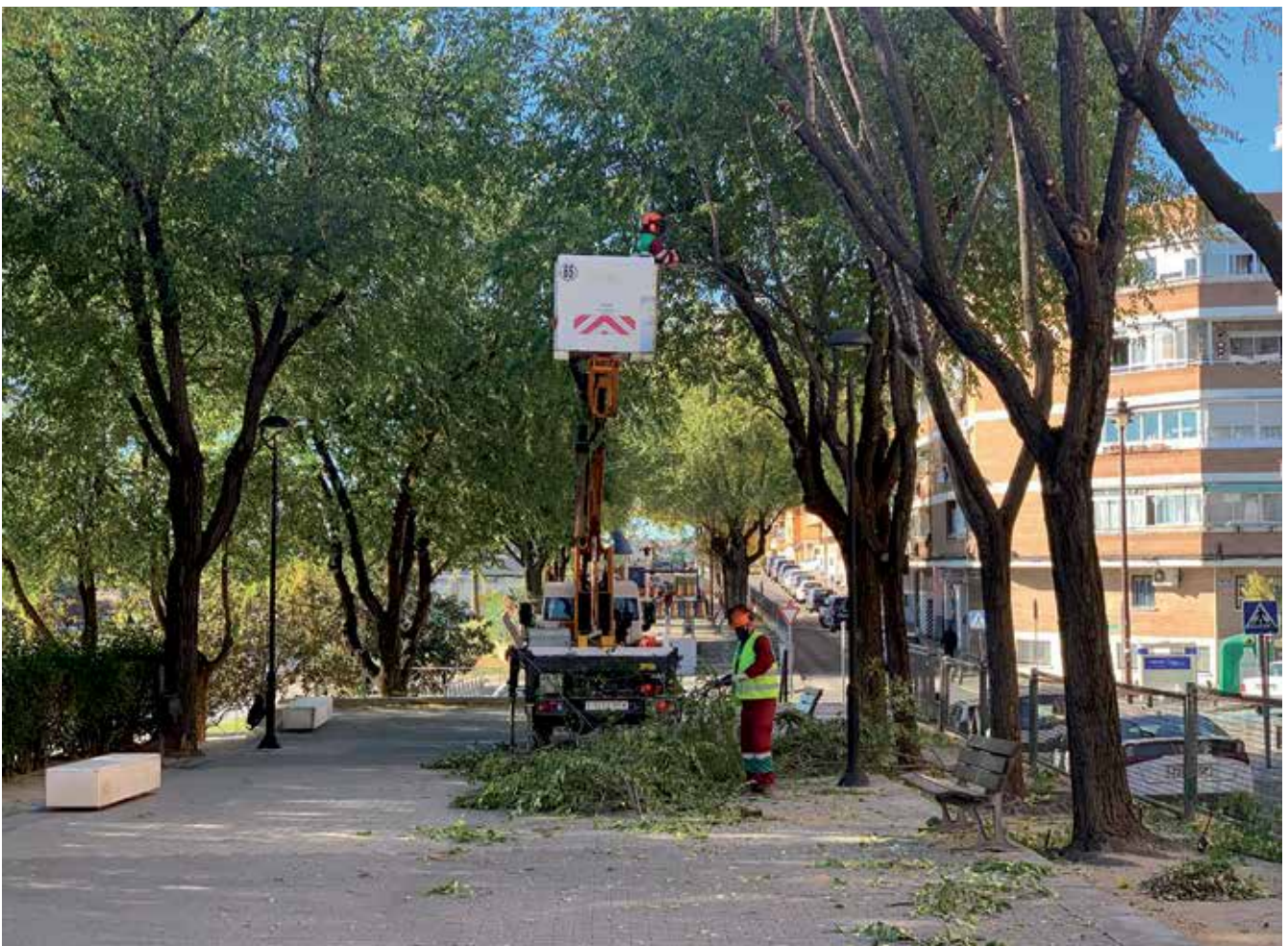
▲ El nuevo contrato ampliará los trabajadores estables actuales, de 89 a un total de 149, una ampliación sustancial del ratio en cuanto a trabajadores por metro cuadrado de zona verde.

El nuevo contrato, que acaba de iniciar los plazos de licitación, apuesta por implementar más medios humanos y maquinaria de última generación que cumpla todos los requisitos, además de los legales, también los referentes a sostenibilidad ecológica.