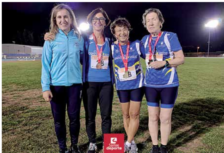
▲ “20 años Ballet Flamenco José Porcel”, el sábado 8 de octubre

Es de encomiar el logro de estas mujeres, no sólo por el excelente resultado, sino por todo el trabajo y esfuerzo que dedican durante toda la temporada, y compaginan con su vida laboral y familiar. ■