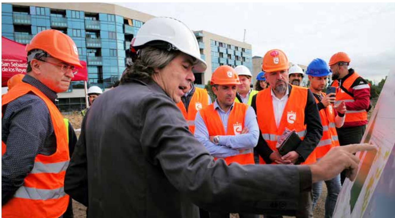
▲ Las autoridades municipales inspeccionaron la buena marcha de las obras. El proyecto de la Ciudad del Rugby cuenta con una inversión municipal de 5.750.000 euros.

El Gobierno municipal ha visitado el 11 de octubre las obras de la Ciudad del Rugby que se iniciaron el pasado mes de agosto, uno de los proyectos más importantes de la ciudad que se realiza junto con la Federación de Rugby de Madrid y será un punto de referencia deportivo de la Comunidad de Madrid.