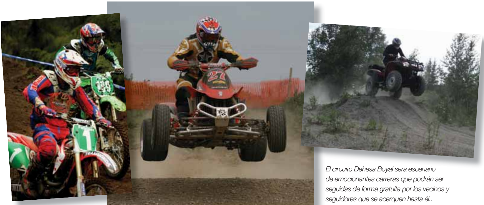
El circuito Dehesa Boyal será escenario de emocionantes carreras que podrán ser seguidas de forma gratuita por los vecinos y seguidores que se acerquen hasta él.

EN EL CIRCUITO DEHESA BOYAL Y EL FIN DE SEMANA DEL 15 Y EL 16