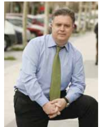
El alcalde está indignado con la actitud de los responsables estatales.

garantizando la viabilidad de estos sistemas a largo plazo”. Por este motivo, junto a los estudios para elegir los mejores emplazamientos teniendo en cuenta los impactos acústicos y ambientales, la orografía del terreno y las necesidades de las futuras instalaciones, se han tenido en cuenta también los futuros accesos, con el fin de garantizar el transporte público y privado a los nuevos aeropuertos. ●