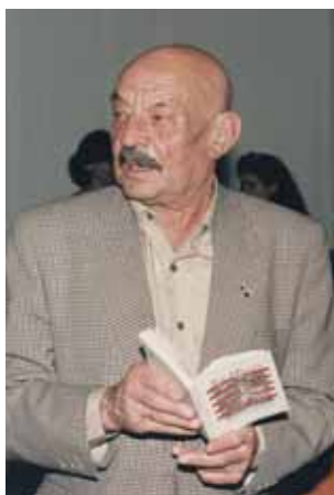
José Hierro da nombre al premio nacional de poesía que se falla en nuestra localidad.

El ganador, nacido en Cantabria, reside en Valencia desde 1952. Es doctor en Filología y licenciado en Ciencias de la Comunicación. Desde 1982 es profesor de Literatura Española Contemporánea en la Universidad de Valencia. Entre sus libros de poesía cabe destacar: Circu-