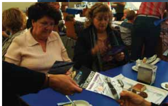
La visita guiada al museo de CosmoCaixa es sólo una de las muchas actividades del programa de animación sociocultural del "Gloria Fuertes".