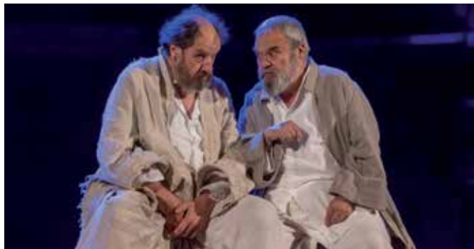
'Sócrates, juicio y muerte de un ciudadano', el sábado 7 en el TAM.