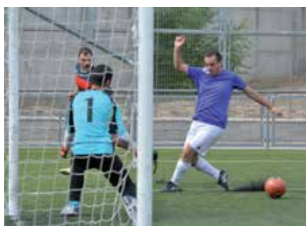
Lance de juego en un partido donde lo importante era colaborar con la causa.

El Grupo Geicam de Investigación en Cáncer de Mama logró recaudar más de 4.000 euros en el I Torneo Solidario Interempresas de Fútbol 7, celebrado en el Polideportivo Dehesa Boyal el 17 de octubre, con la colaboración del Ayuntamiento y la marca deportiva Joma Sport. El ganador fue el equipo del concesionario de coches Motor Mecha. La recaudación se destinará al proyecto EFIK del Grupo Geicam de Investigación en Cáncer de Mama, que analizará el beneficio del ejercicio físico intenso en las pacientes.