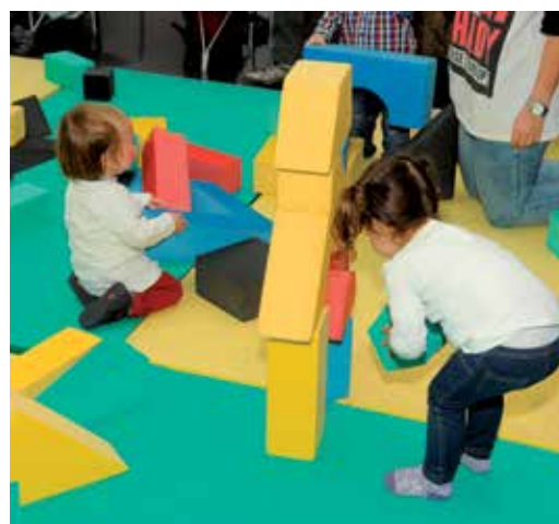
Las actividades y juegos infantiles son los grandes protagonistas de la VII Semana de la Infancia.

Con este motivo, la población infantil de 0 a 13 años, va a tener a su disposición una amplia oferta de actividades municipales pensadas para que disfruten al máximo de estos días. Los más jóvenes de la ciudad van a ser los protagonistas de estos días, en los que podrán acceder a juegos, talleres, exposiciones, cuentacuentos, espectáculos, actividades de participación infantil, etc. ●●●