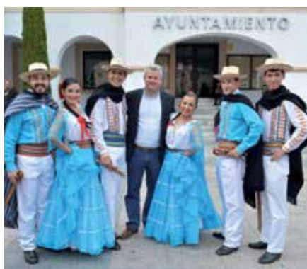
El alcalde con un grupo participante.

Cientos de personas pudieron disfrutar de la música y el baile de sus respectivos países en La Plaza de la Constitución de nuestra ciudad. ●●●