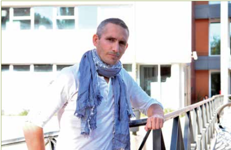
El escritor de Sanse, un ‘outsider’ de la creación literaria, delante de la Biblioteca Central.