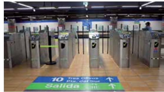
Transbordo del Metro en Tres Molinos.