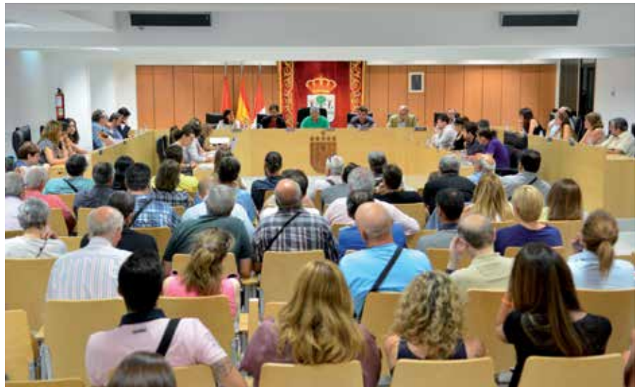
Vista de la Sala de Plenos del Ayuntamiento.

La instalación en diferentes puntos del municipio de contenedores dedicados específicamente a la recogida de aceites domésticos usados, el compromiso de aumentar el control sobre la limpieza que