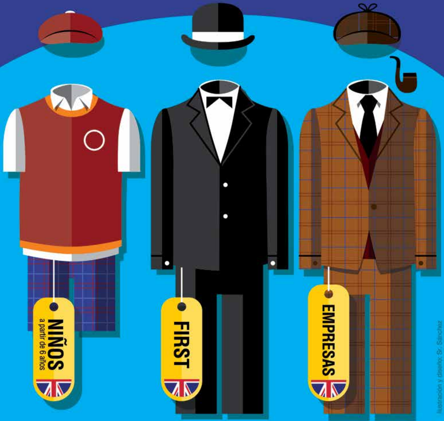
Ilustración y diseño: Sr. Sánchez

Clases para adultos ONE TO ONE y Skype · COACHING Clases en empresas · Preparación de exámenes de Cambridge y TOEFL Cursos Intensivos · Clases particulares · Cursos de negocios