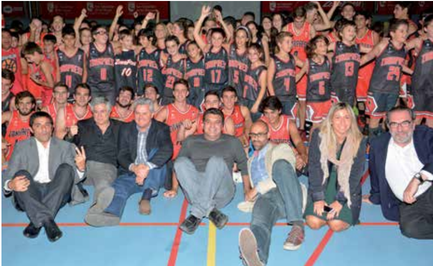
El alcalde (tercero por la izquierda), el concejal de Deportes (centro), otros concejales de la Corporación municipal y los representantes del club de baloncesto, en una foto de familia con los equipos del club.

E l Club de Baloncesto Zona Press inauguró de manera oficial el inicio de la temporada 2015/16 en el Polideportivo Dehesa Boyal, la tarde del 23 de octubre. El evento, que