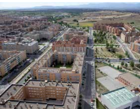
Vista aérea de Dehesa Vieja.

Según se aprobó en una Declaración Institucional, apoyada por todos los grupos políticos de la Corporación, en el Pleno del pasado 18 de septiembre, el Ayuntamiento estima imprescindible la reordenación y reorganización de los servicios de Atención Primaria en nuestra ciudad, atendiendo a las necesidades de salud de los vecinos de cada zona.