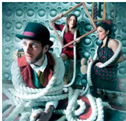
'EnTredos' fusiona el teatro gestual, el circo, la danza y la manipulación de objetos.

Flash! es una producción de Dantzaz Konpainia que aúna tres piezas magistrales de los coreógrafos Itzik Galili y Jacek Przybyłowicz en