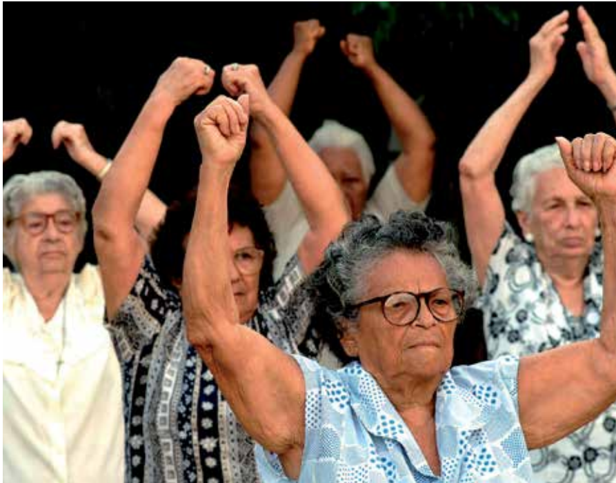
Nuestros mayores tienen a su disposición un extenso programa de actividades en el mes de noviembre.