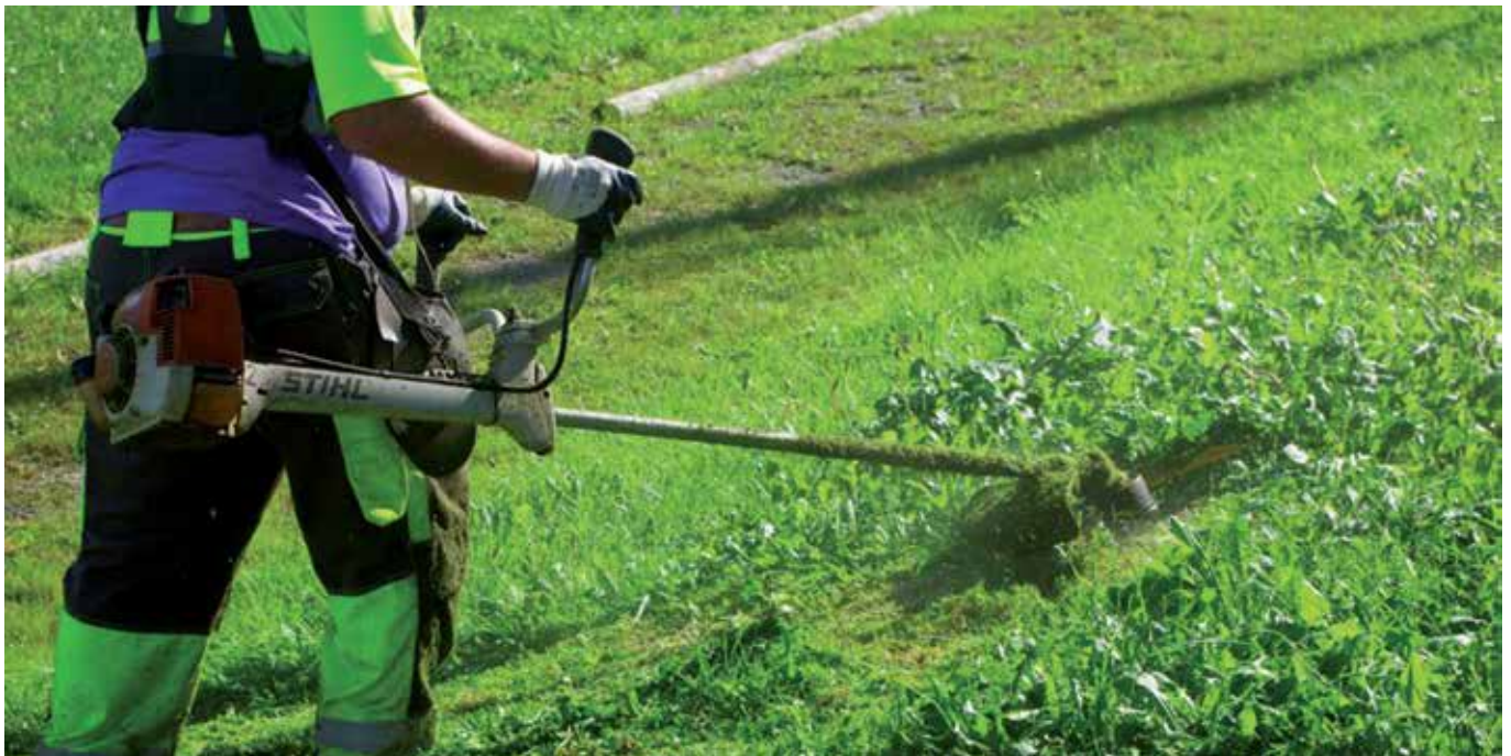
Para los futuros trabajos en las zonas verdes se usarán medios mecánicos y tradicionales que sustituirán a los productos químicos.

El Ayuntamiento ha desterrado el uso de herbicidas químicos para el mantenimiento de las zonas verdes de la ciudad. La decisión cumple con una declaración institucional aprobada por unanimidad en el Pleno Municipal y afecta a cerca de dos millones de metros cuadrados de zonas verdes y a unos 15.000 árboles urbanos.