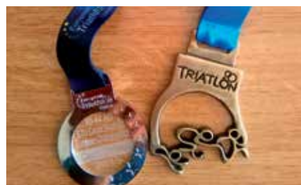
La ciclista de Sanse ha cosechado dos importantes medallas para el deporte de nuestra ciudad.

y Subcampeonato de Europa. En palabras de la sansera, "subir al pódium fue increíble, cuando dijeron mi nombre me sentí muy orgullosa de lo que había hecho, del esfuerzo recompensado, de estar lejos de casa alzando los colores de San Sebastián de los Reyes con gran honor". La ciclista de Sanse agradeció a su familia el apoyo, y sus amigos, con los que entrena y le ayudan en todo, y por los que gracias a ellos, confesó, "estoy aquí, en lo más alto".