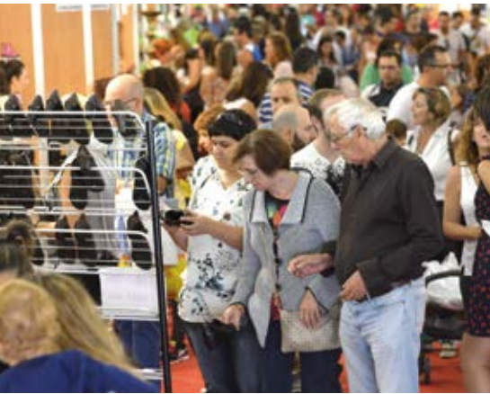
▲ La última edición de 'Sansestock' sigue sumando.

'Sansestock 2016' ha batido el récord de asistencia con 27.380 visitantes de más de 30 poblaciones.