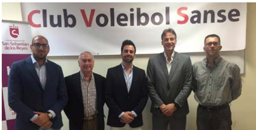
▲ El histórico jugador de voley y actual candidato a la presidencia, con responsables técnicos y directivos del club.