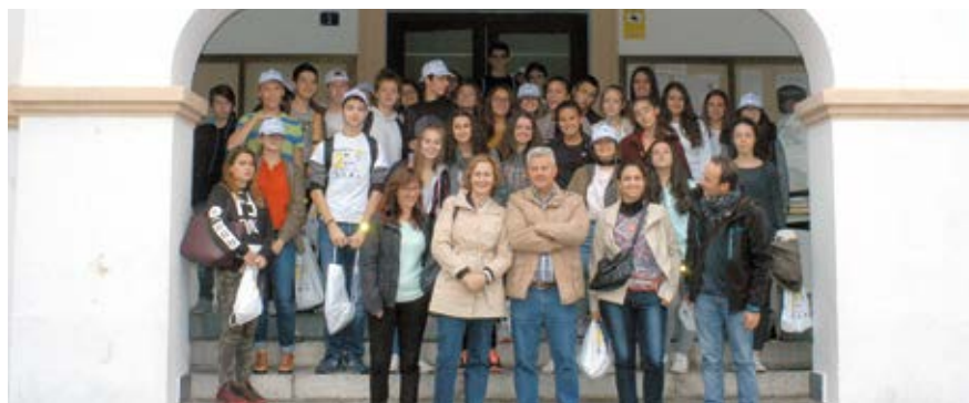
▲ Los alumnos y profesores en la puerta del Consistorio con el alcalde y la concejala de Educación.

Los alumnos del Instituto francés visitaron algunas de las dependencias del Consistorio y recibieron diferentes regalos.