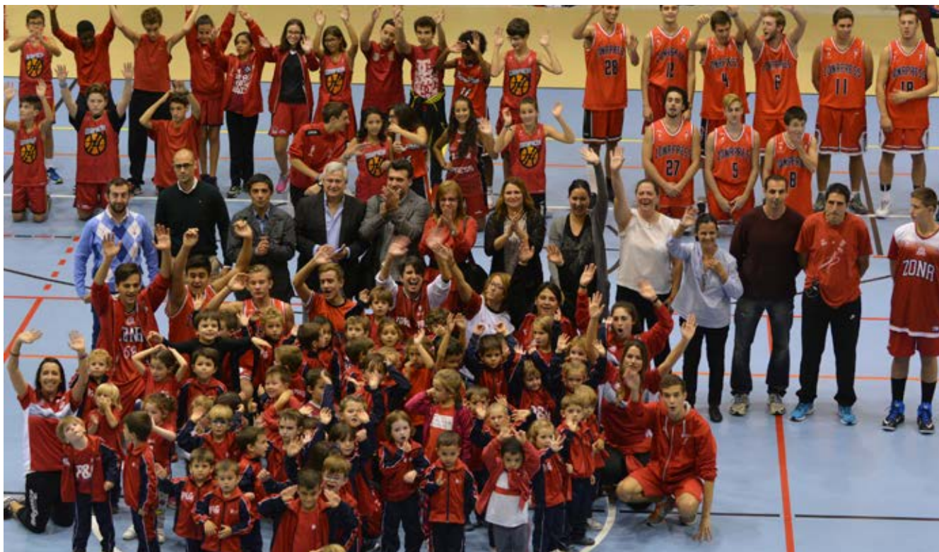
▲ El concejal de Deportes, el presidente del club y otros representantes municipales se fundieron con los componentes de las escuelas en un club donde la formación es lo más importante.

E l viernes 21 de octubre se desarrolló el acto de presentación de la Temporada de Plata (25º Aniversario) del Club Baloncesto Zona Press.