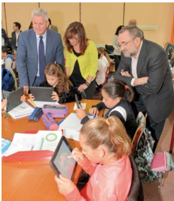
▲ El alcalde, la concejala de Educación y el concejal de Hacienda, en la presentación.

El Ayuntamiento, en particular la Delegación de Educación, ha puesto en marcha el proyecto de innovación educativa 'Sansetablets'. El Consistorio cederá a diversos colegios de la ciudad 46 tablets de altas prestaciones por periodos sucesivos de un mes. En este programa, que se ha confeccionado en colaboración con los docentes, participan los 13 colegios públicos que lo han solicitado.