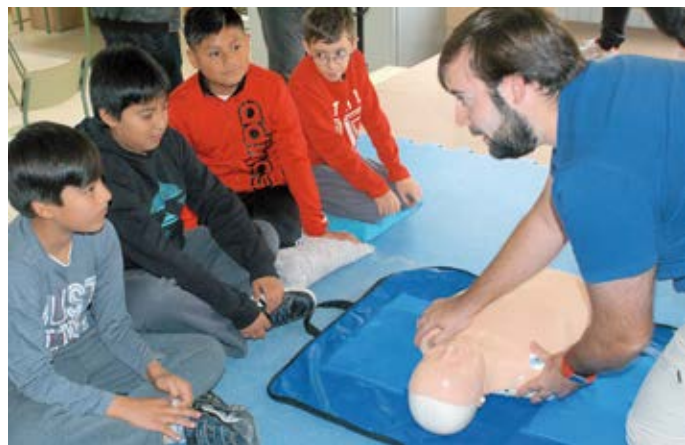
▲ Momento de la actividad con los alumnos del centro escolar.

El Día europeo de concienciación ante el paro cardíaco, que se celebra el 16 de octubre, tiene como objetivo aumentar la probabilidad de supervivencia de la persona afectada. "Es una magnífica oportunidad de mostrarle al mundo que incluso un niño de 10 u 11 años puede salvarle la vida a una persona adulta en el momento adecuado y actuando en la for-