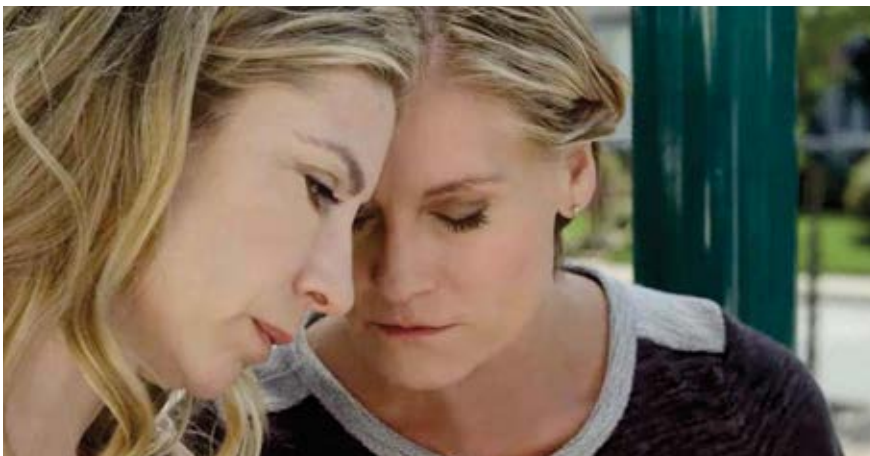
▲ Stuff, comedia dramática sobre un matrimonio de lesbianas, el miércoles 9 a las 20:00 h.

Nuestra ciudad será del 7 al 12 de noviembre una de las sedes oficiales del 'LesGaiCineMad', el festival madrileño de cine lésbico, gay, bisexual y transexual, LGBT, más importante de habla hispana que se celebrará en el Centro Municipal de Formación Ocupacional. En esta vigésimo primera edición reafirma su compromiso de dar visibilidad a las producciones cinematográficas internacionales que muestran la diversidad sexual.