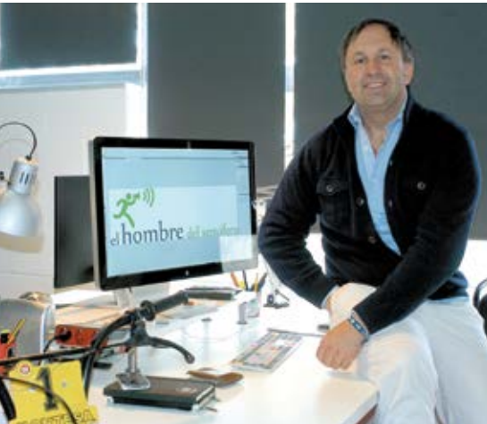
▲ Este exitoso plan está orientado a emprendedores.

El Ayuntamiento, a través de la Concejalía de Desarrollo Local, pone en marcha la tercera edición del 'Espacio emprendedor', una preincubadora de proyectos empresariales en la que los usuarios cuentan con un espacio de 'coworking', tutorías y formación presencial muy práctica y orientada a convertir sus ideas en un modelo de negocio viable.