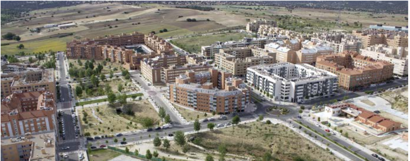
▲ Vista aérea de Debesa Vieja, que se beneficiará, como el resto de nuestra ciudad, de la congelación del IBI, entre otros impuestos.