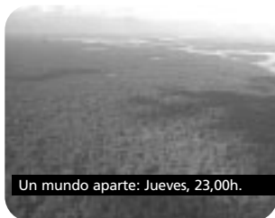
Un mundo aparte: Jueves, 23,00h.