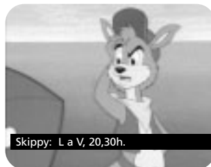
Skippy: L a V, 20,30h.