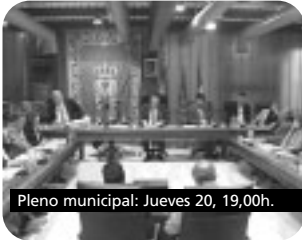
Pleno municipal: Jueves 20, 19,00h.

13,30 MI PEQUEÑO PONY 13,40 DENVER, EL ÚLTIMO DINOSAURIO 14,00 VOLTRON 14,20 LA COCINA DE P. SUBIJANA 14,30 LOS PINCHEIRA 16,00 FIESTAS POPULARES 16,30 CÁDIZ - LA HABANA II 17,00 LUSOFONIA 17,30 REFUGIADOS ¿HASTA CUÁNDO? 18,30 BASKONIA AMERICANA 19,00 EL CLUB DE LAS IDEAS 20,00 HOY SALIMOS EN LA TELE 20,20 ROBOTIX 20,50 VOLTRON 21,15 LA COCINA DE P. SUBIJANA 21,30 MISIÓN SOS. 22,00 HOY SALIMOS EN LA TELE 22,35 Cine: SECRETÍSMO 00,05 HOY SALIMOS EN LA TELE