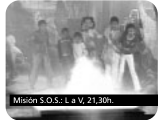
Misión S.O.S.: L a V, 21,30h.