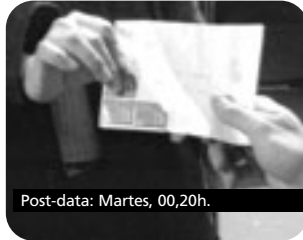
Post-data: Martes, 00,20h.