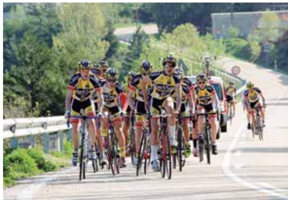
El Sanse Spiuk Trek ha conseguido un hito histórico.

La UCSS Reyes, que trabaja su cantera desde hace casi 40 años, ha conseguido una gran recompensa y un hito histórico al ser invitado para disputar como equipo en una prueba mundial de referencia en el ámbito Junior, como es la Piccola San Remo, la hermana pequeña de la Milán-San Remo, una de las