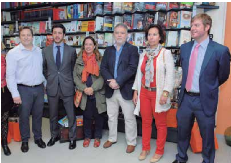
la XXXI Semana del Libro ha estado llena de actividades para todas las vecinas y vecinos. A la derecha, los responsables municipales en una de las librerías participantes.

El alcalde, Manuel Ángel Fernández, acompañado de la concejal de Cultura, Mar Escudero, y del concejal de Desarrollo Local, Ismael García,