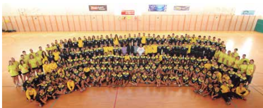
El club de Balonmano está desarrollando una buena labor de formación.

Balonmano Sanse, tal como se le conoce popularmente, está desarrollando una gran labor. En los últimos años su crecimiento ha sido espectacular, hasta tener en la actualidad cerca de 1.000 usuarios al año en todos los programas: Predeportiva (105), Deporte en la Escuela (285), Tecnificación (240), Padres y Madres (46) y Campus de Verano (300). Todo este esfuerzo está dando magníficos resultados, como lo demuestra el último campeonato de Madrid, ganado por los Cadetes femeninos y masculinos.