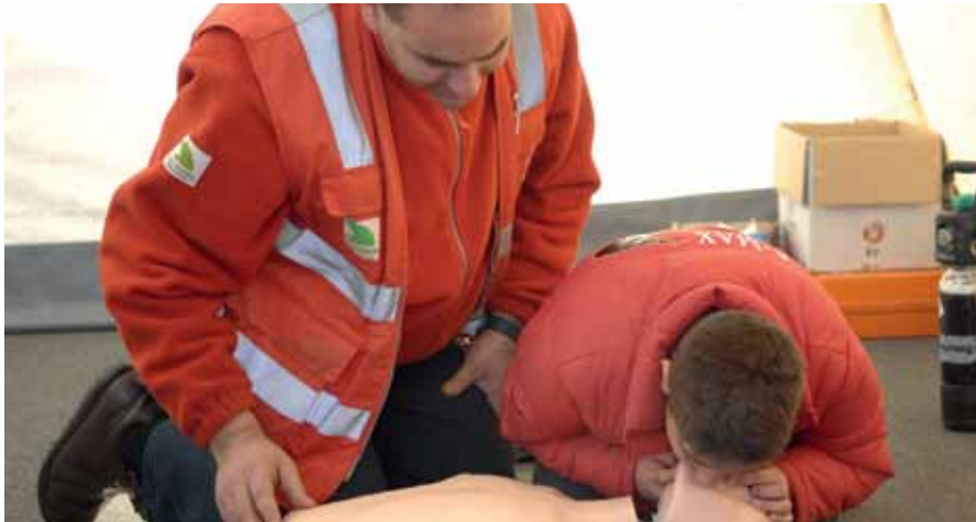
Uno de los cursos que se imparten es Primeros Auxilios

E l Ayuntamiento, a través de la Concejalía de Participación Ciudadana, ha organizado diversos cursos dirigidos a miembros de las asociaciones locales para el primer semestre de 2011. El programa es el siguiente: