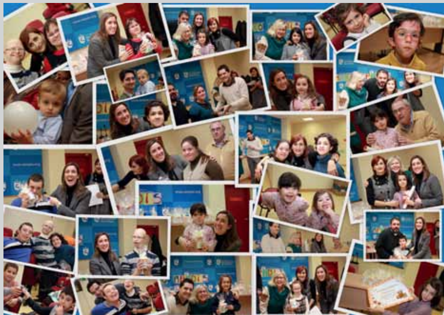
Sobre estas líneas, los participantes del Concurso de dibujo organizado por Asempro.

Todos los participantes recibieron como regalo una taza con su dibujo. El ganador de cada categoría, además recibió un diploma y un lote de libros donados por Editorial Casals. ●●●