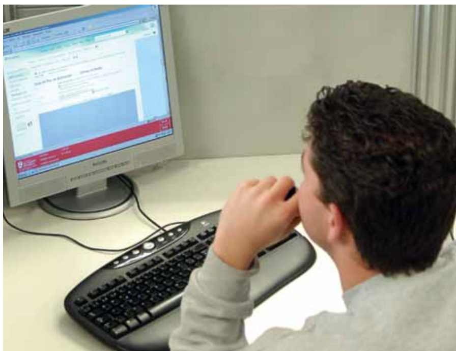
El Aula dispone de diez puestos de Ofimática totalmente gratuitos.

E l Aula CiberActúa es un espacio que ofrece el Ayuntamiento, a través de la Delegación de Participación Ciudadana, orientado a facilitar recursos a las asociaciones y a las personas que trabajan en ellas, de forma voluntaria o remunerada.