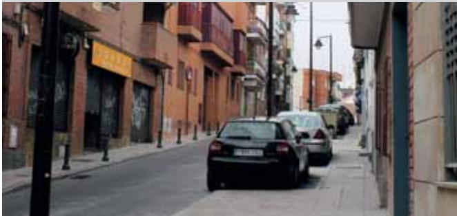
Tal como ha quedado ahora.