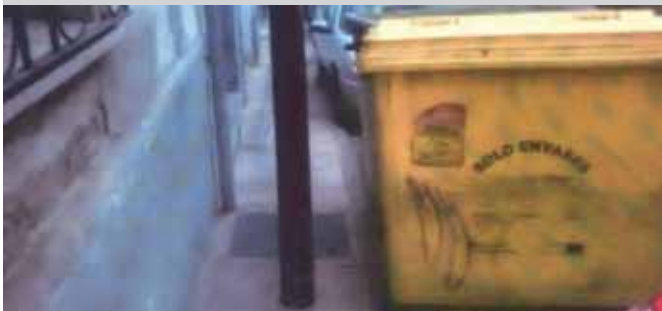
Antes de las obras realizadas.

L a acera de la calle San Vicente, entre los números 8 y 14, ha sido ampliada y mejorada tras reiteradas peticiones vecinales. Entre las obras realizadas, está el retranqueo de las farolas de iluminación pública, que en una acera muy estrecha impedían el paso de peatones, y la renovación de las conducciones de alcantarillado. Estas intervenciones, además, se han realizado dejando márgenes suficientes para que los vehículos puedan estacionarse en este tramo de la vía. ●●●