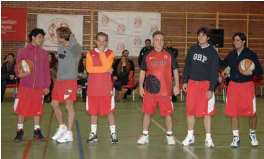
Equipo de los toreros, con el alcalde.