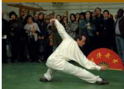
Exhibición de Danza Oriental.