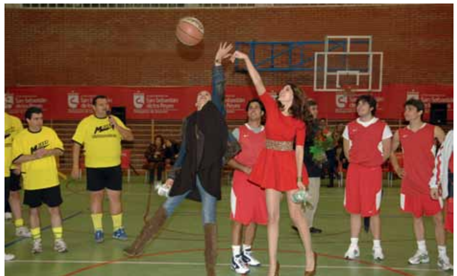
Saque de honor a cargo de Silvia Jato y la actriz Elena Ballesteros.