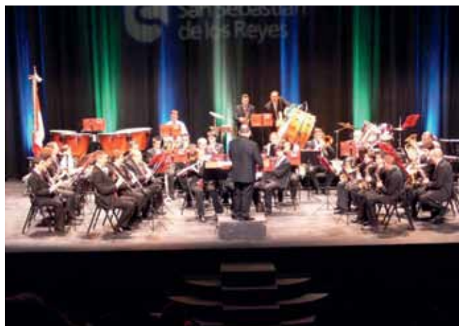
Concierto por el "X Aniversario de la Banda de San Sebastián de los Reyes", el día 23, a las 12.30 h. en el TAM.