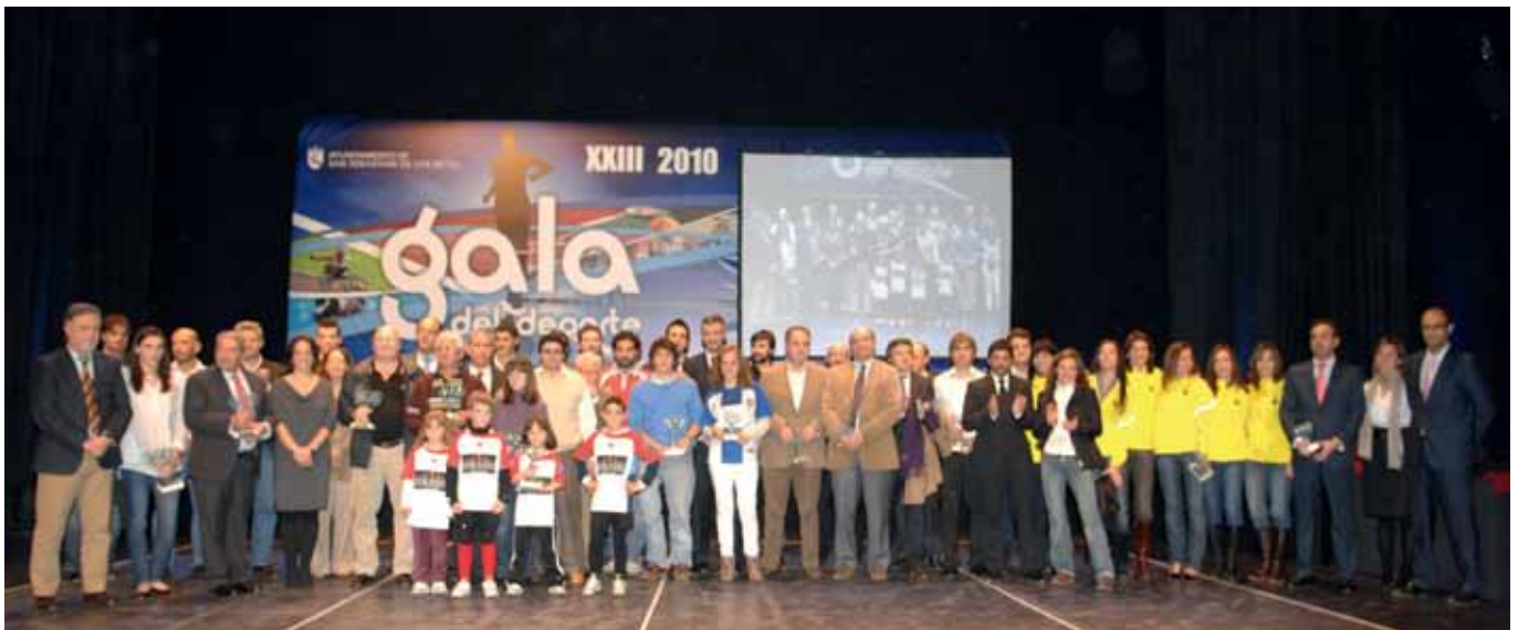
Foto de familia de los premiados.