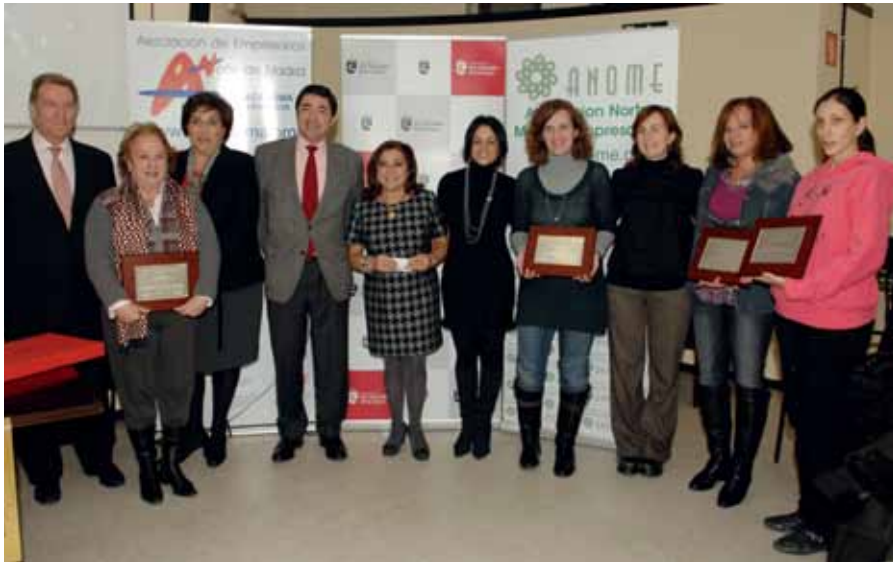
Los premiados posan con los representantes de las entidades organizadoras de este certamen.

E l Ayuntamiento, la Asociación de Empresarios de la Zona Norte de Madrid (ACENOMA), la Cámara de Comercio de Madrid y la Asociación Norte de Mujeres Empresarias (ANOME), en colaboración con la Comunidad de Madrid, han entregado los premios a los mejores escaparates, una iniciativa que se encuadra en la Campaña de Dinamización del Comercio Urbano en Navidad. Han sido 16 los comercios nominados y cuatro los finalmente galardonados. Cada uno de los ganadores recibe una placa conmemorativa personalizada. El Ayuntamiento ha premiado a 'Calzados Capri', ACENOMA a 'Reino de Bután', la Cámara de Comercio entregó su placa a 'Centro Artesano' y ANOME a 'Ellas y ellos'. Entre todos los nominados se ha sorteado, además, un bono de hotel de 300 euros. ●●●