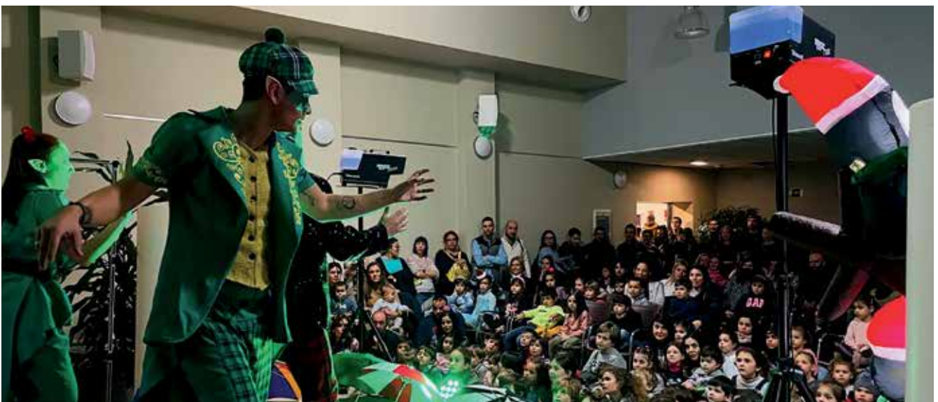
▲ Actuación infantil en la urbanización Club de Campo.