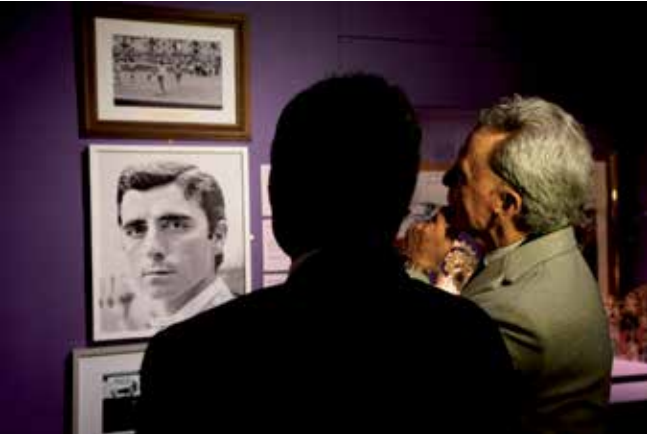
▲ El nuevo Espacio Taurino también rinde homenaje al maestro José Ortega Cano.