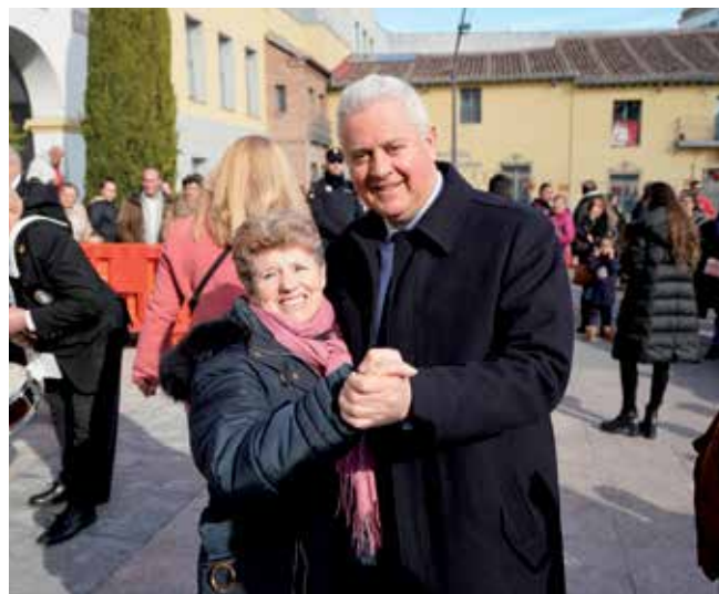
▲ El alcalde de la ciudad en el tradicional baile popular de San Sebastián.