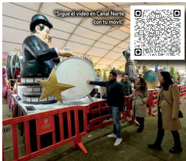
▲ Las carrozas visitables, en la carpa municipal.