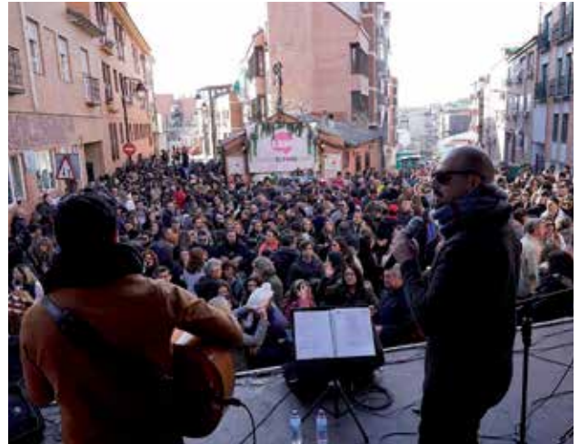
▲ Actuación del grupo musical Adúo durante la "Tardevieja".