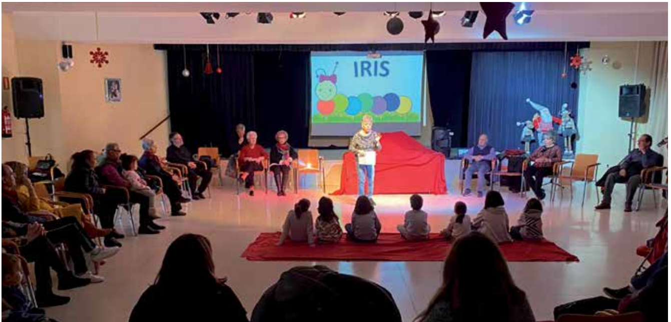
▲ Actividad para mayores y nietos en el Centro Gloria Fuertes.