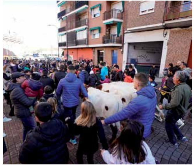
▲ La Trasmancia Infantil por las calles de la ciudad.