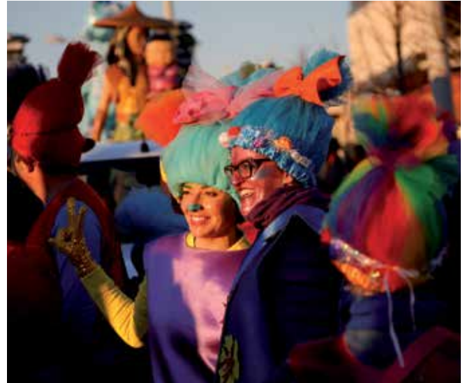
▲ La Cabalgata hizo disfrutar, como si fueran niños, también a los mayores.