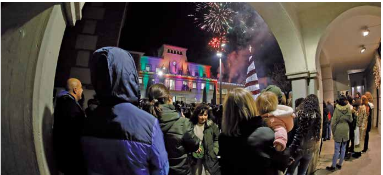
▲ El espectáculo de los fuegos artificiales puso el broche de oro a la Cabalgata en la noche más mágica del año.