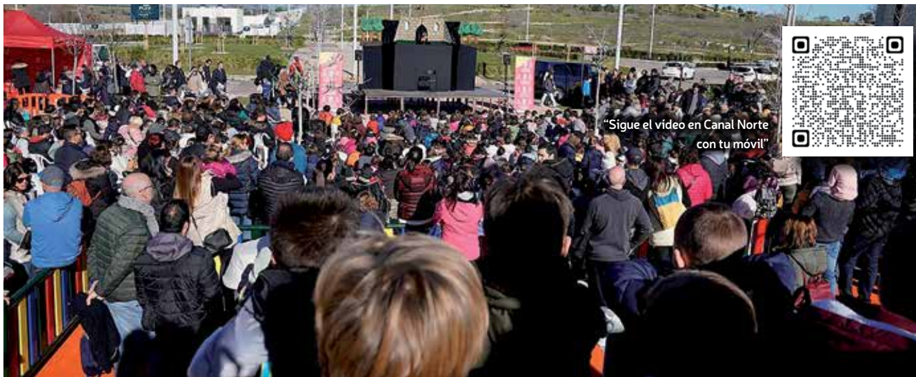
▲ Llenazo en el espectáculo infantil en el barrio de Tempranales.