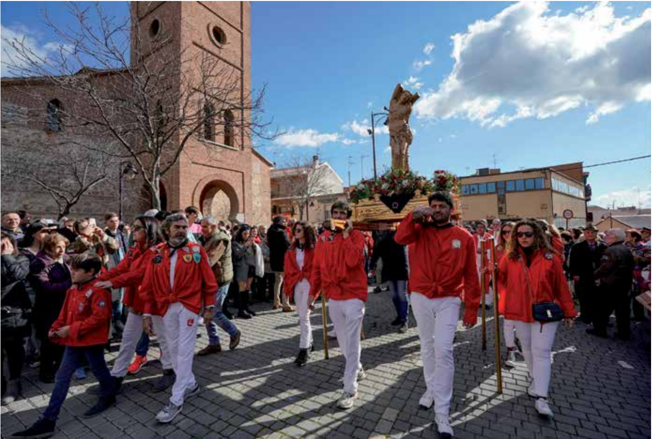
▲ La procesión de San Sebastián Mártir, a la salida de la iglesia.