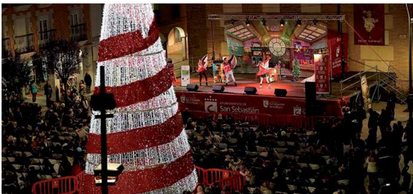
▲ Volver a EGB hizo disfrutar a todas las familias.