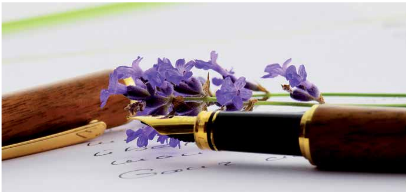
▲ El fallo del jurado del Certamen de Cartas de Amor se dará a conocer el día 16 de febrero en una gala especial que se celebrará en el Salón de Actos del Centro Gloria Fuertes, de 17 a 19 horas.

Al extenso programa de actividades del Centro de Mayores Gloria Fuertes se suman las celebraciones de San Valentín y de Carnaval con bailes, certamen de cartas de amor, música en directo, teatro y mucha creatividad para demostrar que la edad no es un límite.