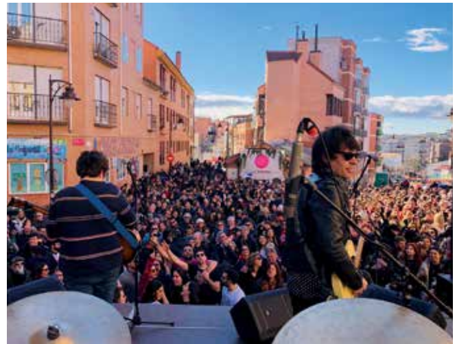
▲ El grupo Los inspectores fue la gran apuesta musical de la programación.