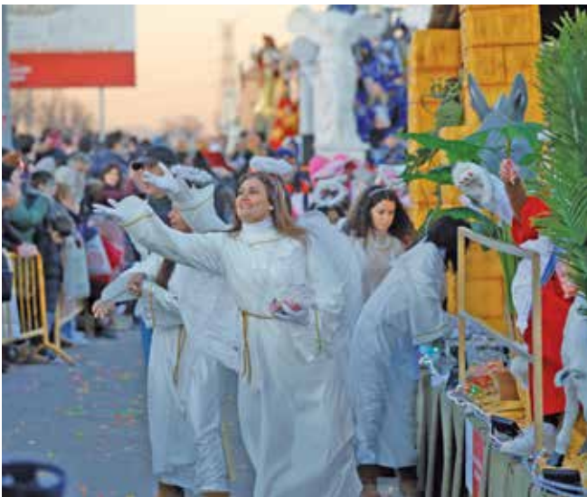
▲ El pasacalles de la Cabalgata repartió 4.000 kilos de caramelos.