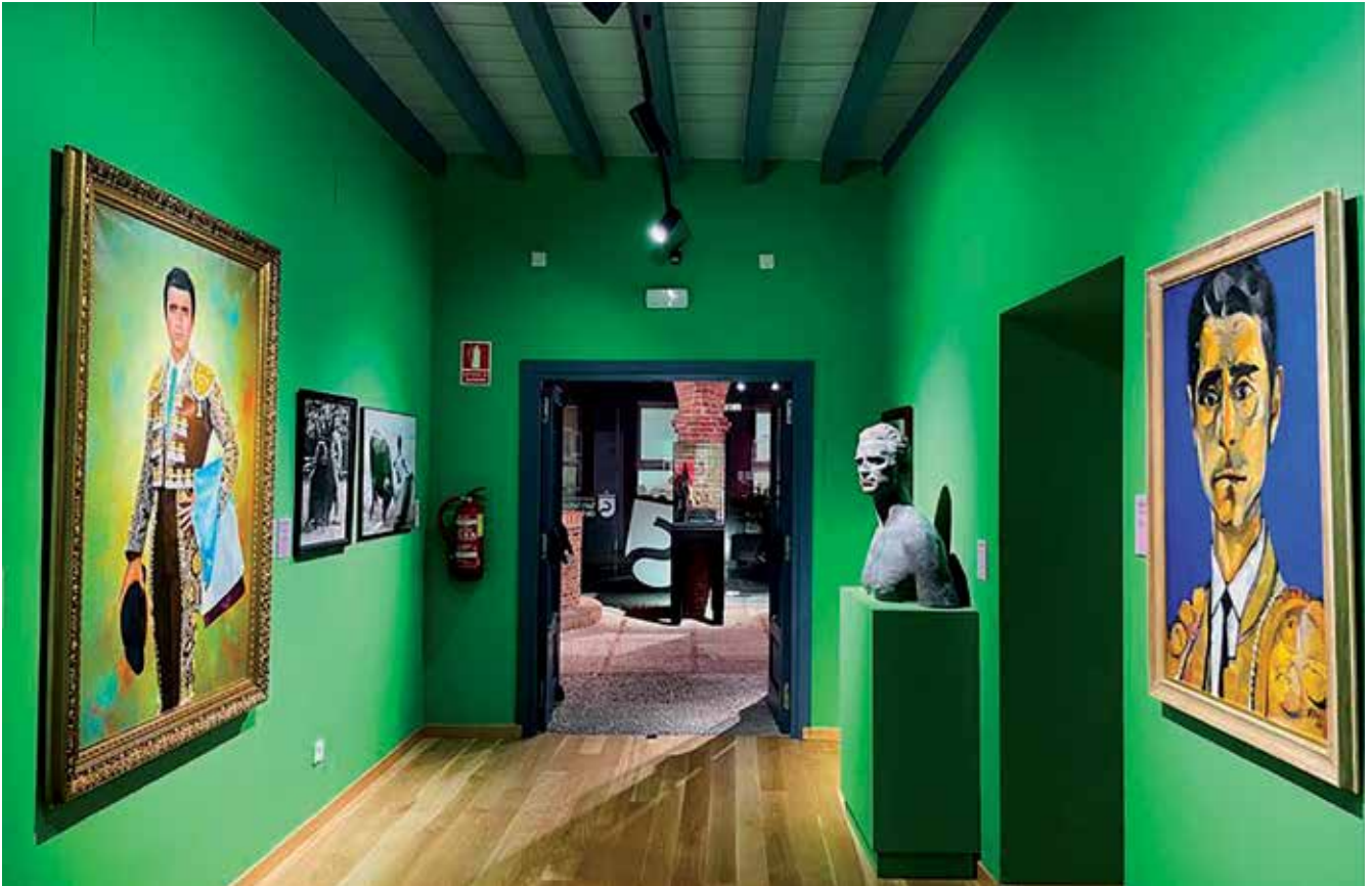
▲ El Espacio Taurino alberga trajes de luces, carteles de corridas míticas, fotos y trofeos del maestro.