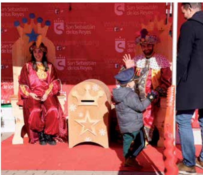
▲ Los Carteros Reales recogiendo cartas en el barrio de Tempranales.