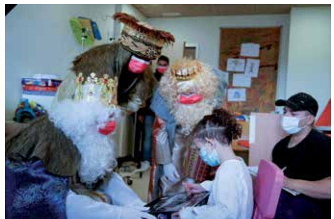
▲ Los Reyes Magos en su visita al Hospital Infanta Sofía.