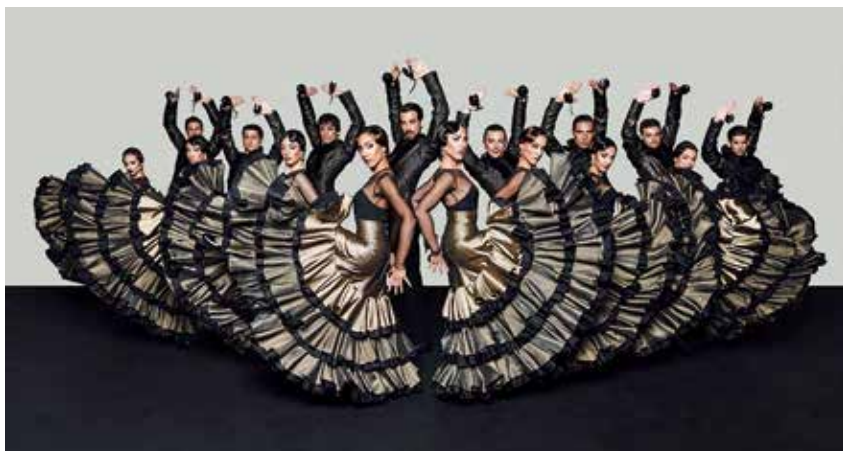
▲ “Querencia” presenta un viaje a través de la Escuela Bolera, la Danza Estilizada, la Danza Tradicional y el Flamenco.

La música envuelve de manera muy especial el montaje, pues Najarro ha encargado componer una música original para orquesta sinfónica. Este es otro de los grandes retos de ‘Querencia’, dotar al repertorio de composiciones musicales que llenen el vacío que existe en la actualidad para creadores de danza española. ■