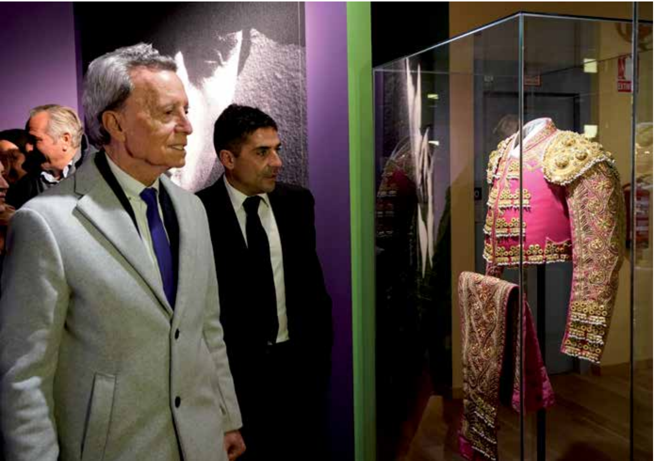
▲ El Museo Etnográfico albergará una colección permanente donada por el torero a una ciudad a la que siempre ha estado muy unido.