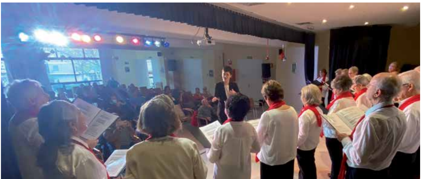
▲ Actuación de la Coral de Sanse en el Centro de Mayores.