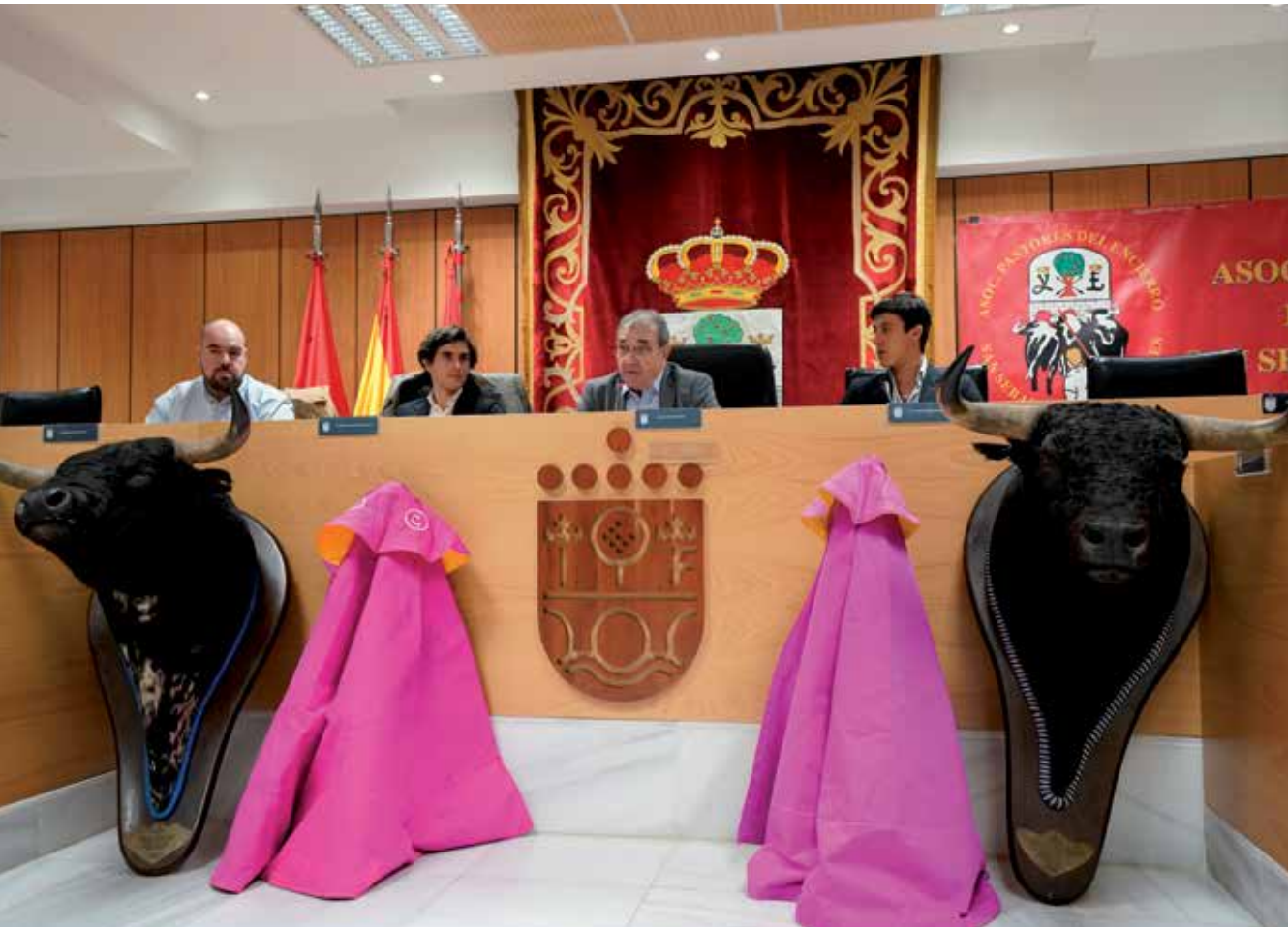
▲ Charla-coloquio "Savia nueva del toreo", en el Salón de Plenos.