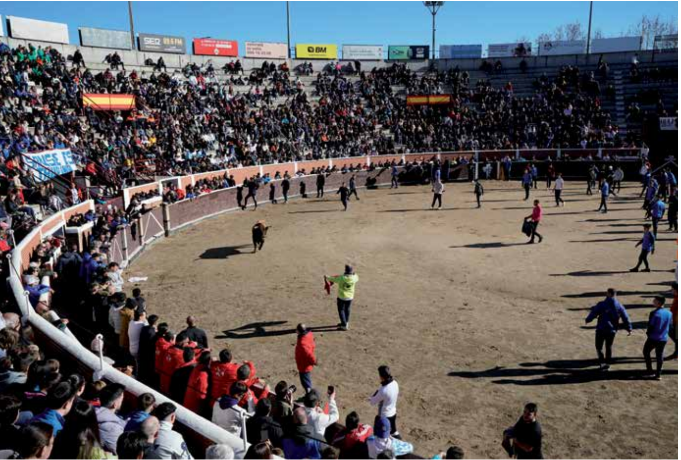
▲ Durante la capea solidaria se recogieron alimentos no perecederos para la despensa municipal.