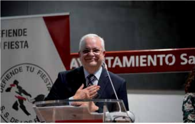
▲ El periodista Miguel Ángel Moncboli, premiado en la V Gala del Toro.