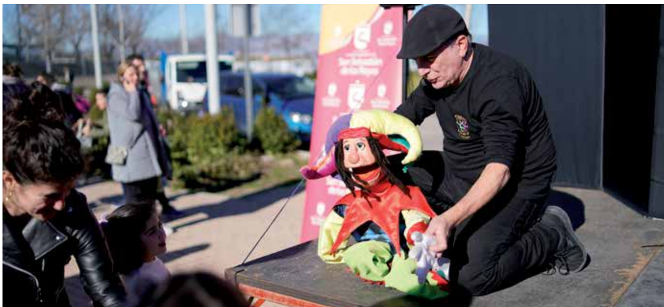
▲ Los espectáculos infantiles llegaron a todos los barrios de la ciudad.