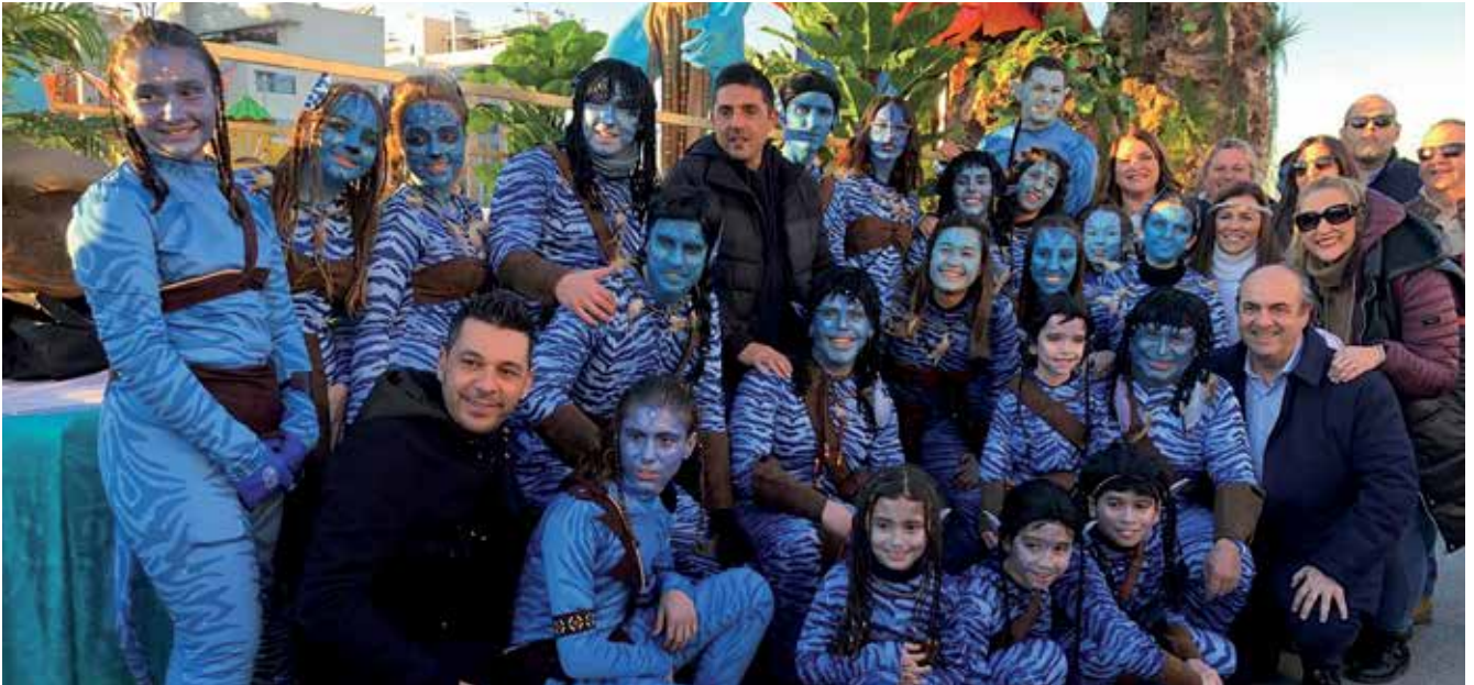
▲ 25 entidades sociales apoyaron el viaje de los Reyes Magos.