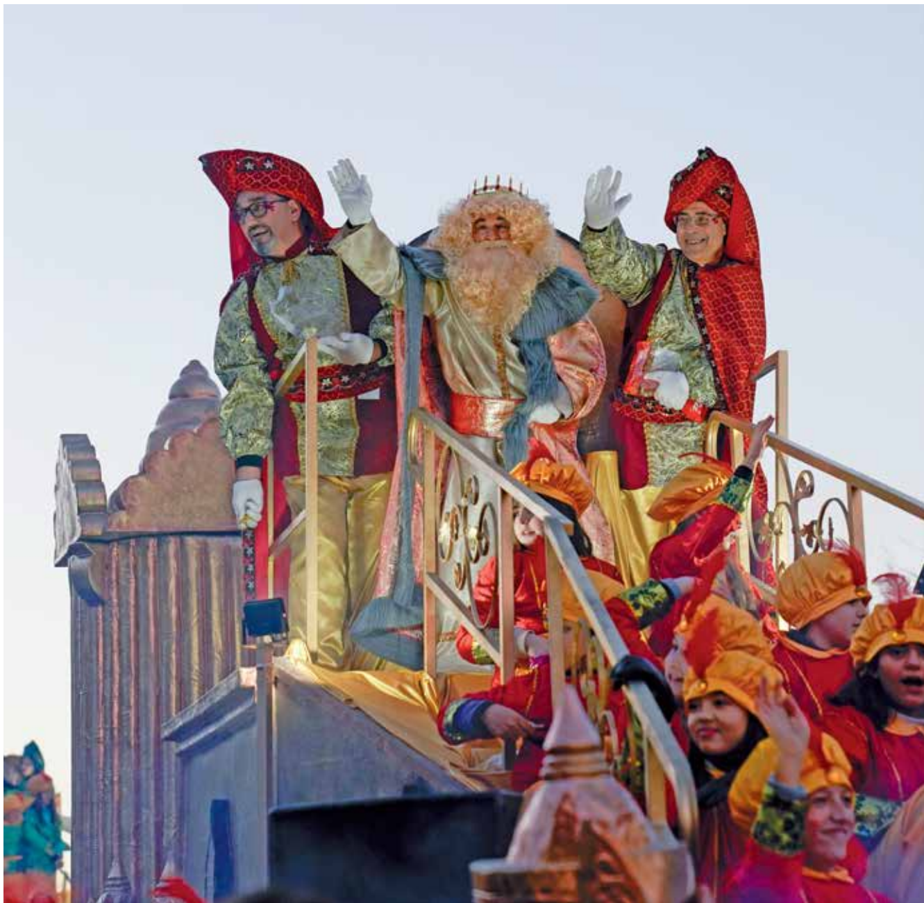
▲ Las 15 carrozas de la Cabalgata partieron del barrio de Tempranales.