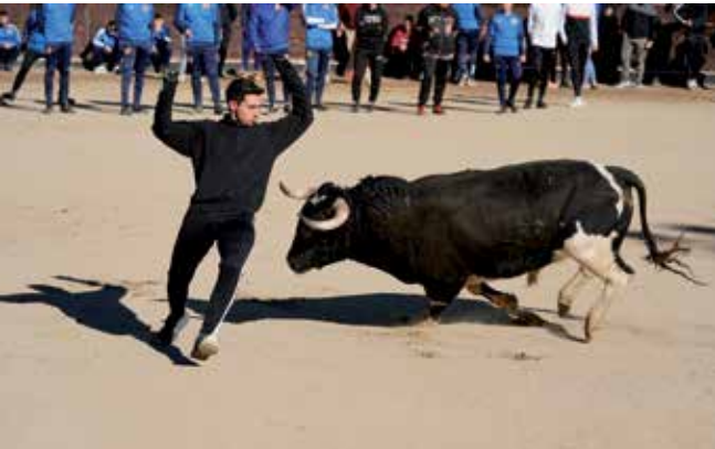
▲ Las clases prácticas de recortes corrió a cargo de la Peña Postas.