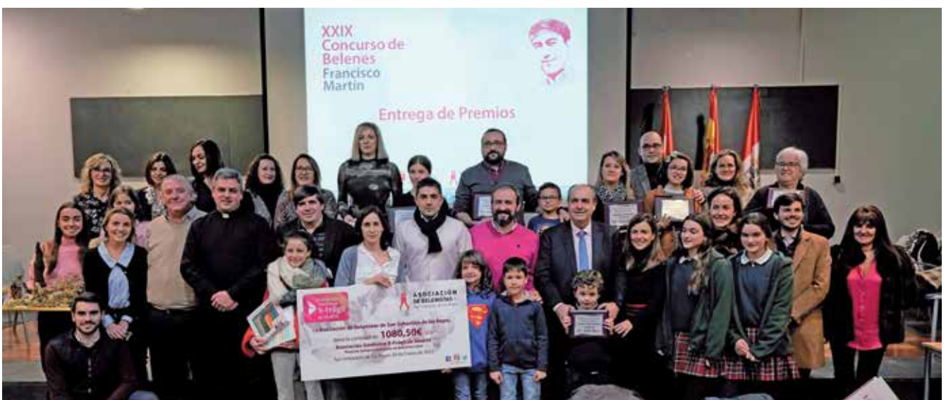
▲ Todos los galardonados en el XXIX Concurso de Belenes.