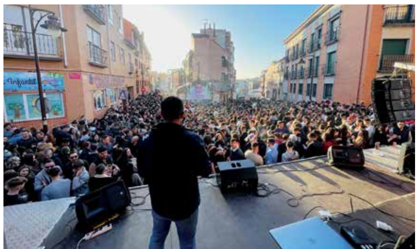
▲ El tardeo llenó las calles del casco antiguo de Sanse.