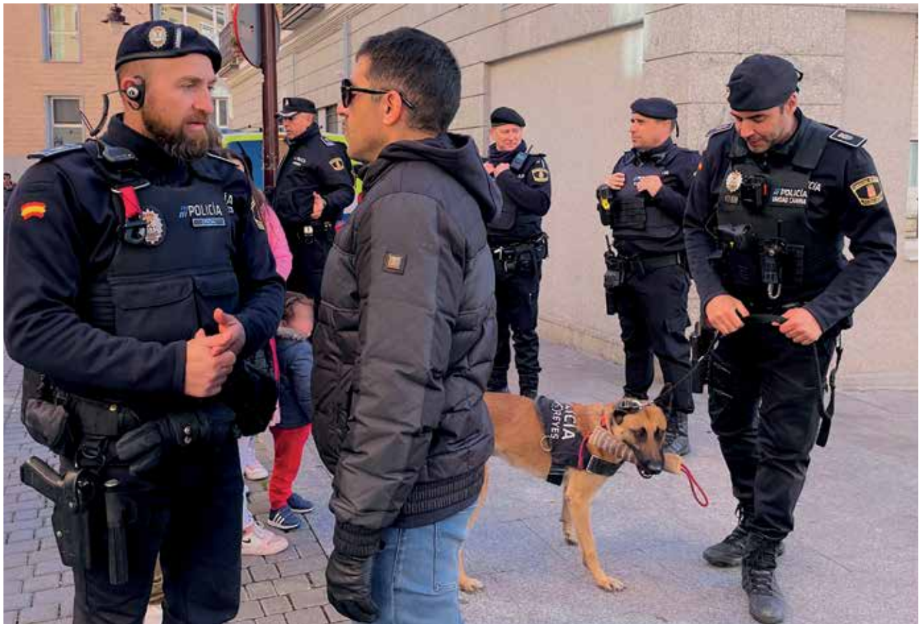
▲ La Policía Local y la Unidad Canina, siempre presente en todos los eventos de las fiestas.