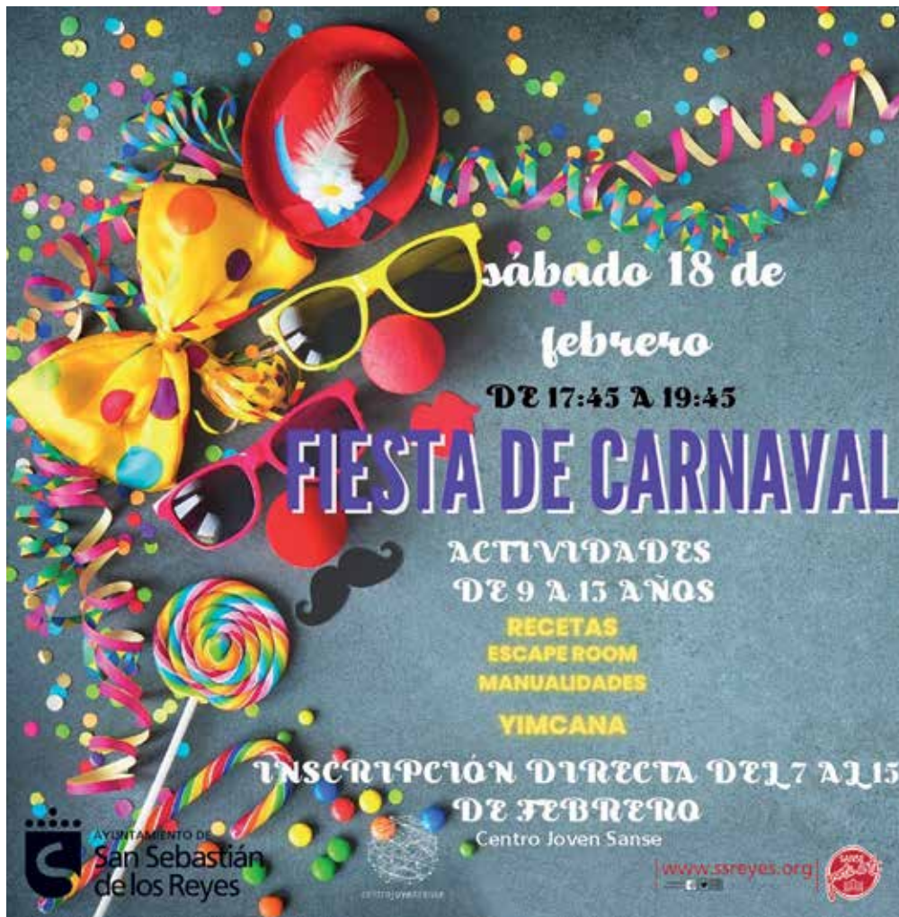
▲ El carnaval es historia y tradición, una festividad para divertirse y también aprender.

Llega el Carnaval, y los niños y niñas de la ciudad tienen un programa festivo adaptado a cada grupo de edad. Todas las actividades requieren inscripción previa, del 7 al 15 de febrero.