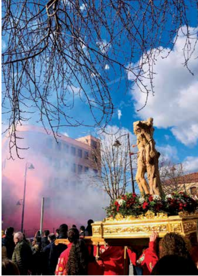
▲ Momento de fervor y pólvora a la llegada del Patrón.