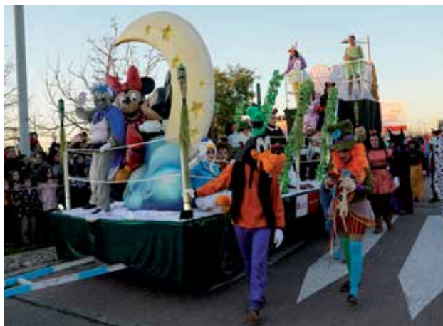
▲ La cabalgata contó con 15 carrozas llenas de color y personajes conocidos.