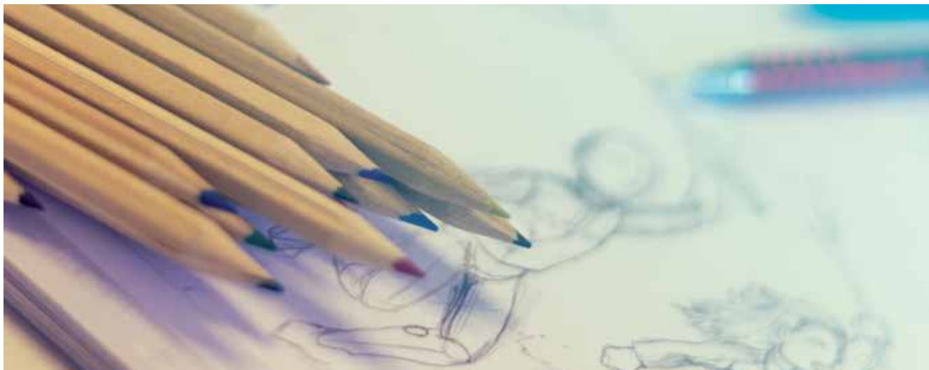
▲ Los proyectos presentados en esta VII Edición han sido 15, con una participación de siete colegios, dos Institutos y el Centro de Educación Permanente de Adultos (CEPA).

El Ayuntamiento, a través de la Delegación de Educación, organiza la VII Edición de los Premios Locales de Innovación Educativa y Buenas Prácticas, una iniciativa anual con la que se premia el esfuerzo de la comunidad educativa por fomentar la mejora del proceso de enseñanza-aprendizaje.