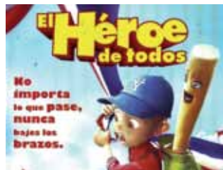
Cine infantil el día 29 en el Centro Joven.