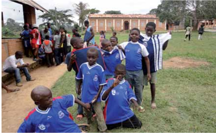
Una de las actividades que los niños africanos no conocían era el voleibol. A la derecha, equipo de amigos con las camisetas cedidas por el Juventud Sanse.