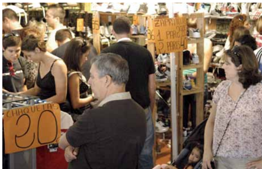
Este año han acudido a la feria 6.000 personas más que el año pasado, lo que confirma a Sansesstock como la feria referente del comercio urbano de la Comunidad de Madrid.