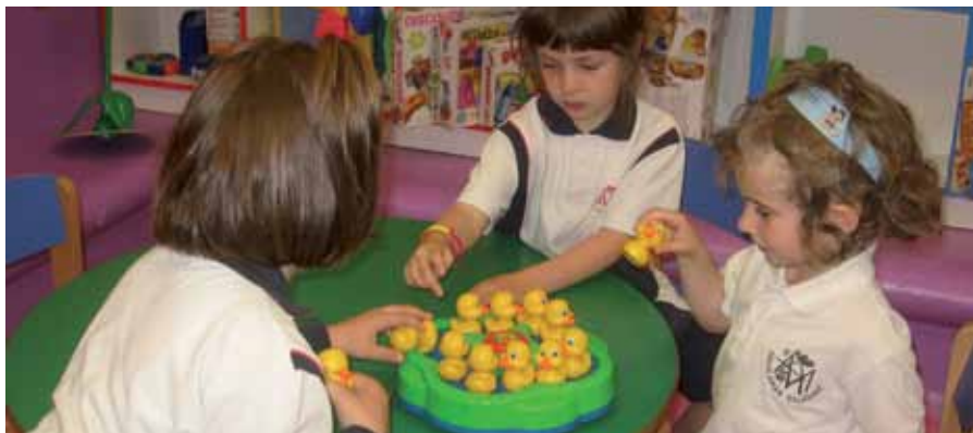
El Ayuntamiento, continuando con su política de facilitar la conciliación laboral y familiar, integrada en el marco del III Plan de Igualdad, ha abierto este espacio para los hijos de los asistentes a los talleres de esta Concejalía.

Para que las obligaciones maternas o paternas no dificulten la participación en las actividades de la Concejalía de Igualdad o utilicen sus servicios con mayor comodidad, la Delegación municipal ha inaugurado una ludoteca infantil en sus instalaciones, justo en el mismo lugar donde se imparten sus ciclos de formación, talleres o sus asesorías especializadas.