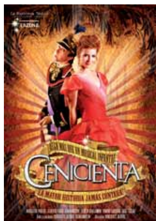
La Cenicienta es un espectáculo para todos los públicos, el domingo 16 a las 17 h. en Teatro Adolfo Marsillach.

Teatro - público familiar Domingo 16, a las 17.00 h Duración: 60 min. Precio: 6 euros adulto 4 euros infantil