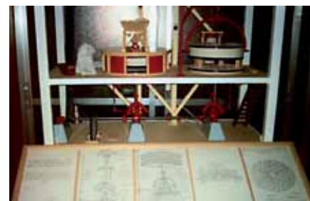
Replica en miniatura de un molino familiar que funciona y muele perfectamente.

deros, panaderos y multitud de familias. Creó una réplica exacta, en miniatura. Esta réplica funciona y muele a la perfección. En la construcción ha reproducido, pieza a pieza, con la paciencia y dedicación de un artesano, cada componente que conforma su mecánica y estructura. Han seguido al molino otras recreaciones, todas destinadas a completar una maqueta etnográfica, que en su conjunto, logra reflejar el modo de vida que hasta mediados de siglo XX estuvo vigente en San Sebastián de los Reyes, Alcobendas y en el resto del norte de la región.