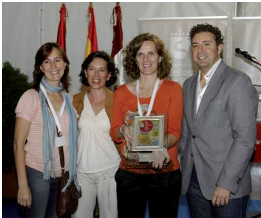
El concejal de Desarrollo Local entregó al premio al mejor "stand", del establecimiento 'El reino de Bután'.

Además, Sansestock 2011 virtual, ubicada en la página web del Ayuntamiento – ssreyes.org –