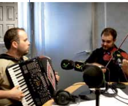
El grupo tradicional Barranto Bellota Band toca el día 21 a las 19 h. en El Caserón.