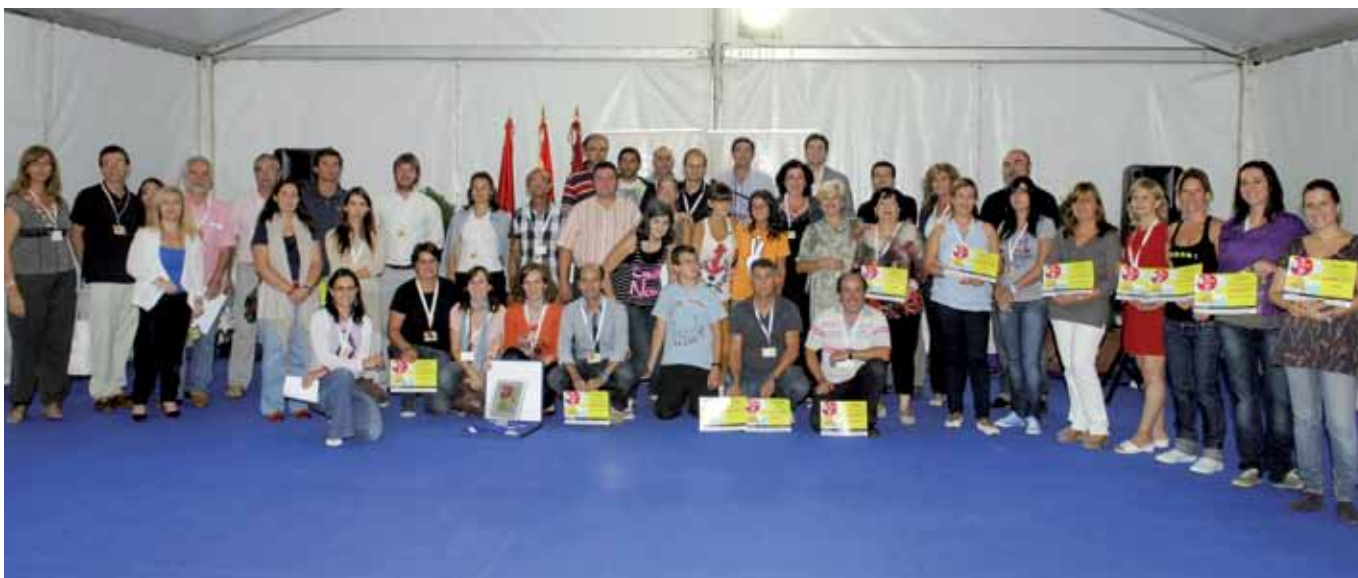
El Ayuntamiento ha entregado diplomas a los 62 stands que han participado en la presente edición de Sansestock.