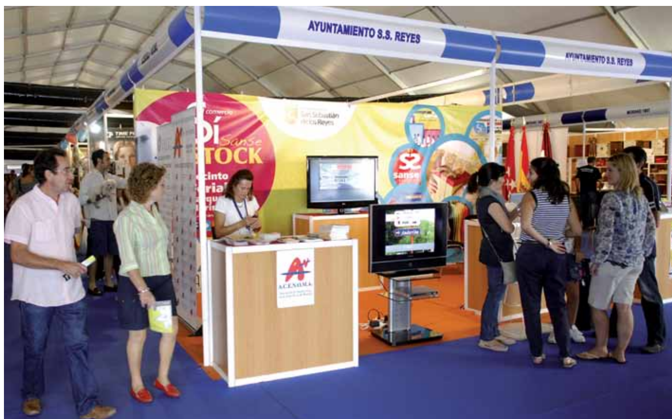
Vista del stand que ha preentado este año nuestro Ayuntamiento en Sansesstock. El stand municipal disponía de una pantalla y un ordenador portátil para familiarizarse con un recorrido virtual por la feria a través de sreyes.org y www.sansesempresa.es/ .

Un total de 25.300 personas visitaron la carpa instalada en el Recinto Ferial Parque de la Marina que acogía 'Sansesstock 2011', la feria del comercio minorista organizada por el Ayuntamiento, a través de la Concejalía de Desarrollo Local, con el patrocinio de la Comunidad de Madrid y de ACENOMA, y la colaboración de Limasa y ANOME.