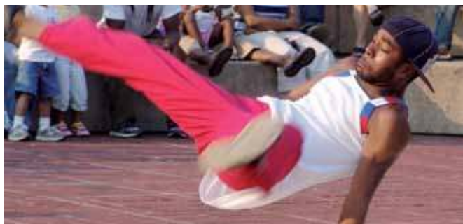
"Sanseurbano" se ha convertido en un referente. El viernes 25, en el Centro Joven.

25 de mayo, a las 21.00h Entrada: 5 euros.