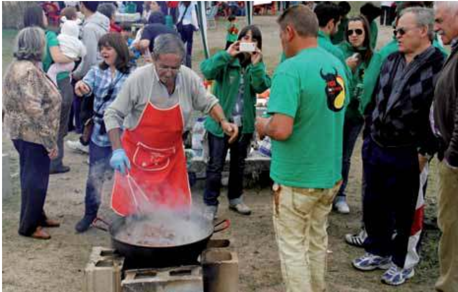
Los vecinos y vecinas que asistieron a este tradicional evento se lo pasaron en grande comiendo y disfrutando de los saberes culinarios que demostraron los participantes en el concurso de calderetas y migas.

La Dehesa Boyal se convirtió en un gran fogón para las decenas de asociaciones participantes en la multitudinaria 'Caldereta tradicional' que cada año organiza el Ayuntamiento dentro de los actos del 'Día 2 de mayo', que este año conmemoraba el 520º aniversario de la fundación del municipio por los Reyes Católicos.