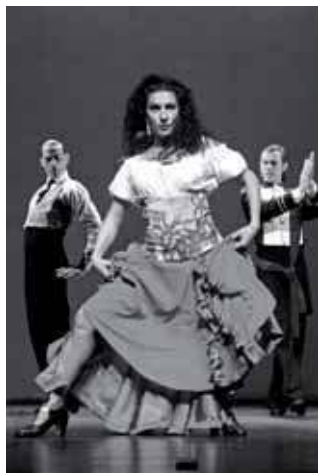
Homenaje a la danza española y el flamenco, el sábado 12 en el TAM.