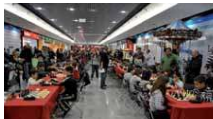
Los pasillos del Centro Comercial se llenaron de niños disputándose la victoria en el tablero.