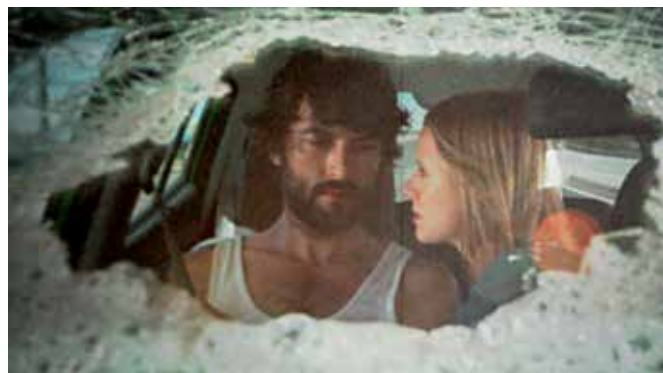
La tercera temporada de "Sanse, cortos en abierto", se desarrollará en el Pequeño Teatro del TAM, el 23 de mayo.