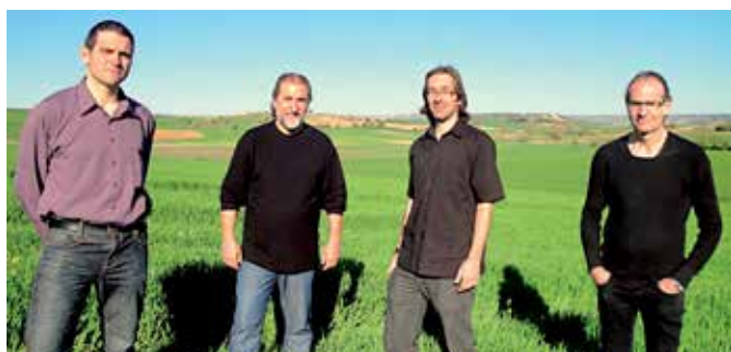
La Bazanca, grupo que trata de difundir la música tradicional de Castilla y León, actuará el viernes 16 de mayo en El Caserón.