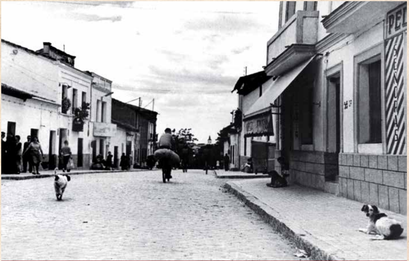
Desde la aprobación del primer callejero, en 1859, hasta un siglo después, no se producen casi variaciones significativas en el trazado urbanístico del municipio.