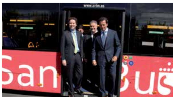
El alcalde (centro) sale de uno de los vehículos acompañado por los consejeros de Transporte y Medio Ambiente.