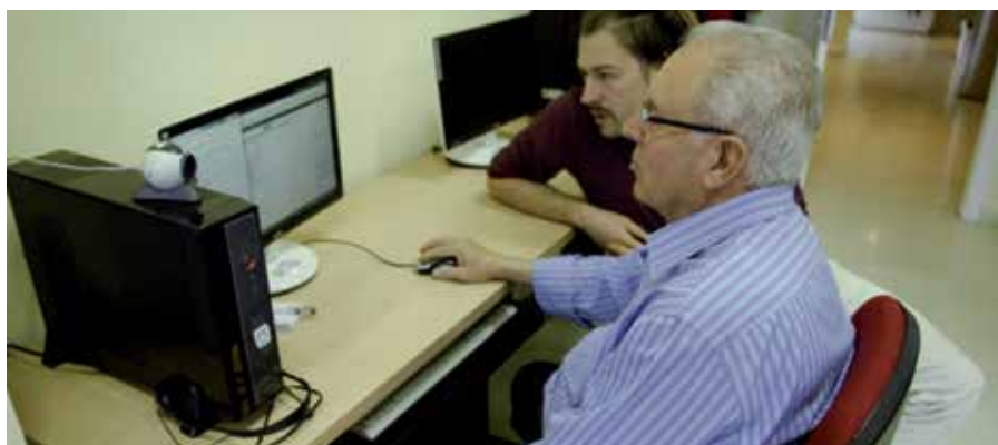
Una de las actividades que han ampliado su oferta de plazas son las Nuevas Tecnologías, cada vez más necesarias para la autonomía personal y la vida diaria.

La Concejalía de Bienestar Social ofrece un total de 2.195 plazas en su Programa de Actividades para las personas mayores. La cifra total supone un incremento del 12% con respecto a la ofertada durante este año, reforzando el compromiso del Ayuntamiento con la promoción de la autonomía, los hábitos de vida saludable y el envejecimiento activo de los mayores.