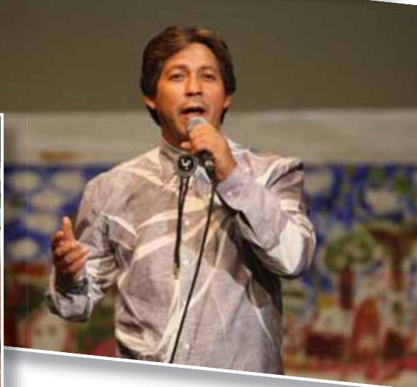
De izquierda a derecha y de arriba abajo, una sesión de títeres dentro de las actividades infantiles, discurso de clausura de la concejala de Inmigración, casetas del mercado Comercio Justo celebrado en la plaza de la Constitución, un partido de la III Copa de las Culturas y otra actuación musical.