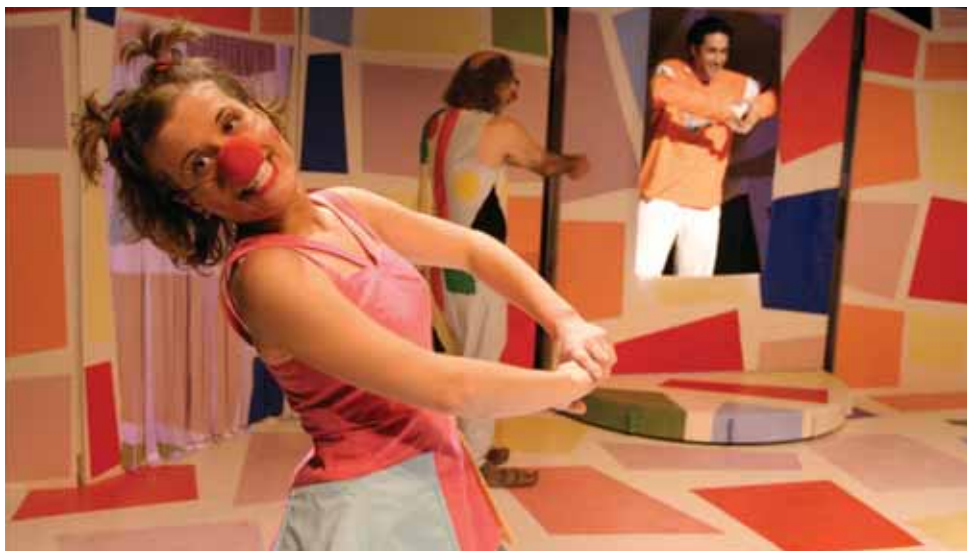
La obra Invisible, que obtuvo un premio Max en el 2006, se pondrá en escena el domingo 21.

(Premio Max 2006) Hora: 17:00 / Precio: 6 Euros / TAM