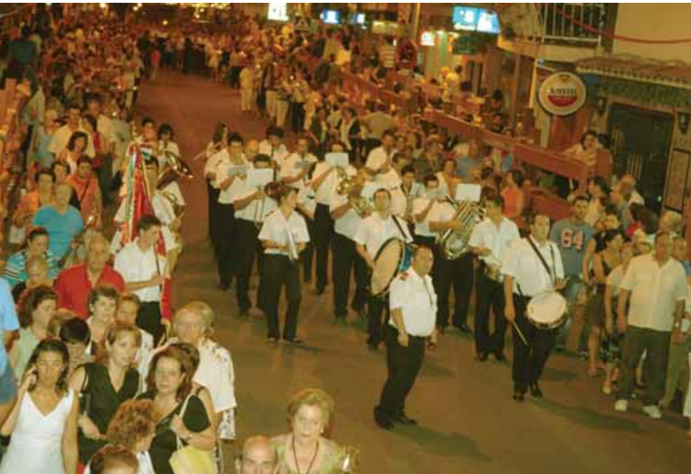
La Banda Municipal de Música siempre alegra con sus pasacalles las fiestas de San Sebastián de los Reyes, y acompaña con su son las procesiones y otros eventos señalados.