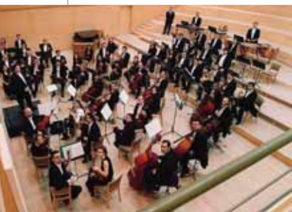
La Orquesta de la Comunidad de Madrid actuará en el TAM.

Música. Los viernes de la tradición: Vino de la Casa "Sigue la ronda majito" Hora: 19:00 / El Caserón