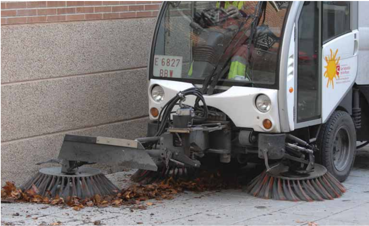
Otra de las medidas del plan consiste en la asignación de operarios extra a las calles arboladas y a los jardines para la retirada de hojas.

Los graffitis y, sobre todo, las firmas que ensucian las calles son un problema que hay que atajar con la colaboración de todos