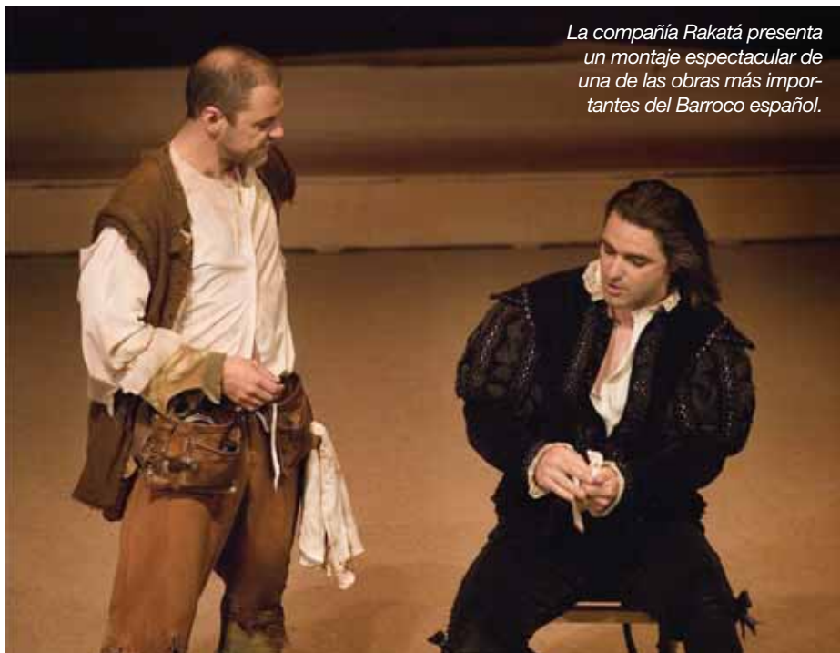
La compañía Rakatá presenta un montaje espectacular de una de las obras más importantes del Barroco español.

LLEGA 'EL PERRO DEL HORTELANO', LA OBRA CUMBRE DE LOPE DE VEGA