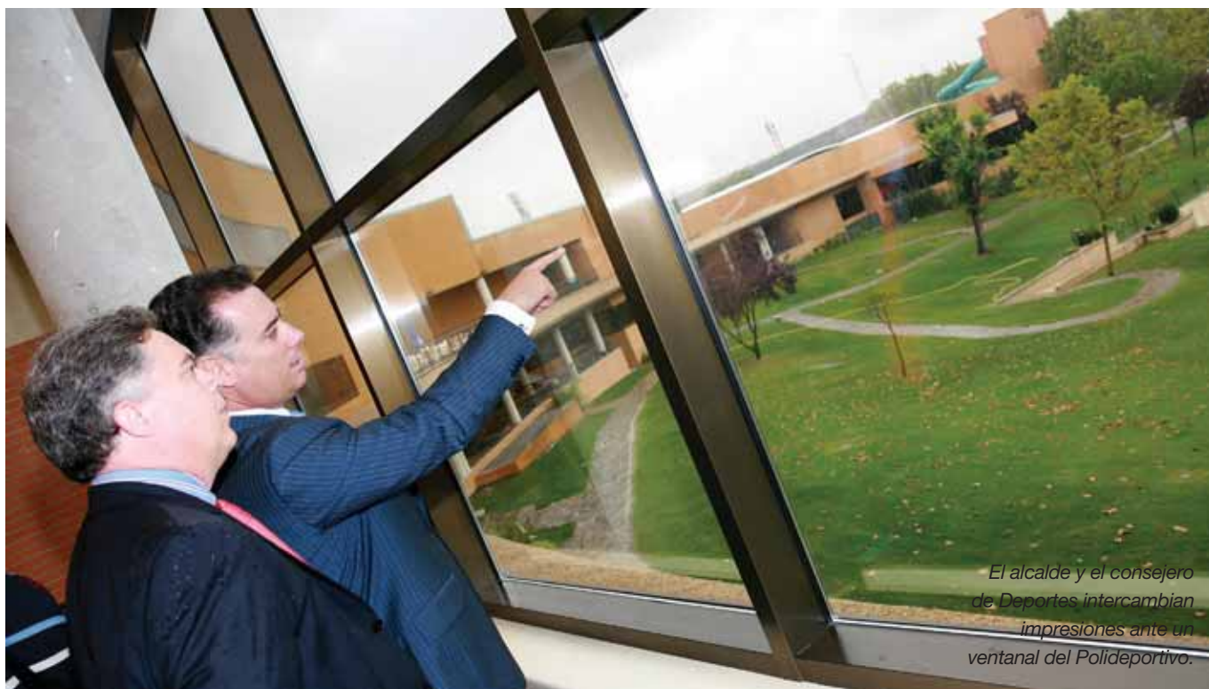
El alcalde y el consejero de Deportes intercambian impresiones ante un ventanal del Polideportivo.

EL CONSEJERO DE DEPORTES Y EL ALCALDE VISITARON EL POLI DEHESA BOYAL