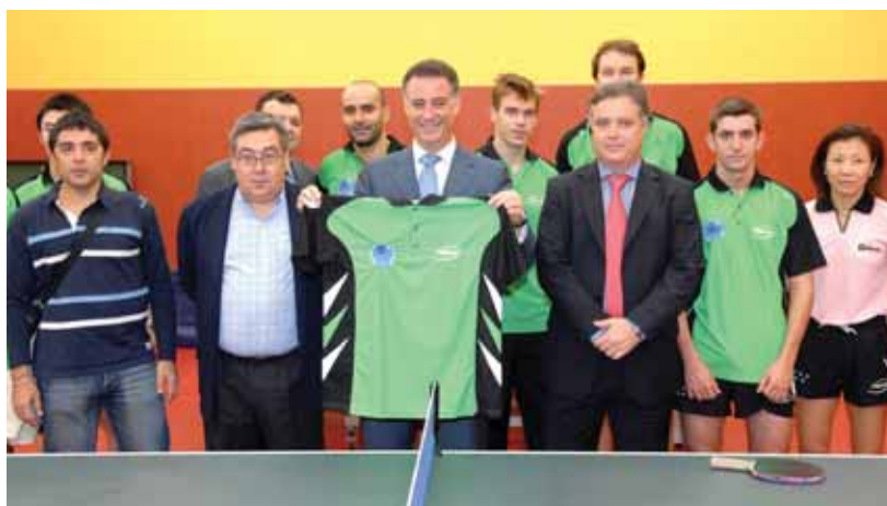
El equipo de tenis de mesa le hizo entrega de una camiseta al consejero en presencia del concejal de Deportes, el presidente del club, el alcalde y los jugadores.

sente y de sus posibilidades y necesidades de cara al inmediato futuro, pues el equipo femenino de voley es la única formación de la región que compite en la máxima categoría nacional.