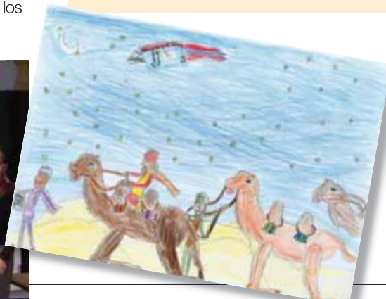
Dibujo que ha obtenido el primer premio en el concurso y que decorará la Carta a los Reyes del municipio de 2008.

El Premio del Ayuntamiento de San Sebastián de los Reyes recayó en la pastelería Montes; el de la Cámara Oficial de Comercio e Industria de Madrid, en Nanos Moda Infantil; el de la Asociación de Empresarios de la zona norte de Madrid (Acenoma) en Kyla-Kyla Complementos; y el de la Asociación Norte de Mujeres Empresarias (ANO-ME) en Artesano.es