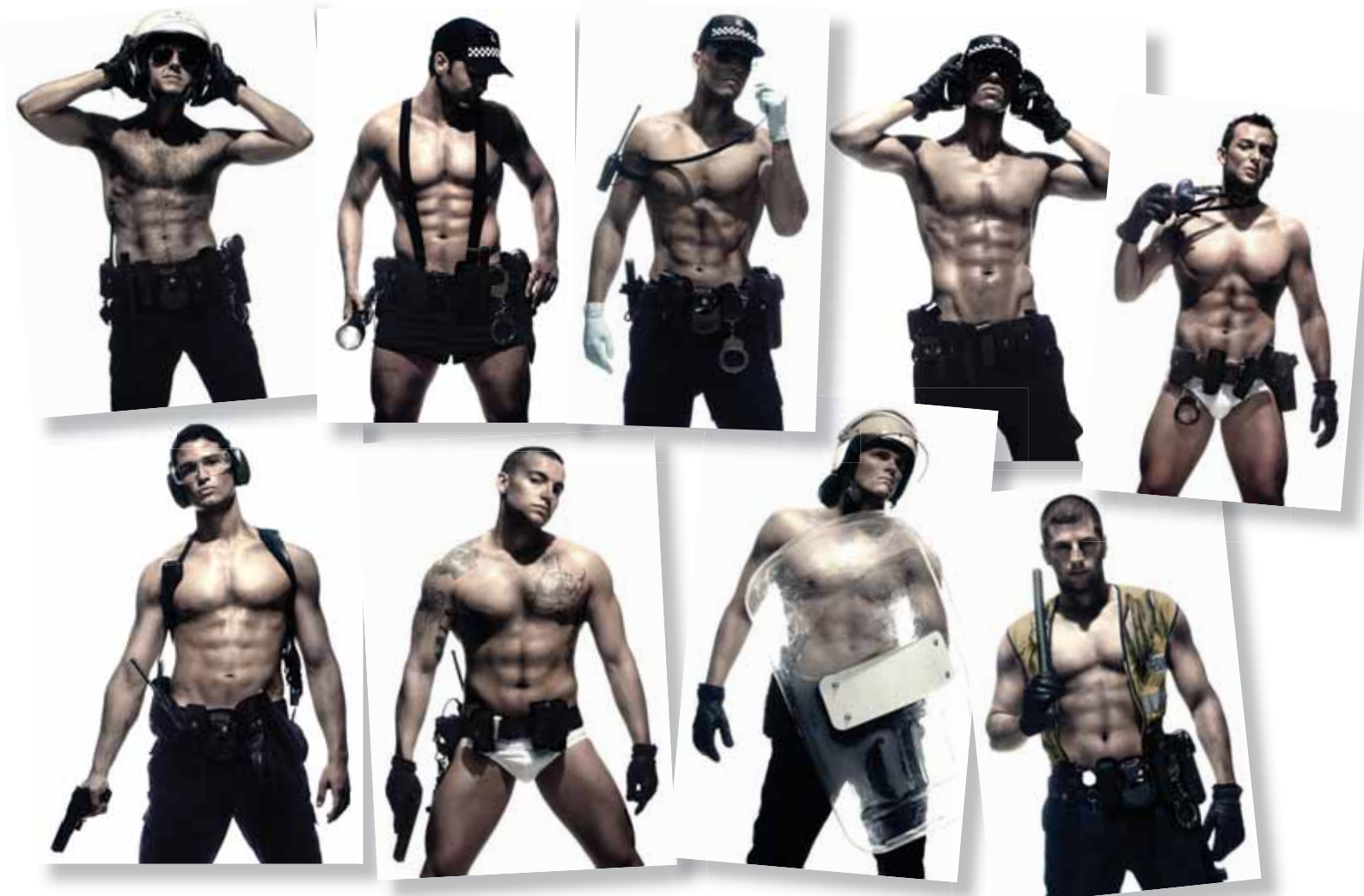
Arriba, páginas del calendario tal y como saldrá a la calle. Sobre estas líneas, las fotos que han sido utilizadas para el resto de meses. Todas han sido realizadas por el fotógrafo venezolano Rubén Darío.