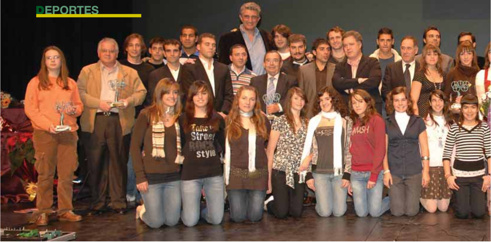
Al final de la Gala, premiados, invitados y miembros del Ayuntamiento se reunieron en el escenario para una foto para el recuerdo.

FERNANDO ROMAY Y FABIÁN RONCERO ENTREGARON ALGUNOS DE LOS PREMIOS