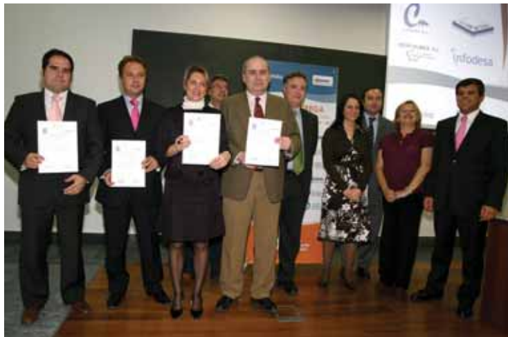
Los representantes de las cuatro empresas premiadas, Comofer, Garmer, Infodesa e Ibercolmex posan con los certificados.

empresa familiarmente responsable efr a empresas del municipio –Comofer, Garmer, Ibercolmex e Infodesa–, que ostentan así, oficialmente, este sello de calidad por haber adoptado un modelo de gestión encaminado a favorecer la igualdad de oportunidades y la conciliación de la vida laboral y familiar.