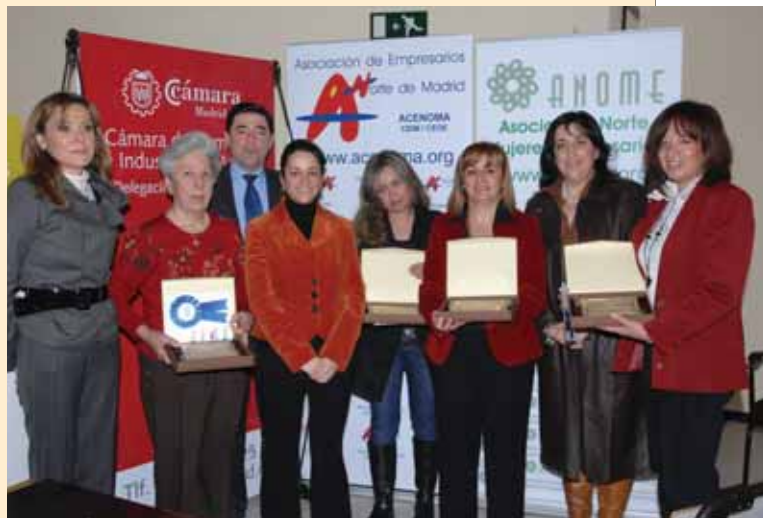
Los comercios premiados fueron la pastelería Montes, Nanos Moda Infantil, Kyla-Kyla y Artesanos.es

PROMOVIDOS POR EL AYUNTAMIENTO Y ACENOMA