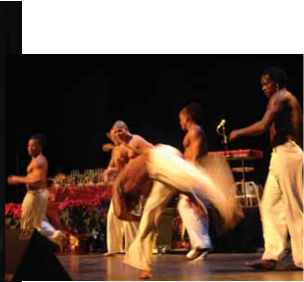
La exhibición de capoeira asombró a todos los asistentes a la XX Gala del Deporte.