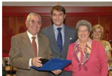
Arriba, el alcalde posa con uno de los matrimonios. Abajo, el Gerente de los Servicios Regionales de Bienestar Social, con otra pareja.