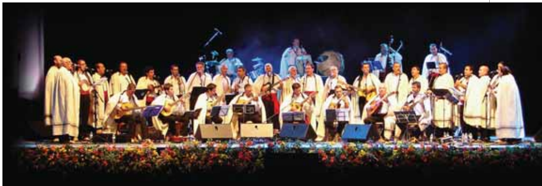
Los Sabandeños y su música de raíces canarias se presentarán en el TAM el viernes día 11.