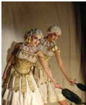
Por los ojos de Raquel Meller, en el TAM el domingo día 13.