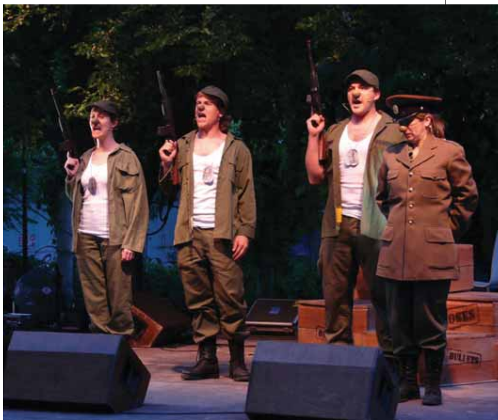
La Compañía Los McClown participará en la clausura de la IV Feria de Artes Escénicas con la obra En pie de guerra , una parodia sobre las terribles guerras de los últimos tiempos.

Las propuestas teatrales programadas en San Sebastián de los Reyes se completan con Otelo , último proyecto escénico de Cruceta Flamenco . El Teatro Adolfo Marsillach acogerá, a partir de las 16:30 horas, esta adaptación coreográfica so-