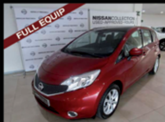
NISSAN NOTE 5P. 1.2G 80CV TEKNA SPORT

kilometraje: 28.195 Km Matriculación: 11 / 2013