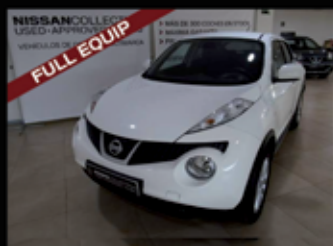
NISSAN JUKE 1.6 TEKNA PREMIUM 4X2

kilometraje: 54.391 Km Matriculación: 9 / 2011