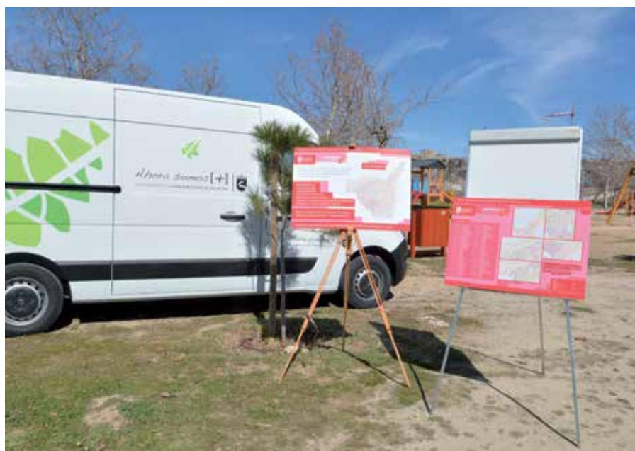
Las 142 nuevas zonas infantiles contarán con la certificación acorde a la Normativa europea, lo que redundará en su seguridad y salubridad.

El personal del servicio de mantenimiento realizará visitas semanales a todas las zonas señaladas con tres equipos operativos: un equipo de inspección con un oficial inspector con un vehículo; un segundo equipo de mantenimiento preventivo dotado de un oficial de mantenimiento con total dedicación con un furgón taller, y por último un equipo de mantenimiento correctivo, con un oficial de mantenimiento que actuará según las necesidades, dotado igualmente con un furgón taller. El personal de control y gestión se completa con un encargado y un jefe de servicios, cuya responsabilidad pasa por la conservación y mantenimiento de