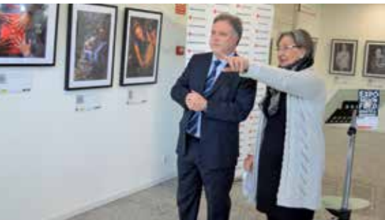
El alcalde con la representante de Cruz Roja.

C ruz Roja inauguró la exposición 'Photowork: Una mirada sobre la igualdad en el empleo', actividad enmarcada en el Mes de la Mujer y compuesta por tres partes diferenciadas: la sociedad,