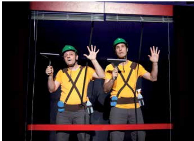
Teatro Gestual con 'Jobs', el sábado 21 a las 20:00 h. en el TAM.