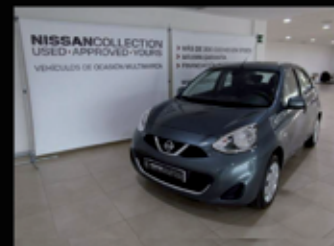
NISSAN MICRA 5P 1.2G (80CV) ACENTA

kilometraje: 7.700 Km Matriculación: 3 / 2014