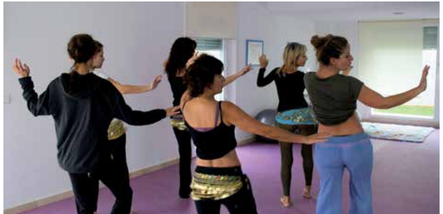
Los talleres de danza tienen dos niveles y ofrecen también la modalidad de Flamenco Oriental.

* Lunes y miércoles de 18.30 h a 20.00 h * Martes y jueves de 11.30 a 13.00 h Un programa informático para gestión de contabilidad informatizada, cuentas anuales, contabilidad de costes, presupuestaria, liquidación de impuestos, y análisis de cuentas