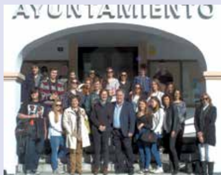
El grupo de alumnos y profesores fueron recibidos en el Ayuntamiento por el alcalde.

El objetivo de este programa es que los alumnos mejoren el nivel de competencia lingüística, en este caso inglés, fomenten el