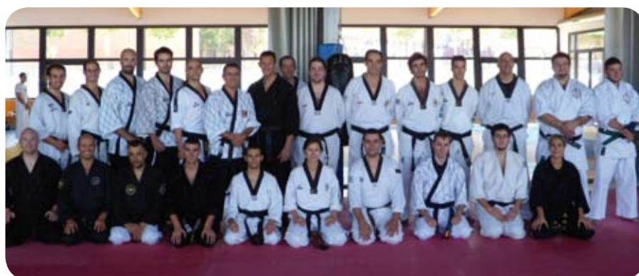
Componentes de la disciplina de Hapkido, una de las actividades destacadas del Centro Deportivo Victoria.