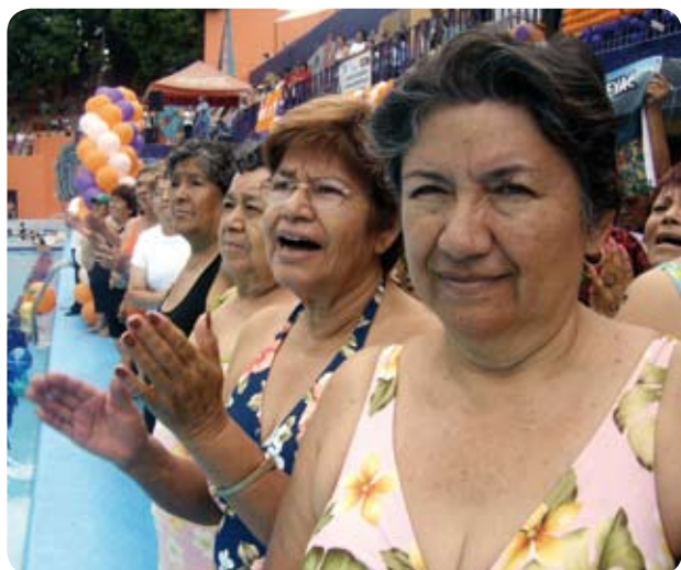
La oferta de este año duplica a la del pasado, y alcanza un total de seis Comunidades autónomas.

Más facilidad en la presentación de las solicitudes, mayor rapidez en la tramitación y más destinos al alcance de la mano, son el resultado del acuerdo alcanzado entre el Ayuntamiento y el IMSERSO. El acuerdo permite que las solicitudes de nuestros mayores para el programa de "Termalismo Social" se tramiten en el centro municipal "Gloria Fuertes". Las solici-