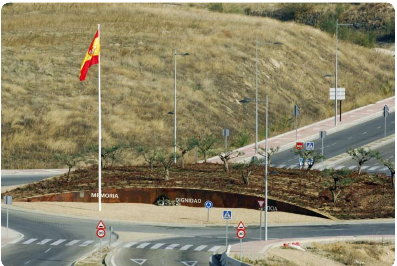
Vista aérea de la rotonda-monumento dedicada a las víctimas del terrorismo en la que se puede leer las palabras "Memoria, Dignidad y Justicia".

Con los fondos del Plan Estatal, por un importe total de 193.337 euros, el Ayuntamiento ha promovido esta obra que incluye el monumento en homenaje a las Víctimas del Terrorismo, con las palabras "Memoria, Dignidad y Justicia", cuya inscripción fue propuesta por la Fundación Víctimas del Terrorismo". El emplazamiento de este memorial permitirá que miles de personas la contemplen cada día, por la visibilidad de la misma y por la densidad del tráfico en esta zona de la localidad. ●●●