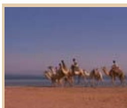
Diario de Egipto Jueves, 22,35 h.

12,05 Los Gnoufs 12,15 Mimi y Mr. Bobo 12,50 Descubrimientos del mundo 13,15 La Cocina de Mikel Bermejo 13,30 La casa de la playa 14,15 Matrícula 15,00 Atei 19,00 Los Gnoufs 19,25 Mimi y Mr. Bobo 20,00 Boletín informativo 20,10 La Cocina de Mikel Bermejo 20,40 Matrícula 21,10 La casa de la playa 22,00 Boletín informativo 22,10 Descubrimientos del mundo 22,40 Cine: El Samaritano 00,15 Suelta tu rima: El Pacto