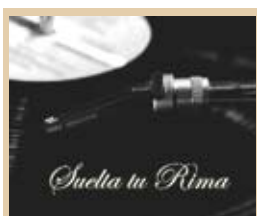
Suelta tu rima Lunes a viernes, 00,30 h.

12,05 Los Gnoufs 12,15 Mimi y Mr. Bobo 12,50 Reino Salvaje 13,15 La Cocina de Mikel Bermejo 13,30 La casa de la playa 14,15 Matrícula 15,00 Atei 19,00 Los Gnoufs 19,25 Mimi y Mr. Bobo 20,00 Boletín informativo 20,10 La Cocina de Mikel Bermejo 20,35 Matrícula 21,05 La casa de la playa 22,00 Boletín informativo 22,05 Reino Salvaje 23,55 El Padrino 00,40 Suelta tu rima: 5001