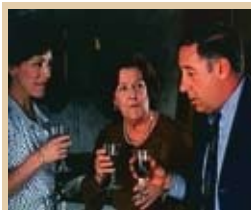
Tata mía Martes, 22,35 h.

12,05 Los Gnoufs 12,15 Mimi y Mr. Bobo 12,50 Descubrimientos del mundo 13,15 La Cocina de Mikel Bermejo 13,30 La casa de la playa 14,15 Matrícula 15,00 Atei 19,00 Los Gnoufs 19,25 Mimi y Mr. Bobo 20,00 Boletín informativo 20,10 La Cocina de Mikel Bermejo 20,35 Matrícula 21,10 La casa de la playa 22,00 Boletín informativo 22,10 Descubrimientos del mundo 22,35 El Padrino 00,25 Suelta tu rima: Collette