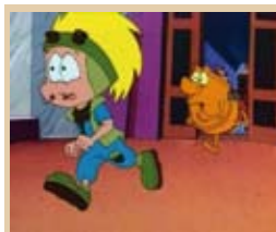
La orquesta de Óscar Próximamente