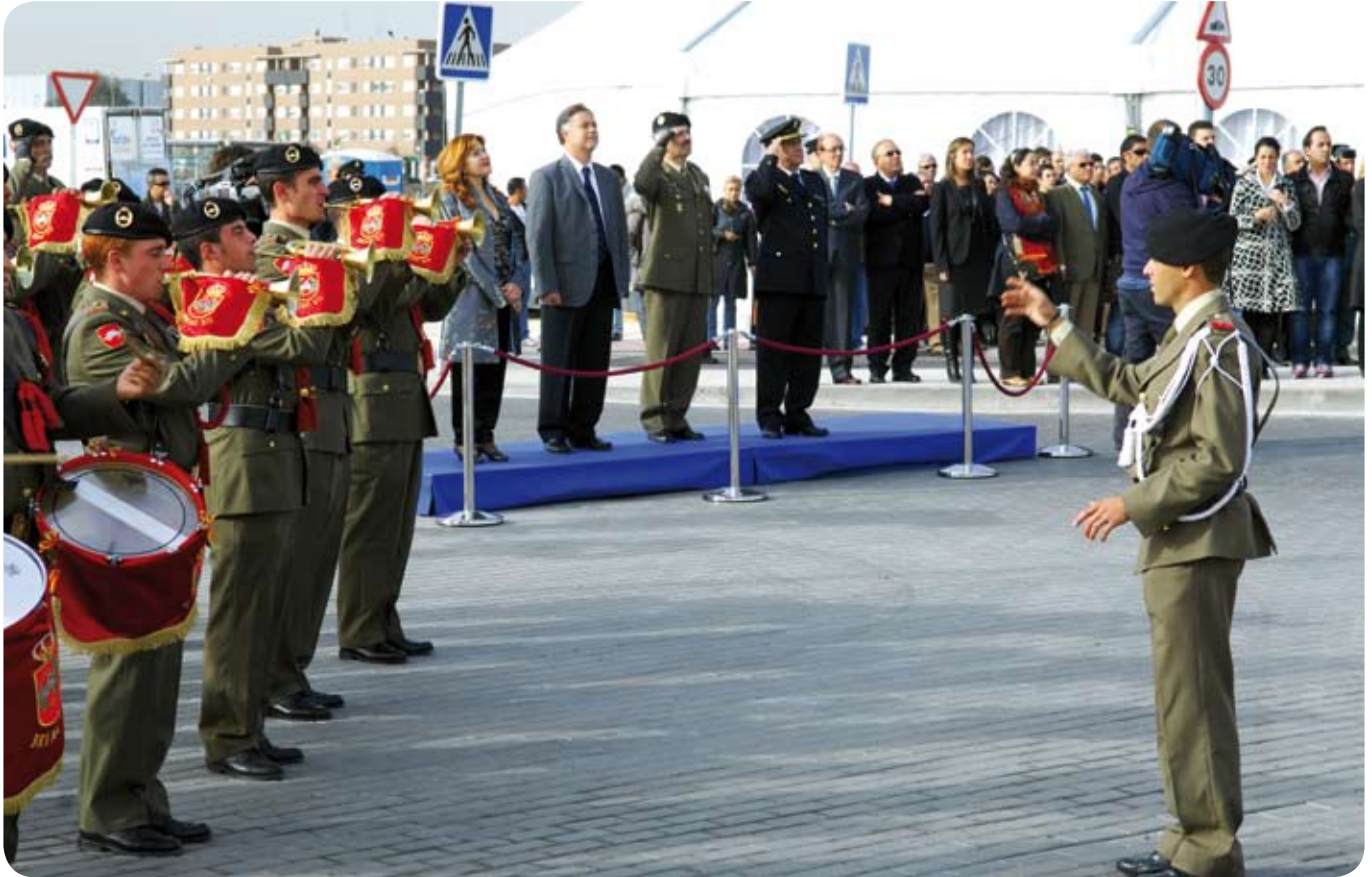
Un escuadrón del Ejército interpretó el Himno Nacional mientras los presentes guardaban un respetuoso silencio.

El día hizo honor al homenaje que San Sebastián de los Reyes, fruto de una moción aprobada por unanimidad de todos los grupos políticos, brindó a las víctimas del terrorismo. Cientos de personas acudieron a la cita, en un acto durante el cual se izó la bandera nacional, mientras que una banda de cornetas del ejército interpretaba el himno de España. La enseña nacional ondeará permanentemente en esta rotonda.