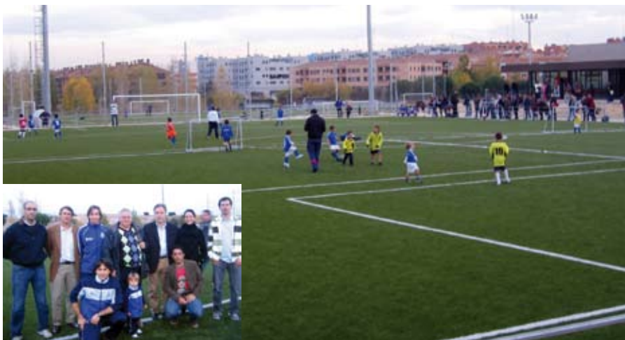
Sobre estas líneas, el alcalde, el concejal de Deportes, y otros dos concejales con los responsables del torneo.

A mediados de noviembre se inauguró una competición en la que lo más importante no es ganar, sino fomentar una serie de valores a los niños que les servirán