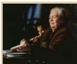
La mitad del cielo Miércoles, 22,35 h.

12,05 Los Gnoufs 12,15 Mimi y Mr. Bobo 12,50 Reino Salvaje 13,15 La Cocina de Mikel Bermejo 13,30 La casa de la playa 14,15 Matrícula 15,00 Atei 19,00 Los Gnoufs 19,30 Mimi y Mr. Bobo 20,00 Boletín informativo 20,10 La Cocina de Mikel Bermejo 20,35 Matrícula 21,05 La casa de la playa 22,00 Boletín informativo 22,05 Descubrimientos del mundo 22,35 Cine: La mitad del cielo 00,40 Suelta tu rima: el reportero