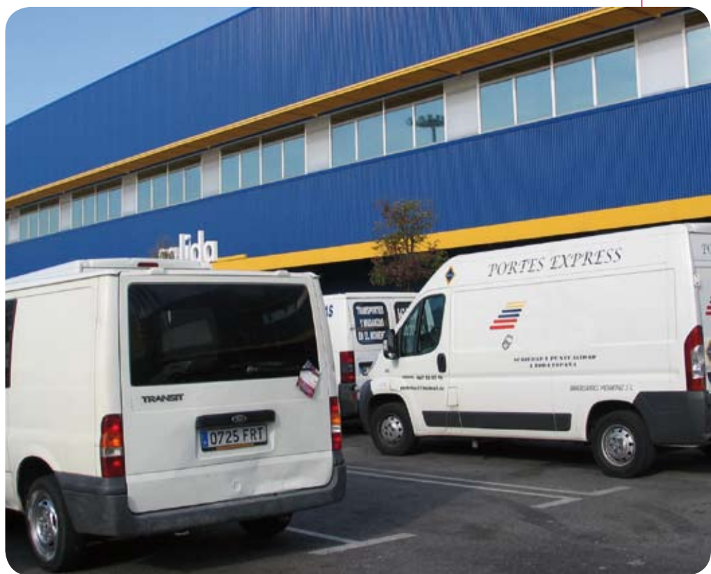
La Oficina del Consumidor ha diseñado una campaña informativa sobre los transportes.