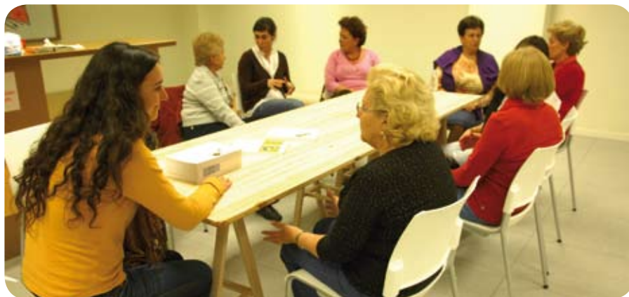
Grupo de alumnas con una de las profesoras de los talleres de Fácil Lectura.