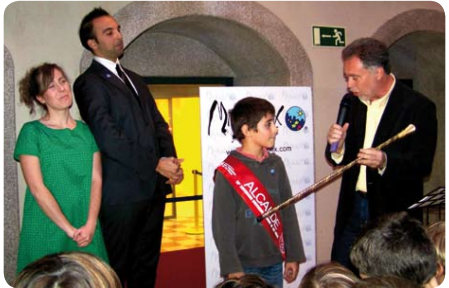
El parque Infantil Micropolix celebró de manera especial esta fecha con un completo programa de actividades en las que colaboró el Ayuntamiento de nuestra ciudad.

E l 20 de noviembre se celebró el XX Aniversario de la Convención sobre los Derechos del Niño. Para conmemorar este hecho, hasta el 22 de noviembre, el Ayuntamiento, a través de la Concejalía de Juventud e