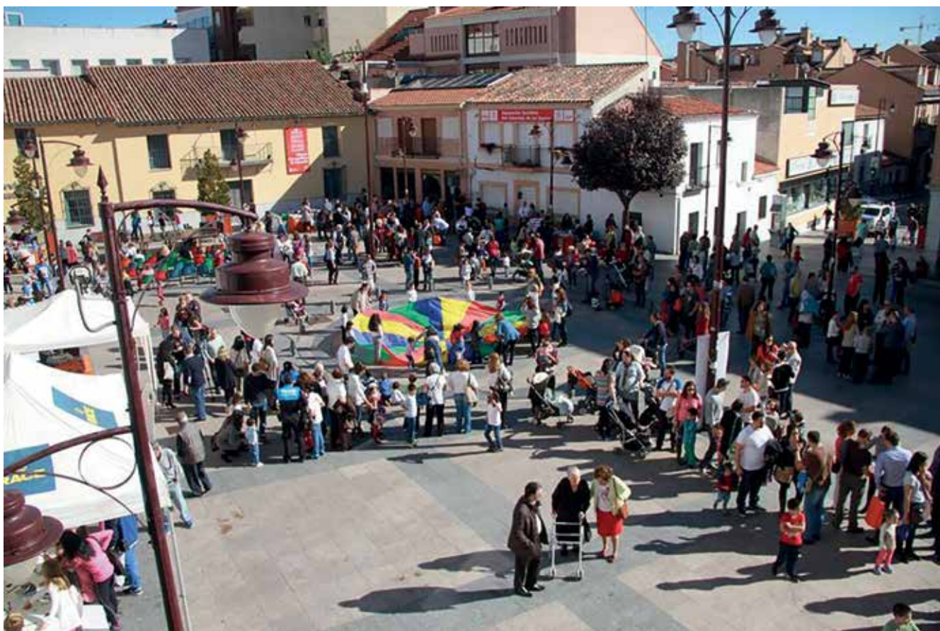
▲ Vista aérea de la Plaza de la Constitución durante la edición pasada con los 'stands' de las librerías participantes en la Feria del Libro.