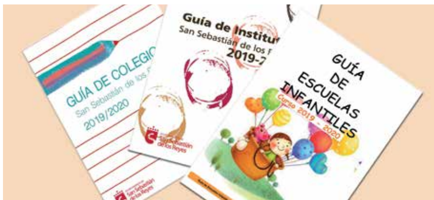
▲ Las Guías de escuelas infantiles, colegios e institutos se pueden consultar en la web municipal.

7. Tardes de lunes, miércoles y viernes de 17:00 a 20:00 h