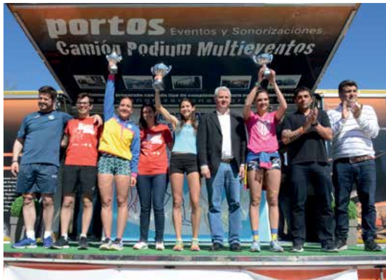
▲ Los miembros de la Corporación municipal, con las ganadoras.