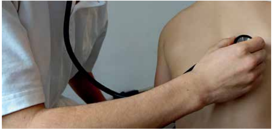
▲ Un profesional sanitario se encuentra, desde el 1 de marzo, a disposición de los centros educativos.

El formato de trabajo de Educación para la Salud es desarrollar talleres formativos en las aulas de cuestiones como, por ejemplo, prevención de la obesidad, hábitos saludables en edades tempranas o desayunos saludables, entre otros. Además, se va a ofrecer la posibilidad de dar formación a los profesores y padres en aquellos temas que puedan generar más inquietudes, como la administración de adrenalina en niños con alergias alimentarias, la atención en situaciones de crisis a niños que tienen patologías crónicas o crisis asmáticas graves o crisis convulsivas. Según Jussara Malvar, concejala de Salud, "se trata de dar servicio de apoyo y asesora-