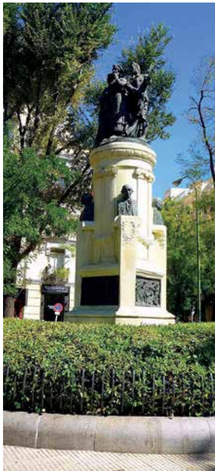
▲ Visita al Barrio de los chisperos, el miércoles 11.

Lunes 29, charla-coloquio, Inteligencia Emocional: autocuidado y gestión