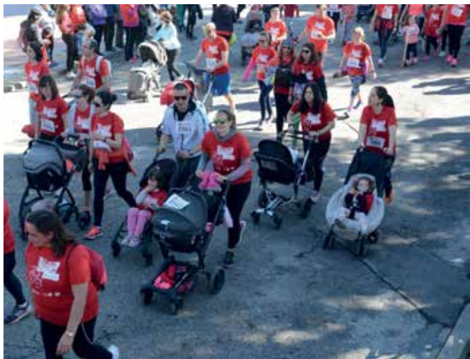
▲ Las familias también llevaron a los más 'peques' en esta jornada reivindicativa.

El domingo 10 de marzo tuvo lugar una nueva edición de la Carrera de la Mujer, un evento que se ha convertido en uno de los acontecimientos sociales y deportivos más importantes del año en nuestra ciudad. Miles de vecinas y vecinos, sin importar edad ni condición, salieron del Recinto Ferial del Parque de La Marina para 'correr' las calles de Sanse en una fiesta que fue el colofón a los actos y actividades conmemorativos por el Día Internacional de la Mujer.