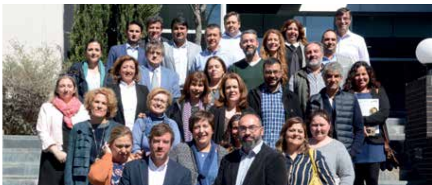
▲ Asistentes a la asamblea general de la Red de Empresas de San Sebastián de los Reyes.

La Red de Empresas de San Sebastián de los Reyes ha celebrado su asamblea general en el Centro Municipal de Formación 'Marcelino Camachó', con el