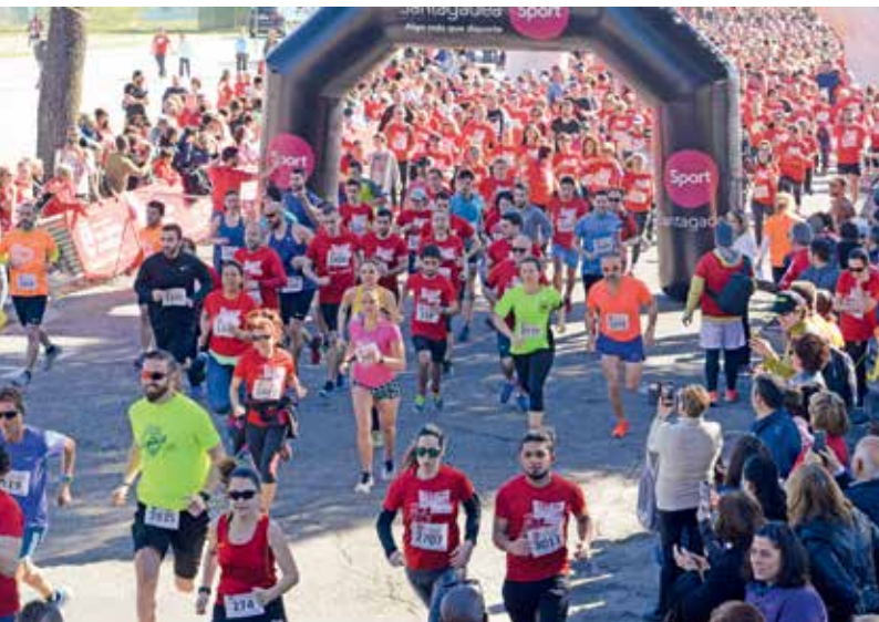
▲ Momento de la multitudinaria salida.