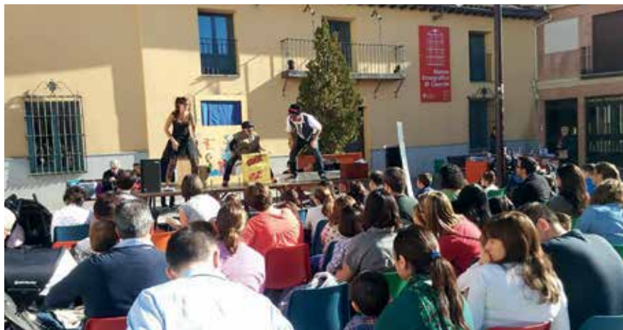
▲ Los cuentacuentos son unas de las actividades 'estrella' de la programación.

Fin de fiesta. Espectáculo familiar Recogida de entradas media hora