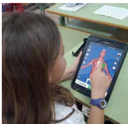
▲ Las tablets ayudan al proceso de aprendizaje.

El programa, activo desde el pasado mes de octubre, consiste en el préstamo de 25 tablets por centro escolar, durante un periodo de tiempo que oscila entre las tres y cuatro semanas para su utilización como recurso didáctico. Su uso en las aulas facilita la interacción profesorado/alumnado, mejora el