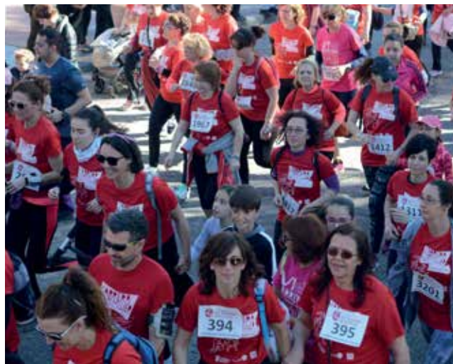
▲ Las mujeres, protagonistas, durante la carrera.

E l Ayuntamiento, concretamente las Concejalías de Igualdad y de Deportes, organizó una carrera en la que participaron no sólo mujeres, sino también hombres, niñas y niños, jóvenes y no tan jóvenes.