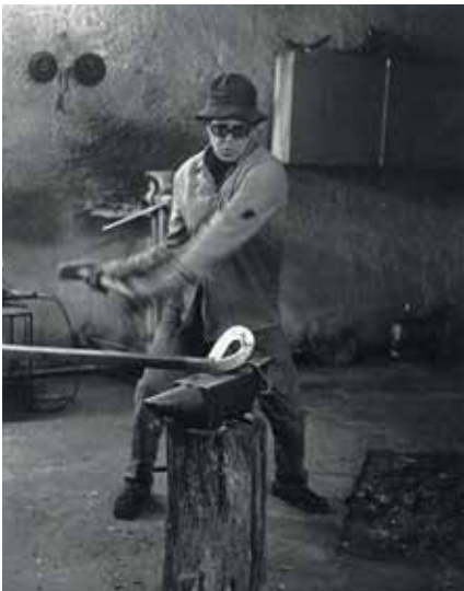
▲ El escultor, trabajando en su casa-taller.

El escultor Martín Chirino López (Las Palmas de Gran Canaria, 1925) trabajó y vivió durante 35 años (de 1960 a 1995) en Sanse, donde dejó una profunda huella. Como reconocimiento, el Ayuntamiento en 2007 lo nombró hijo adoptivo de la ciudad y dio su nombre a una de las salas de exposiciones del Centro Cultural Pablo Iglesias y a una calle cercana a El Yunque, la casa-taller del artista canario.