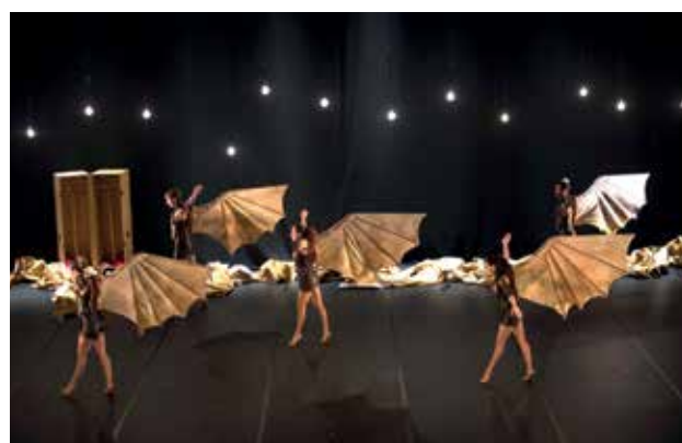
▲ La obra recrea los sueños del Leonardo da Vinci más visionario.

V uelos es un espectáculo de danza contemporánea para público infantil y familiar inspirado en los sueños del visionario Leonardo da Vinci, que convierte su inmenso y peculiar legado en fuente de inspiración para alentar el disfrute de todos los sentidos. La obra está dirigida por Enrique Cabrera, que