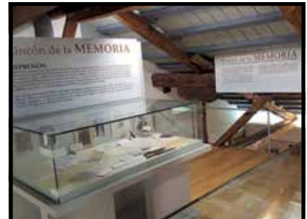
▲ Exposición El Rincón de la Memoria.