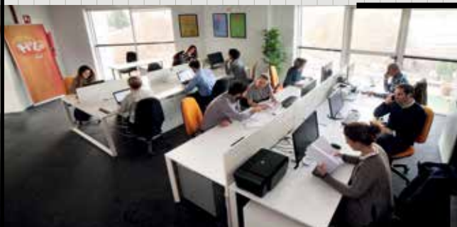
▲ Oficinas de HELP4U.

Por su compromiso y colaboración en la dinamización del tejido empresarial en el municipio el Ayuntamiento ha correspondido al Centro de Negocios HELP4U con el Sello de Responsabilidad Local Corporativa en su primera edición del año 2018.