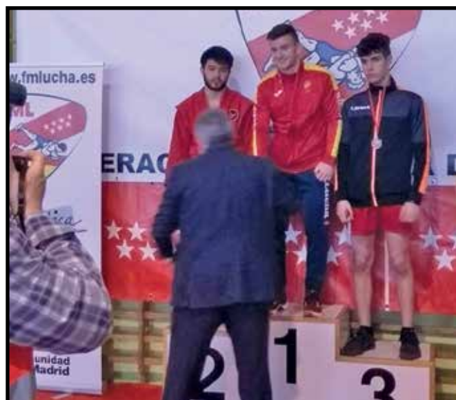
▲ El luchador sansero (tercero por la derecha) sólo tiene 17 años.

Por fin se consiguió el tan deseado ascenso. La verdad es que este equipo ha hecho una temporada sensacional y se merece este premio.