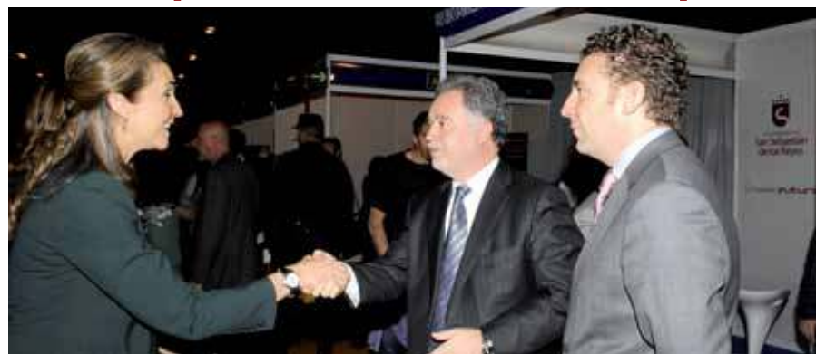
El alcalde saluda a la infanta en compañía del concejal de Desarrollo Local.