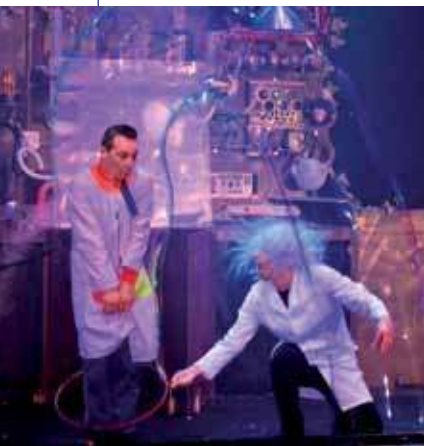
"Bubble Bros", espectáculo infantil en el TAM.