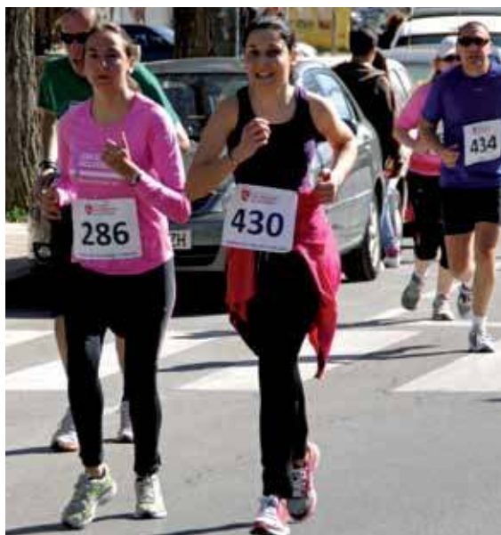
Las mujeres de Sanse que tomaron parte en la I Carrera Popular de la Mujer demostraron un gran estado de forma.

Teatro, actividades deportivas, actos culturales y diversas exposiciones pictóricas