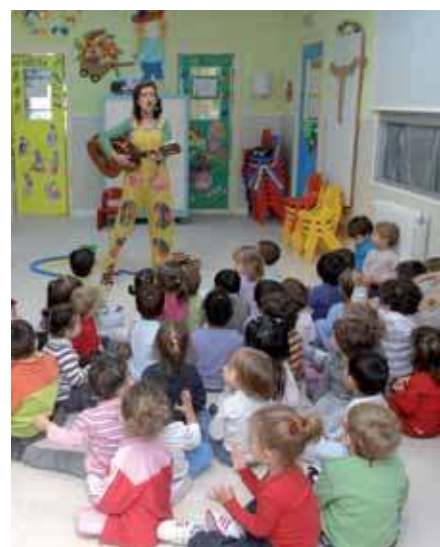
La expresión musical es una de las actividades que contribuyen al desarrollo integral de los niños.

E l Ayuntamiento, a través de la Concejalia de Juventud, ha preparado nuevas actividades para las 'Divertecas', que tendrán lugar durante los meses de abril y mayo en 'Los Arroyos', 'Planeta Tierra' y 'Club de Campo', cada día de la semana (de lunes a jueves de 17.00 a 19.30), con un programa genérico dedicado a los siguientes tipos de expresión: La expresión corporal como ayuda en la cons-