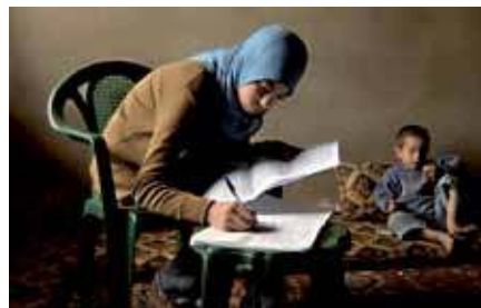
Este proyecto cuenta con una financiación de 138.000 euros y tiene una duración de cuatro años.

La estructura de esta actuación está marcada por las cerca de 400.000 personas que se encuentran por debajo de la línea de pobreza y por unos niveles de desempleo que afectan al 47% de mujeres en la franja de Gaza, según informa la Agencia de Naciones Unidas para los Refugiados de Palestina. ●●●