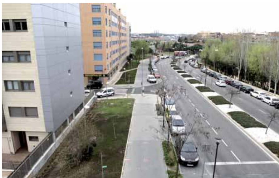
La remodelación de Tejas Verdes ha mejorado las zonas verdes y creado más espacios para los peatones.

ámbito que comunica con la calle Alfonso X y el centro comercial cercano.