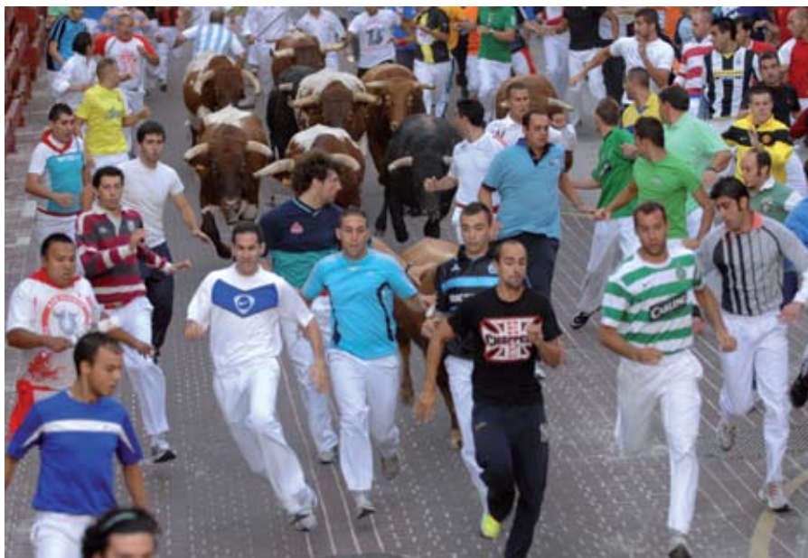
Sanse es garantía de calidad y organización de los encierros, que suelen saldarse sin incidentes importantes a pesar de la gran cantidad de corredores que vienen de toda España.

Las fiestas de San Sebastián de los Reyes han conjugado siempre libertad y respeto, alegría y celebración con ponderación y tolerancia. Este año 2010, más que nunca, se ha cumplido esta máxima y todas las actividades se han saldado sin incidentes y con una excelente participación.