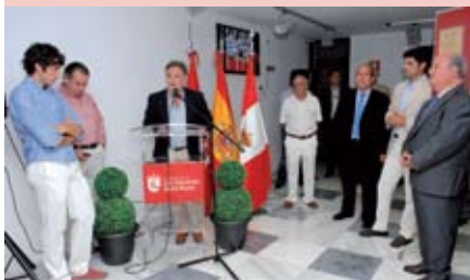
En este evento estuvieron presentes toreros y miembros destacados del mundo del toro.