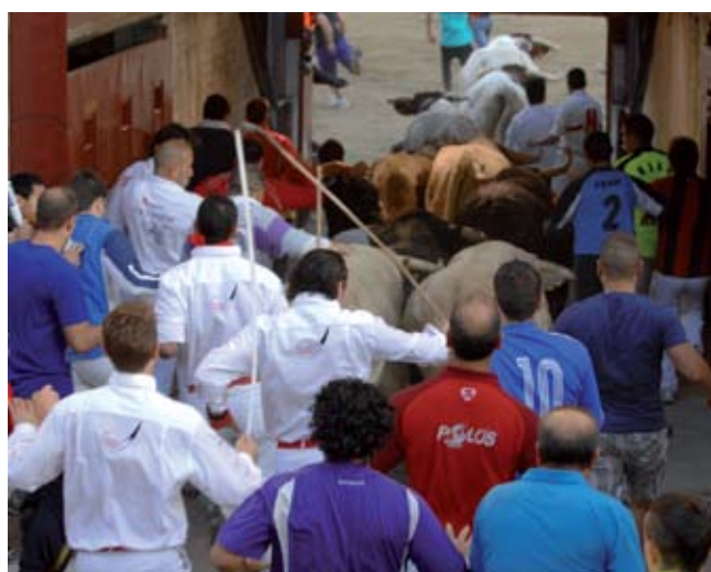
La labor de los pastores, con la sabiduría que atesoran, es de una importancia clave para que no ocurra ningún percance que lamentar.