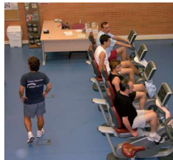
El programa de condición física y salud está orientado hacia la búsqueda de una autonomía física.

La escuela de Aire Libre pretende conseguir un acercamiento al deporte en contacto directo con la naturaleza. Un desarrollo de las cualidades físicas junto con el respeto y conocimiento de nuestro medio más natural. Clases de escalada deportiva, actividades de senderismo, orientación, multiaventura, viajes a la nieve... Las clases de entrenamiento de escalada se imparten todos los días en las magníficas instalaciones para la escalada del Polideportivo Dehesa Boyal, en sesiones de hora y media con posibilidad de acudir uno o dos días en semana. Para poder inscribirse en ellas es preciso tener