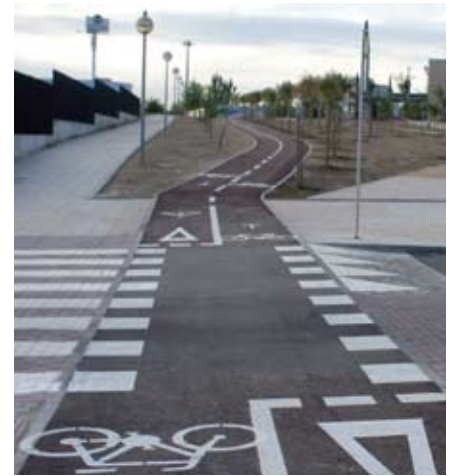
El carril bici gana espacio para lograr una ciudad sostenible donde los desplazamientos sean económicos y no contaminantes.

Aunque el proyecto no queda solo ahí. Se extiende para dotar de vegetación a la zona, distribuyendo sobre 4.500 metros cuadrados de terreno 268 árboles de distintas especies y 5.400 arbustos. Con un sistema de riego