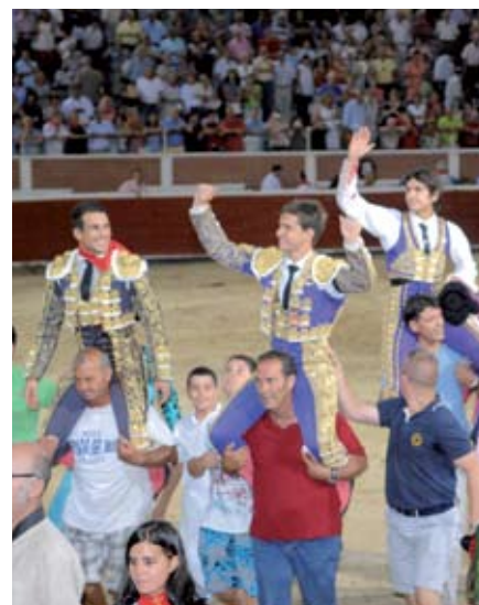
Un gran hito histórico de la feria taurina: la salida a hombros de los tres diestros que lidiaron la corrida del 29 de agosto: El Juli, Castilla y Manzanares.

de personas con una oferta de actividades de calidad".