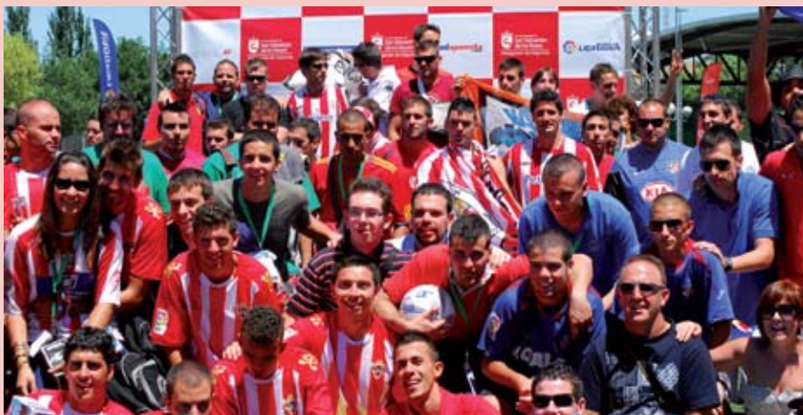
Los aficionados almerienses han demostrado que tienen la mejor hinchada sobre el terreno de juego.

El conjunto almeriense se ha proclamado campeón del Campeonato de Aficiones de Incondicionales.com que se celebró en nuestra ciudad. Los andaluces se impusieron en la final al Villarreal y dieron una lección de juego a aficiones como las del Real Madrid, Barcelona o Atlético que no pasaron de cuartos. En su camino hacia el título de la