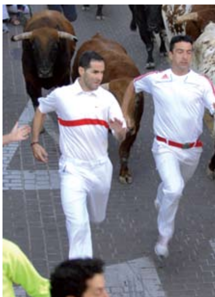
La profesionalidad de los corredores es un ejemplo del que nuestra ciudad se enorgullece.