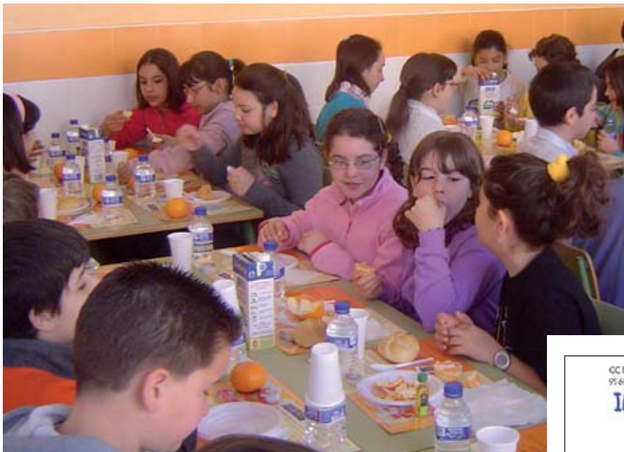
Esta iniciativa llegó el año pasado a más 15.000 escolares de la Comunidad de Madrid y en este curso se va a continuar desarrollando.

Enseñar a comer a los más pequeños, hacerlo con los alimentos naturales de la dieta mediterránea y procurar que estos hábitos sean adoptados desde la edad más temprana posible son los objetivos del programa “Desayunos Saludables”. Desarrollado por el Ayuntamiento, a través de la Concejalía de Salud, e impartido a lo largo del año pasado en los colegios, ahora vuelve a los centros para este curso escolar.