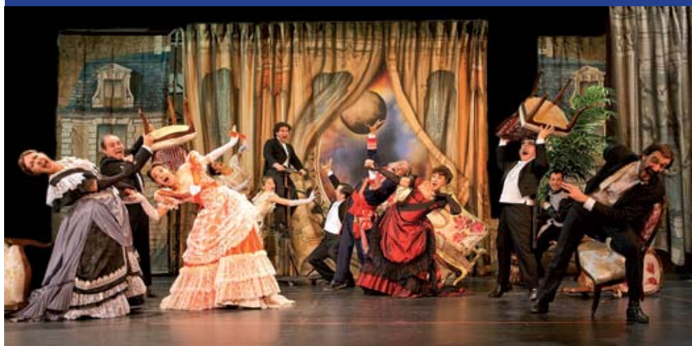
Jardiel Poncela firmó con esta obra uno de los títulos teatrales más importantes de su carrera, lleno de un humor que trasciende la época hasta llegar al siglo XXI sin perder un ápice de frescura y actualidad. Sábado 25, a las 20 h. en el TAM.

"Angelina o el honor de un brigadier" es una de las obras más delirantes y originales del dramaturgo madrileño, pionera del teatro de humor en España, por sus aportaciones vanguardistas al lenguaje, su originalísimo concepto del ingenio y la renovación de los comportamientos sociales de sus personajes. Sobre el telón de fondo de 1880, con sus duelos a pistola, damitas de salón, caballeros engominados, militares, batallas y todo el oropel que quedaba del Imperio, Jardiel va más lejos; sabe que un tiempo nuevo llama a la puerta y con el