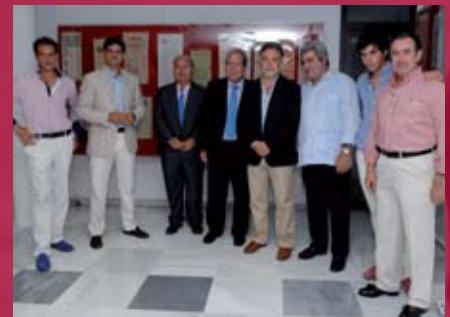
Exposición Toros en Barcelona