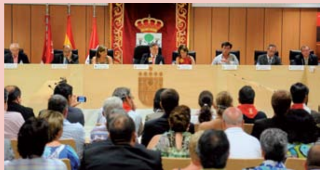
El 26 de agosto tuvo lugar en el salón de plenos de la Casa Consistorial la firma del acta fundacional que integra a municipios y entidades relacionadas con la promoción de los festejos taurinos populares.

San Sebastián de los Reyes preside esta Asociación. Su objetivo es la promoción y conservación de todos los festejos taurinos populares que formen parte de la historia, cultura y tradición existentes en cada territorio, siempre que su organización y desa-