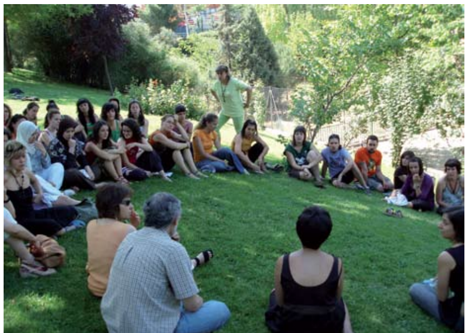
Este curso está destinado a aquellas personas interesadas en conocer las causas de la pobreza y las desigualdades y que quieran participar como voluntarios o profesionales para hacer un mundo más justo.

- Servicio de Atención Ciudadana (SAC) de El Caserón. Plaza de la Constitución, s/n, y en el Centro Los Arroyos.