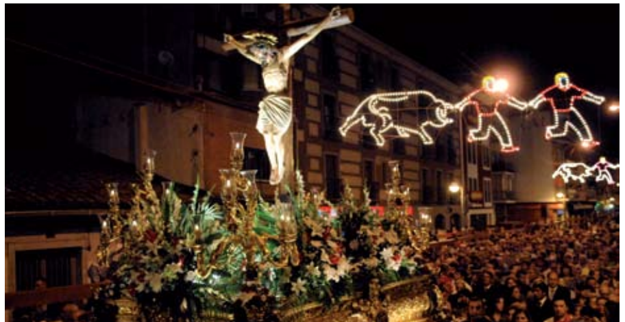
Otro evento que congregó a multitud de gente fue la procesión del Santísimo Cristo de los Remedios, que se celebró el día 28 de agosto por las calles del centro histórico, desde la parroquia de San Sebastián Mártir.

Capítulo aparte merecen los encierros, cuya calidad organizativa ha quedado acreditada una