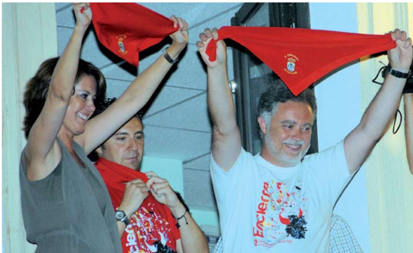
La alcaldesa de Pamplona y el de Sanse enseñan en el balcón del Ayuntamiento los emblemáticos pañuelos de las fiestas en la noche del pregón.