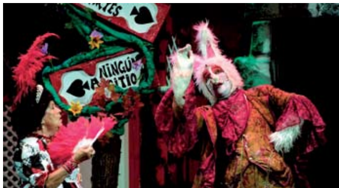
'Alicia en el país de las maravillas (Un clásico en versión musical)', el domingo 26 de septiembre a las 17 h. en el Teatro Adolfo Marsillach.