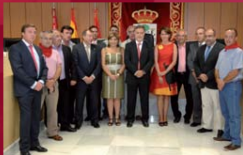
Asociación Internacional de Festejos Taurinos Populares