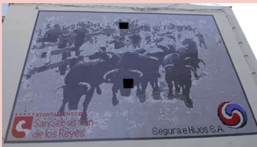
Vista del mural que se acaba de inaugurar en la esquina de la calle de San Roque con Real.

del libro de fotografías del encierro, que se presentó ese mismo día 24, también registró una nutrida presencia de aficionados. El libro se puede adquirir en la Oficina de Festejos, situada en la Plaza de la Iglesia. ●●●