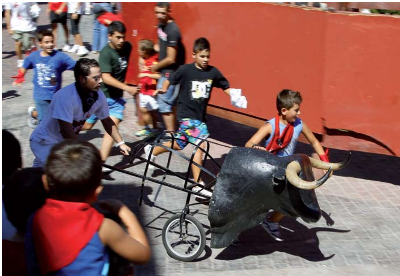
Los encierros infantiles son otras de las grandes tradiciones de nuestras fiestas, en los que los niños se lo pasan en grande sin peligro y aprendiendo.