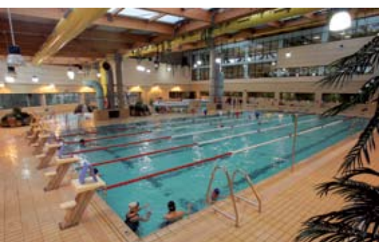
Las actividades acuáticas están destinadas a toda la población y abarcan todas las edades.

Las clases de Tenis y Pádel se imparten en las instalaciones del Polideportivo Dehesa Boyal, en grupos reducidos, con sesiones de una hora en una o dos sesiones semanales. Existe también un programa personalizado a disposición de todos los usuarios que quieran aumentar el ritmo de entrenamiento o adaptarlo a sus circunstancias personales (desde clases particulares a entrenamientos intensivos). ●●●