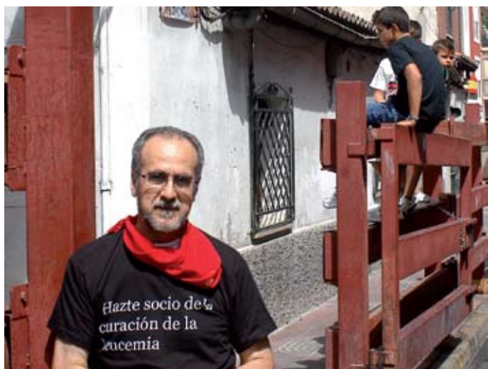
Encierro solidario. El Ayuntamiento ha colaborado durante las fiestas con la Fundación Josep Carreras en la campaña de sensibilización contra la leucemia.