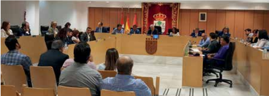
▲ Vista del Salón de Plenos del Ayuntamiento, durante la jornada en la que se aprobaron las medidas.

En el Pleno extraordinario celebrado el pasado 15 de octubre se ha aprobado una serie de modificaciones en las ordenanzas municipales para mejorar la información y la transparencia en materia fiscal, facilidades para el pago de los distintos tributos, y una rebaja de impuestos que es la primera del presente mandato.