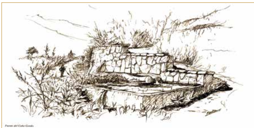
Fuente del Caño Gordo.

Como vengo diciendo tanto la fuente como el lavadero era ese lugar donde se hablaba de todo y de todos, y a veces las lenguas de doble filo ponían a las concurrentes al corriente de las ultimísimas “novedades”, y algunas eran tan subidas de tono que rayaban lo permitido, de que si la fulana no es trigo limpio, que le he visto a mengano merodear su casa a horas intempestivas, que si la hija de la fulatina se ha quedado embarazada, y por