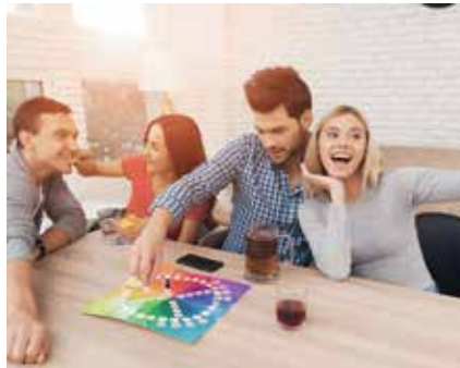
▲ Juegos de mesa, el martes día 5.