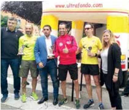
▲ Los ganadores con los representantes municipales.

La Asociación de Vecinos La Zaporra, uno de los barrios con más solera de Sanse, celebró la 46ª edición de su Carrera Popular el pasado 12 de octubre, con la colaboración del Ayuntamiento y el Club ñ Ultrafondo de atletismo. Se trata de una de las carreras populares más históri-