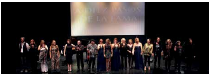
▲ Los componentes de 'A diez pasos de la fama', saludan al público al final del montaje musical.

Sus voces, lo mismo dan vida a una heroína que a una mujer fatal o a algún muñeco animado. Cantan como los ángeles, lo que les ha valido que los mejores artistas del mundo las reclamaran para sus coros. Ellas, después de haber estado muchas veces 'A diez pasos de la fama', son ahora las protagonistas.