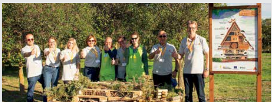
▲ Los empleados de de la Academia SIKA, durante la visita a la Granja San José de la Fundación.

Un grupo de empleados de SIKA ha visitado la Granja San José para realizar una acción de voluntariado corporativo, enmarcada en el proyecto de Naturalezas Diversas. En esta ocasión, más de 20 participantes de la Academia Sostenible de SIKA, estuvieron involucrados en la construcción de hoteles de insectos, con el fin de atraer insectos beneficiosos y potenciar la biodiversidad en un jardín o espacio verde. ■