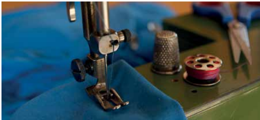
▲ Taller de costura de la asociación 'Pinturarte', los lunes de 10 a 12 h, o los viernes de 18 a 20 h.