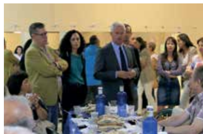
▲ El alcalde y la concejala, durante la visita.

Una delegación del Equipo de Gobierno, encabezada por el alcalde, Narciso Romero, y la concejala Bienestar y Protección Social, Margarita Fernández de Marcos, ha asistido a una cata del menú del servicio de comida a domicilio que ofrece el Ayuntamiento a personas que por diversas circunstancias no pueden desplazarse a un comedor social. El objetivo de esta iniciativa es facilitar una alimentación sana y saludable a personas mayores de 60 años, discapacitadas y/o dependientes que tengan problemas graves de movilidad, que vivan solas o convivan con otras en situación similar, y que estas circunstancias impidan su desplazamiento a un comedor social. Para acceder a este tipo de ayuda es necesario solicitar cita previa con una trabajadora