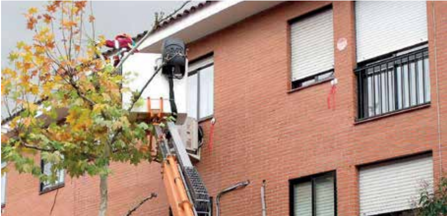
▲ La poda y el mantenimiento de los árboles es importante para la seguridad de los vecinos.

Del 4 de noviembre al 31 de marzo de 2020 se va a desarrollar el 'Plan de poda' y de 'tratamientos por endoterapia en coníferas' organizado por el Ayuntamiento, en concreto a cargo de la Concejalía de Parques y Jardines, en todo el término municipal para el adecuado mantenimiento de nuestros árboles.