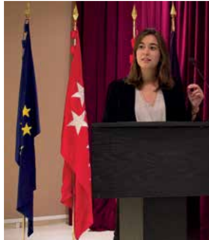
▲ Belén, en una de sus últimas intervenciones.

Más bien yo preguntaría para qué no sirve. El ser humano está constantemente comunicando ideas, sentimientos, conocimiento etc. La oratoria te proporciona una ventaja competitiva en tu día a día.