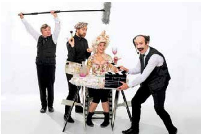
▲ 'Gag Movie', de Yllana, el sábado 2, a las 20:00 h. en el TAM.