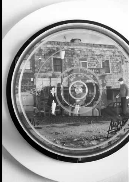
▲ Pieza de la exposición Sueños de multitudes La época de oro de los juguetes ▼

LA ÉPOCA DE ORO DEL JUGUETE Una exposición temporal Hasta el 30 de abril