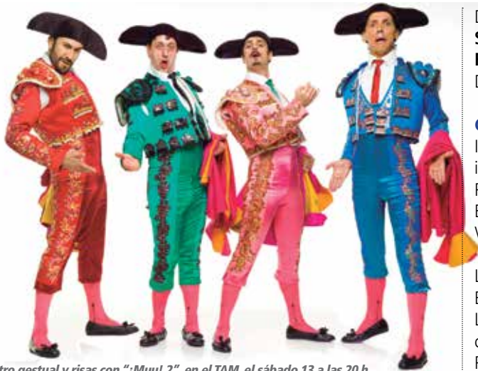
Teatro gestual y risas con "¡Muu! 2", en el TAM, el sábado 13 a las 20 h.