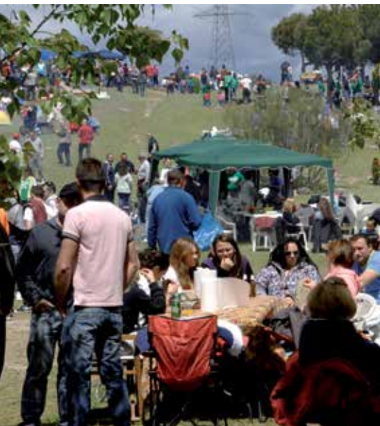
La caldereta es un evento popular al que acuden miles de vecinos.

S e ha abierto el plazo de inscripción para los concursos de caldereta popular; migas y repostería que se celebrarán el próximo 2 de mayo en la Dehesa Boyal, destinado a entidades y grupos vecinales. Oficina de Promoción, Turismo y Festejos, hasta el día 11 de abril.