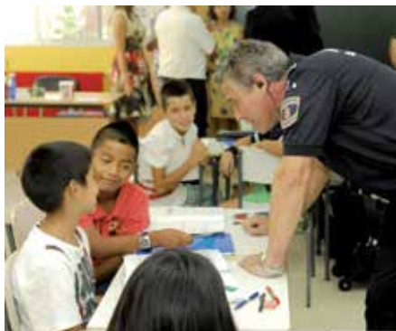
Un policía local da unas explicaciones a los niños durante el curso pasado.

El Ayuntamiento, a través de las delegaciones de Educación, Bienestar Social y Seguridad Ciudadana, pone en marcha, al igual que hizo el curso pasado, y en base a los resultados positivos obtenidos, el Programa "De 6º a 1º". Las sesiones al alumnado y a las familias se impartirán por técnicos municipales y agentes de la Policía Local.