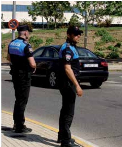
Nuestro municipio ha visto reducido significativamente el número de delitos registrados.

"Con estos datos -indica asimismo Matiares- damos respuesta a uno de los compromisos electorales más importantes adquiridos con nuestros vecinos, como es la lucha