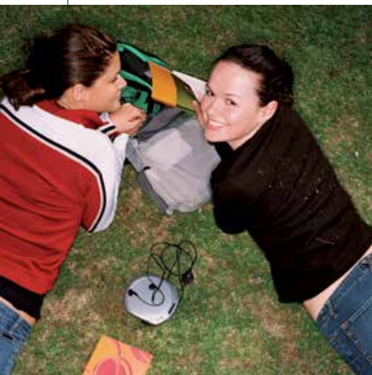
Las lenguas que se pueden estudiar son: inglés, francés, alemán, italiano, portugués y ruso.

A través de la Oficina Joven Comunidad de Madrid –TIVE- se ofrece a los jóvenes una formación en idiomas mediante la realización de cursos en el extranjero durante todo el año. La Oficina colabora y realiza la gestión entre los jóvenes y las escuelas de idiomas internacionales.