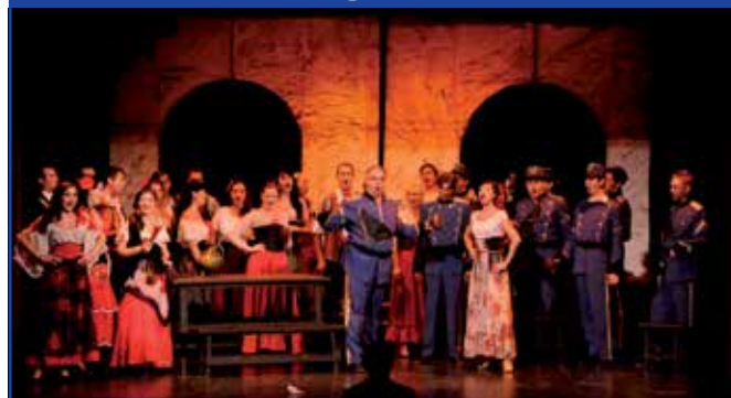
La Ópera 'Carmen' de Bizet, el sábado 22 de marzo a las 20 h. en el TAM.

D rama de amor y celos que gira en torno al personaje de la gitana Carmen, una mujer tan pasional como libre que sabe el efecto que produce en los hombres y no duda en utilizarlo. El sargento Don José se cruza en su camino con terribles consecuencias. El 3 de marzo de 1875 se estrenaba en París con un rotundo fracaso. Hoy en día es la ópera francesa más conocida e interpretada en el mundo. El éxito se debe al equilibrio entre el libreto (con escenas cómicas, trágicas) y la música de Bizet con la magnífica orquestación, coros, arias y temas musicales fáciles de memorizar como son la Habanera o el famoso Toreador. La interpretación de esta obra corre a cargo de la compañía Donbass Opera. Es una formación proveniente de la ciudad de Donetsk, situada en suroeste de Ucrania, junto a la frontera con Rusia. El Teatro Nacional de Ópera y Ballet se construyó a principios del siglo XVIII siendo, por tanto, uno de los teatros con mayor tradición de ópera de los países que formaron parte de la Unión Soviética. ●●●