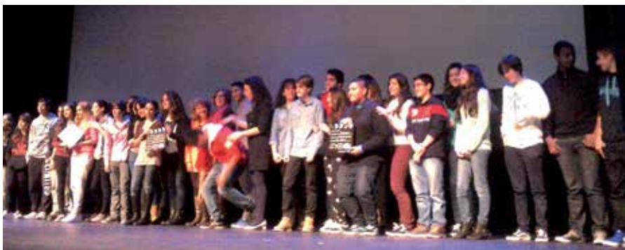
Los estudiantes protagonistas del proyecto.

Con motivo del Día Internacional de la Mujer, y dentro del programa de actividades que desde la Delegación de Igualdad del Ayuntamiento se ha llevado a cabo entre la población escolar en el fomento de la Igualdad de géneros y la prevención en materia de Violencia de Género, tuvo lugar en el Teatro Adolfo Marsillach la presentación de los Cortos de Cine "Relaciones Afectivas Igualitarias".