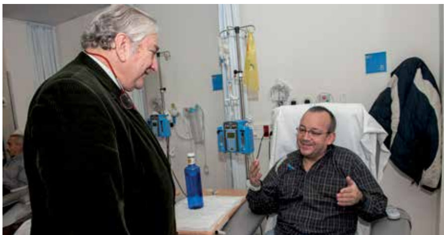
El consejero de Sanidad, Javier Rodríguez, en su visita al Hospital Infanta Sofía.

Junto a la actividad del Hospital de Día, el servicio de Oncología registró el pasado año 315 ingresos, un 13,3% más que el año anterior, y