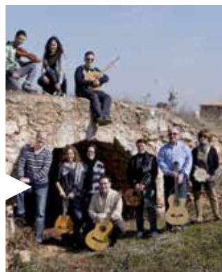
"Puente Viejo", el viernes 28 de marzo en la Sala Martín Chirino.

Además: talleres de manualidades, juegos de mesa y de grupo, ping-pong, dardos, consolas Wii y Play Station 3, música, otras propuestas.