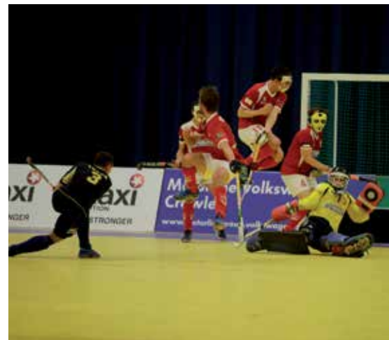
El CH Complutense es el referente a nivel nacional en Hockey Sala, y lo han vuelto a demostrar.

"Sigue el vídeo en Canal Norte con tu móvil"