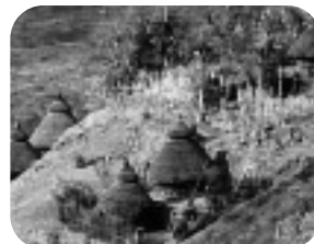
TRIBUS DE ETIOPÍA. Martes, 22.15 h.