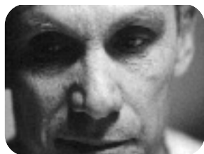
ED GEIN. Lunes, 22.45 h.