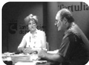
TERTULIAS POÉTICAS. Jueves, 22.15 h.