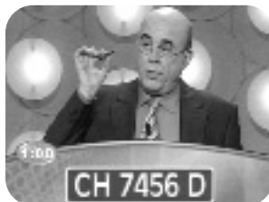
MATRÍCULA. Lunes a viernes, 21.45 h.