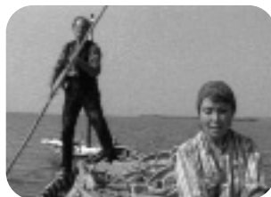
CAÑAS Y BARRO. Viernes, 21.40 h.