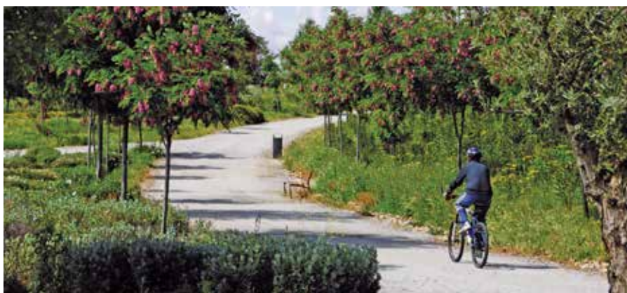
La iniciativa quiere potenciar el uso de la bicicleta en los desplazamientos cotidianos, completando así el uso del carril bici que ya conecta todos los centros públicos municipales y otros puntos de interés.

En esta primera fase de instalación de soportes aparcabicicletas, se ha tenido en cuenta su compatibilización con el programa “Camino escolar seguro”, fomentando el uso de la bicicleta entre la población escolar. Con el fin de