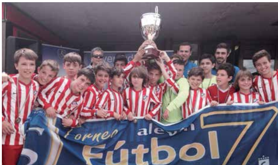
El equipo colchonero, de categoría alevín, levantando el trofeo.

El At. Madrid se proclamó campeón del XII Torneo Diego Alcalá Rivero, reservado para categoría alevín. El equipo rojiblanco se impuso en los penaltis en la final al Rayo Vallecano, después de que el tiempo reglamentario finalizase con 1-1. El tercer puesto fue para el equipo anfitrión, el Juventud Sanse, que venció, también en los penaltis, al Extremadura de Almendralejo. Este año no jugó el Real