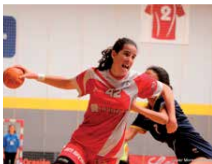
Lance de juego en la final contra el BM Alcobendas.