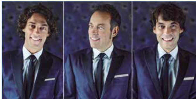
'Café Quijano', con el espectáculo 'ORÍGENES: El Bolero', el sábado 23 en el TAM.