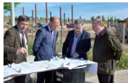
El alcalde con los representantes de la Comunidad de Madrid.

"La colaboración con la Comunidad de Madrid desde el año 2007 ha sido extraordinaria, -continuó-, ya que durante estos años nuestra ciudad ha reci-