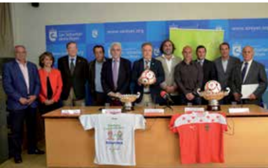
Foto de familia durante el acto de presentación.

Jugadores veteranos del Real Madrid y de la Real Federación de Fútbol de Madrid disputarán el 21 de mayo un partido benéfico cuyos fondos se destinarán a la investigación oncológica en España a través de la Fundación Vencer el Cáncer.