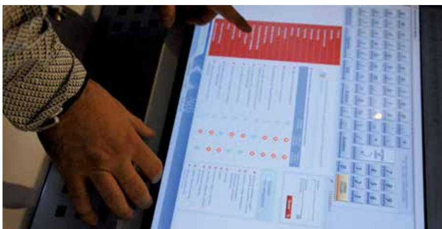
Gracias al certificado digital se pueden realizar múltiples trámites administrativos.

Gracias al certificado se pueden realizar multitud de trámites sin necesidad de desplazarse a las oficinas de la administración correspondiente, como por ejemplo la Declaración de la Renta o solicitar el Certificado de la Vida Laboral, tributos pendientes o pago de los impuestos municipales. Durante los próximos meses, también en la web del Ayuntamiento, se incorporarán más trámites online para facilitar las gestiones que requerirán disponer de un certificado digital. Un Certificado Digital es un documento electrónico firmado también electrónicamente por una entidad certificadora -en este caso Camerfirma- que acredita la identidad del titular. ●●●