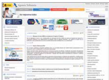
Web de la Agencia Tributaria Española.

La Agencia Tributaria no envía mensajes de texto telefónicos para recordar al contribuyente que puede solicitar el envío de los borradores del Impuesto sobre la Renta de las Personas Físicas (IRPF). El desmentido de la Agencia se produce tras denuncias de usuarios sobre la recepción de mensajes de empresas que redireccionan a la web estatal a través de números de tarificación especial.