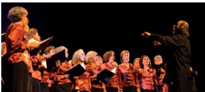
Concierto extraordinario de primavera de la Coral de Sanse, el viernes 22 en el TAM.