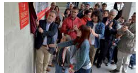
El alcalde descubre la placa en presencia de familiares y amigos.