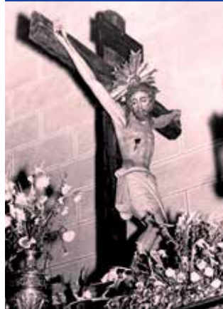
Una imagen del Santísimo Cristo procedente del Archivo.

Remedios, la exposición que tradicionalmente realiza el Archivo durante la semana de las fiestas estará dedicada a conmemorar dicha efeméride. Se incluirán imágenes del Santísimo Cristo y de los actos que giran en torno a él durante las celebraciones estivales. Todos aquellos vecinos que quieran colaborar con esta iniciativa pueden donar fotografías relacionadas con este tema al Archivo Municipal. Las imágenes les serán devueltas una vez digitalizadas. ●●●