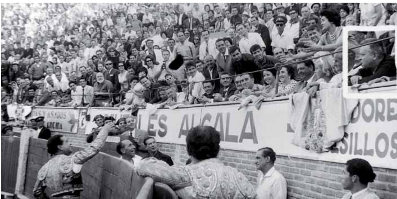
El matador brinda un toro ante la atenta mirada del mismísimo Orson Welles (recuadro), genio del cine y gran aficionado a la Fiesta. También estuvo aquí.