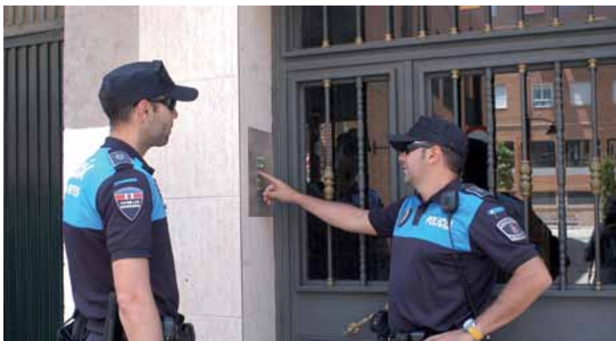
Uno de los elementos más importantes para prevenir robos en domicilios es la colaboración ciudadana.