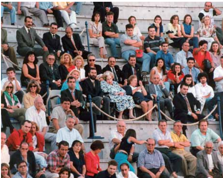
A La Tercera han acudido muchos personajes ilustres, entre ellos la madre de Su Majestad El Rey, Doña María Mercedes, que podemos ver junto al alcalde de la época, Ángel Requena, la concejala Pepa Aguado, y otros ediles.

A nivel artístico La Tercera fue una plaza de temporada en las décadas de los 60 y 70, programando numerosas novilladas de promoción, pasado a ser de feria a partir de los 80 del siglo pasado.