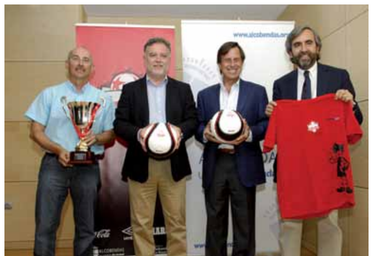
Los alcaldes de Sanse y Alcobendas (centro) junto a los responsables de la organización.

El torneo reúne a equipos locales y de todo el país junto a otros internacionales como ITALIA: 3 equipos.; BRASIL: 3 equipos; USA: 2 equipos; MARRUECOS: 2 equipos; VENEZUELA: 2 equipo; SUDÁFRICA: 2 equipos; PORTUGAL: 1 equipo; IRLANDA: 1 equipo. Las categorías se dividen en edades que van desde los 10 a los 18 años. Los partidos están siendo de 50 minutos (divididos en dos tiempos de 25 minutos) con sustituciones libres para cada equipo. ●●●