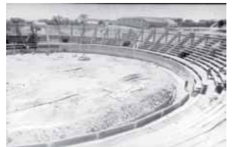
Vista de la plaza en plena construcción. Sólo se tardaron 40 días, por lo que se llamó "la del Diluvio".

A partir de la feria de 1962 fue gestionada por San Nicolás como empresario, aunque a partir de 1965 fue alquilada durante unos años. Des-