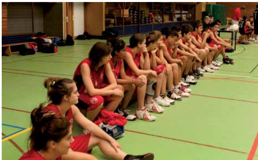
El Campus de baloncesto que ofrece el club Zona Press es uno de los que tienen más solera. Todavía está abierta la inscripción para la segunda quincena de agosto.

balonmano, tenis y pádel que son los campus deportivos que se han ofertado este año para que, a lo largo de julio y la primera quincena de agosto, los niños y niñas de Sanse puedan hacer deporte y divertirse.