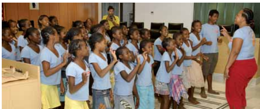
La coral de niñas Fundación Agua de coco, en plena actuación dentro del salón de plenos.

La coral acaba de cerrar un circuito de actuaciones en Francia, Andorra, Cataluña y la Comunidad de Madrid. ●●●