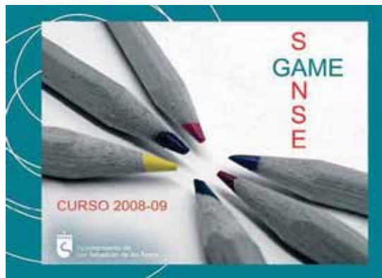
La guía GAMESanse está pensada y diseñada para que los niños ocupen el tiempo libre de forma positiva.

Sobre cada actividad, la agenda ofrece información básica sobre la población