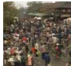
Carrera para salvar el planeta Jueves, 22,45 h.