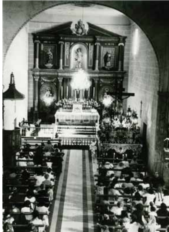
La ampliación de la ermita que se bendijo en 1508 se convirtió en la Capilla Mayor de la Iglesia de San Sebastián de los Reyes posteriormente.

Alcobendas, D. Pedro Álvarez de Santiago, para que incumpla la orden de administrar los Santos Sacramentos en esta nueva iglesia. Ya veremos lo que pasa, supongo que nos esperan años de juicios y apelaciones, como ocurre con el Concejo, pero hoy es un día de fiesta y hay que celebrarlo.