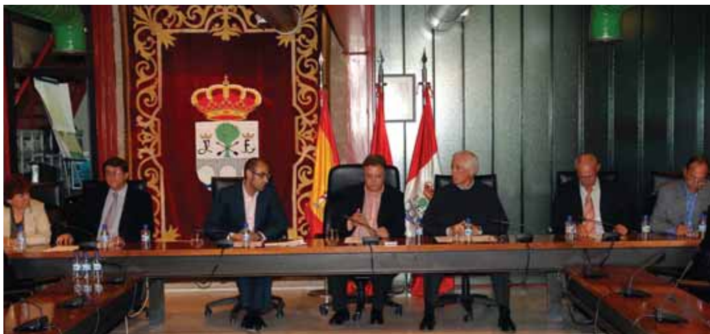
Imagen que escenifica un importante acuerdo con los representantes políticos de la corporación municipal y los de las ONGD tanto locales como de la Comunidad de Madrid.

El primer Pacto Local contra la pobreza en la Comunidad de Madrid fue rubricado el 16 de octubre, en el salón de plenos del Ayuntamiento por todas las formaciones políticas de la Corporación, la Federación de ONG de Desarrollo de la Comunidad de Madrid (FONGDCAM) y las ONGD locales.