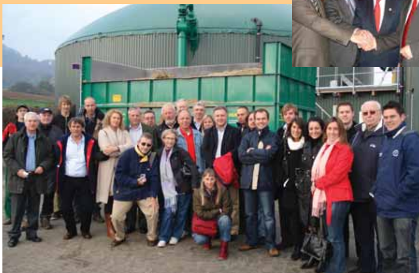
La delegación de Sanse visitó una planta de biogás que produce esta energía renovable.