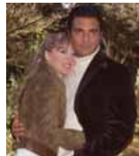
Mujer de madera Lunes a viernes, 9,15 h.