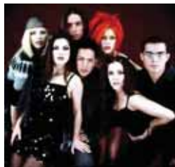
Dkda, sueños de juventud Lunes a viernes, 21,30 h.