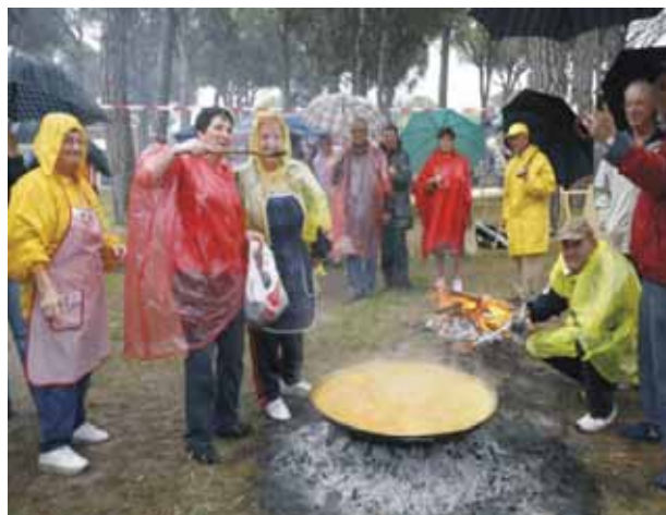
Con este programa se pretende favorecer un envejecimiento saludable de las personas mayores de nuestro municipio.

Las sesiones distribuidas en horario de mañana y tarde tocarán aspectos muy diversos y siempre