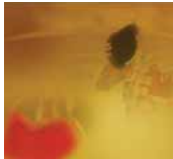
El trincherazo Lunes 3, 20,15 h.