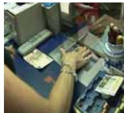
De compras por Sanse Martes y jueves, 20,15 y 22,25 h.