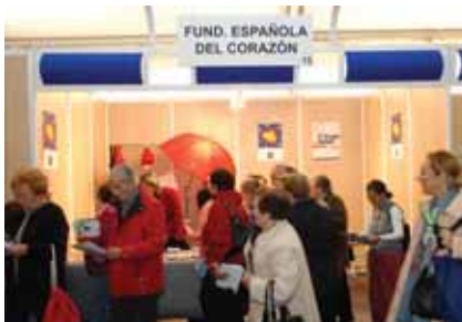
26 entidades sanitarias han participado en una muestra que se ha estrenado con buen pie.

26 entidades sanitarias han participado en una muestra por cuyos stands han pasado numerosos colectivos ciudadanos que han podido corroborar las actuaciones del siste-