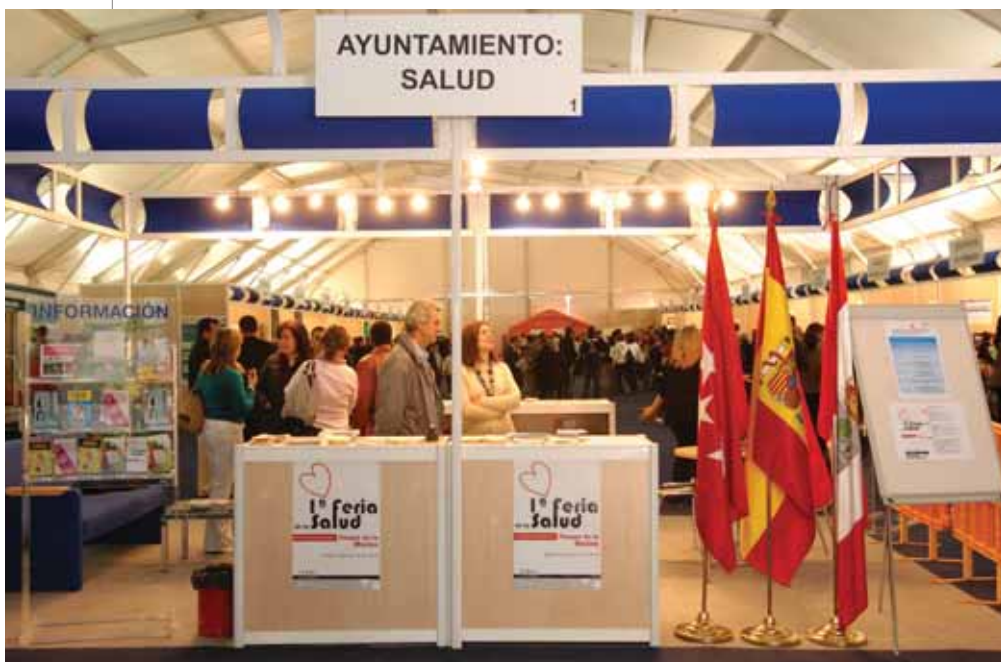
Stand informativo de la Feria, a cuyas instalaciones acudió gran cantidad de público para conocer de primera mano todos los factores que conciernen a la salud.