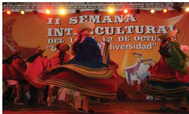
En la Semana Intercultural se dan cita y celebran las manifestaciones culturales de las comunidades foráneas que viven en Sanse.

La iniciativa de la Concejalía de Inmigración ofreció un nutrido número de actividades concretadas en 3 cuentacuentos, 14 talleres de carácter lúdico e infantil, diversas animaciones en varios puntos de la ciudad, 3 exposiciones y un mercado de comercio justo y varios conciertos. El impulso conjunto aportado por 21 or-