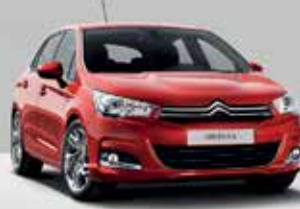
CITROËN C4 TONIC POR 11.500€*