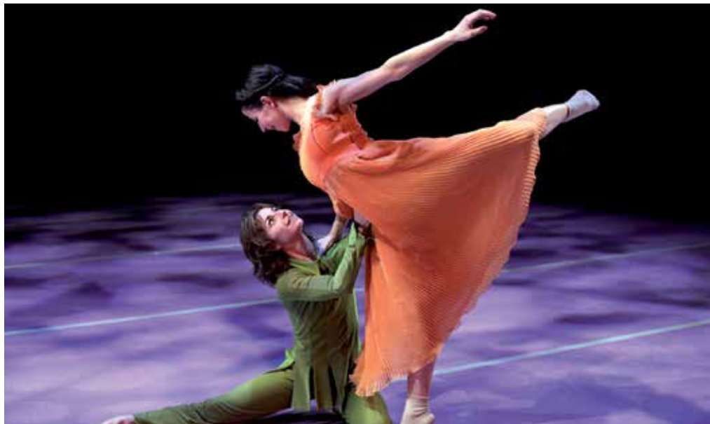
'Peter Pan', premio Max de las Artes Escénicas al Mejor Espectáculo Infantil, llega al TAM el domingo 13 a las 18 h.