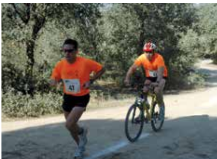
Momentos de la carrera durante ediciones anteriores, en una competición que organiza el club ñ Ultrafondo.