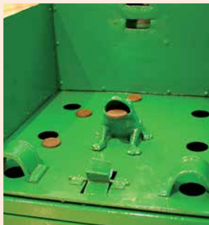
El origen de este juego popular se remonta al antiguo Egipto de los faraones.

H ace algunos años era frecuente ver en las terrazas de algunos bares, el denominado juego de la rana, consistente, según la RAE, en "introducir desde cierta distancia una chapa o moneda por la boca abierta de una rana de metal puesta sobre una mesilla o por otras ranuras convenientemente dispuestas". En efecto, además de la figura central de la rana, sentada sobre sus patas traseras, se encuentra justo delante un molinete; a los lados del frontal, dos puentes; y, por detrás, cuatro aberturas redondas flanqueando a la verde y boquiabierta rana (en este caso, todo el soporte del juego está