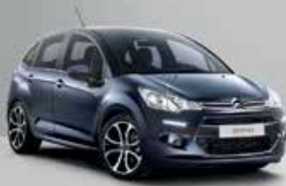
CITROËN C3 TONIC POR 7.990€*