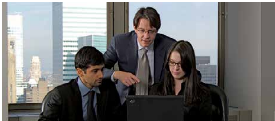
El encuentro busca ayudar y ser un estímulo para la gestión de cualquier negocio.

Este año se dará cabida a las personas, que se encuentran en búsqueda activa de empleo, para las que se ha organizado el taller