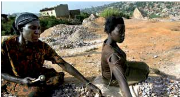
La Muestra recoge imágenes sobre mujeres en distintas partes del mundo.

Esta exposición gráfica ha sido producida por Amnistía Internacional con fondos de fotógrafos colaboradores de esta organización. Ahora viene a nuestra ciudad en el marco de las actividades municipales organizadas para conmemorar el 'Día Internacional para la Eliminación de la Violencia contra la Mujer.