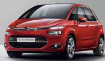
CITROËN C4 PICASSO SEDUCTION POR 14.200€*