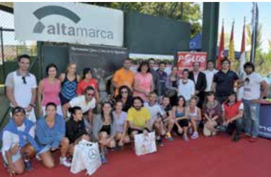
Foto de familia con participantes y organizadores.

El pasado 25 y 26 de octubre se celebró en las instalaciones de Pádel del Polideportivo Municipal "Dehesa Boyal" el IV Torneo de pádel benéfico "Hermandad", que un año más, la Hermandad del Stmo. Cristo de los Remedios ha organizado con un gran éxito de participación llegando a las 42 parejas inscritas repartidas en 3 categorías masculinas y 3 femeninas por niveles.